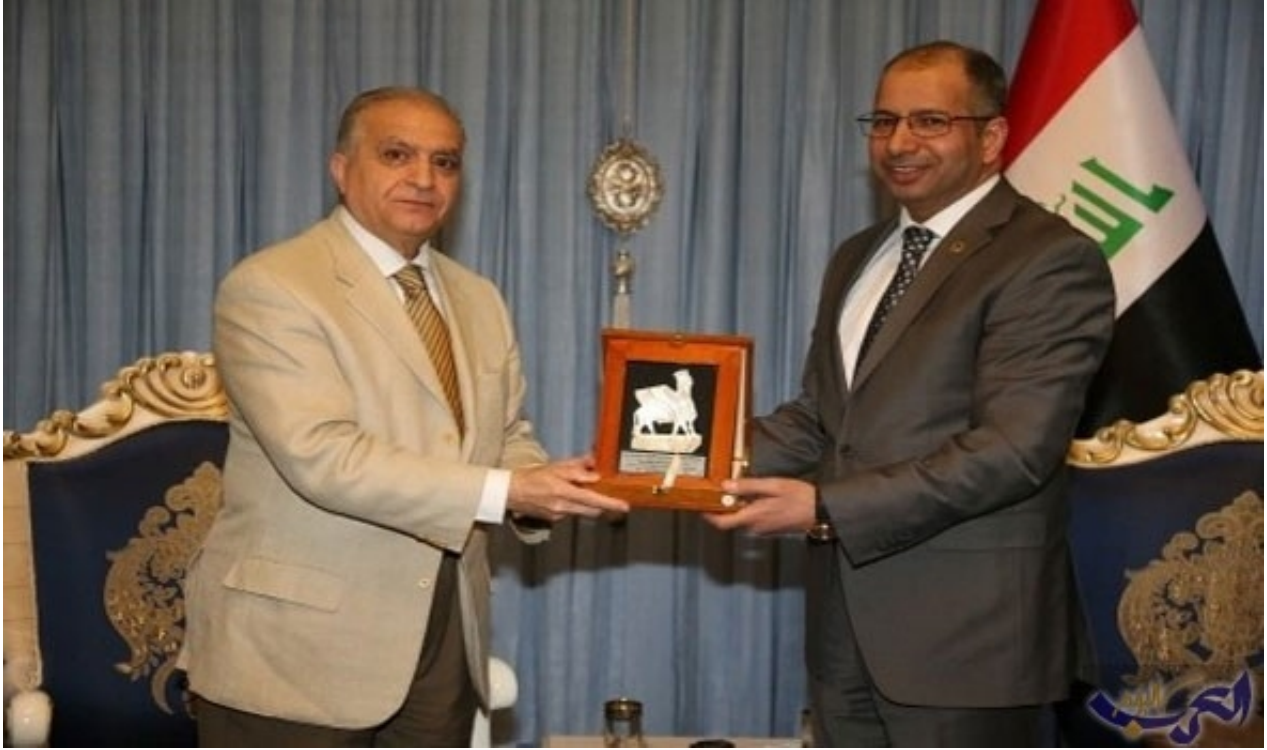
رئيس مجلس النواب سليم الجبوري يستقبل محمد علي الحكيم