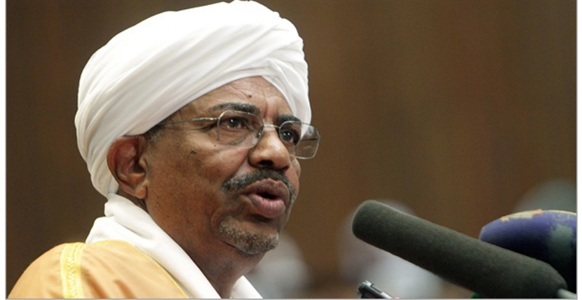
الرئيس السوداني- عمر البشير

وقع السودان مذكرة تفاهم مع لجنة الأمم المتحدة الاقتصادية والاجتماعية لغرب آسيا (أسكوا)، اليوم الاثنين، للتعاون الفني في المجالات الاقتصادية والاجتماعية والفنية والتكنولوجية وتقديم الاستشارات لمدة ثلاث سنوات.