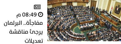
08:49 م مفاجأة.. البرلمان يرجى مناقشة تعديلات