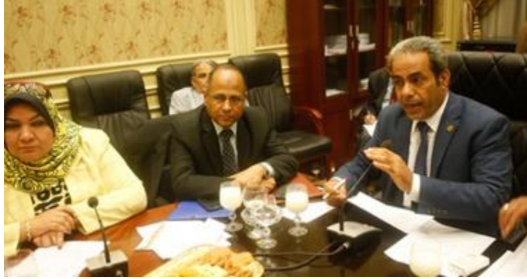
النائب عاطف مخاليف