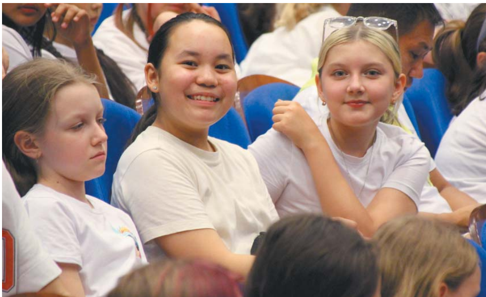
Занимательные интерактивы сопровождают детей всю смену