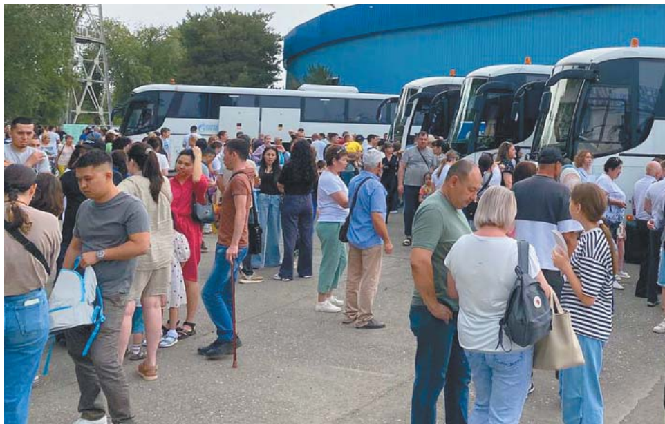
В ДОЦ имени А.С. Пушкина – на комфортабельных автобусах

Но обо всём по порядку. Перед официальным открытием праздничного вечера бодростью и позитивом юных отдыхающих хорошенько зарядили аниматоры, которые провели с ребятами занимательный интерактив. Далее те, кому предсто-