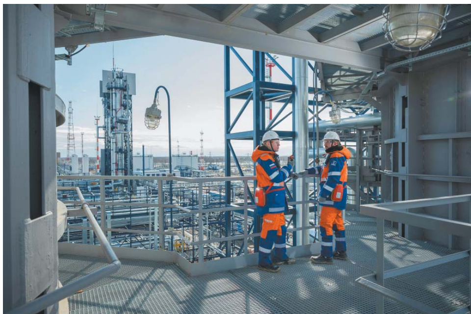
На Уренгойском месторождении

Оператор разработки участка 3А ачимовских залежей Уренгойского месторождения – «Газпром нефть». Для работы над проектом компания с использованием российского программного комплекса создала трёхмерную геологическую модель участка месторождения. Была сформирована программа опытно-промышленных работ. По их результатам подобраны эффективные технологии бурения и добычи – с помощью скважин с рекордной для отрасли длиной горизонтальных участков (до 1800 м) и метода многостадийного гидроразрыва пласта. Рассчитано более