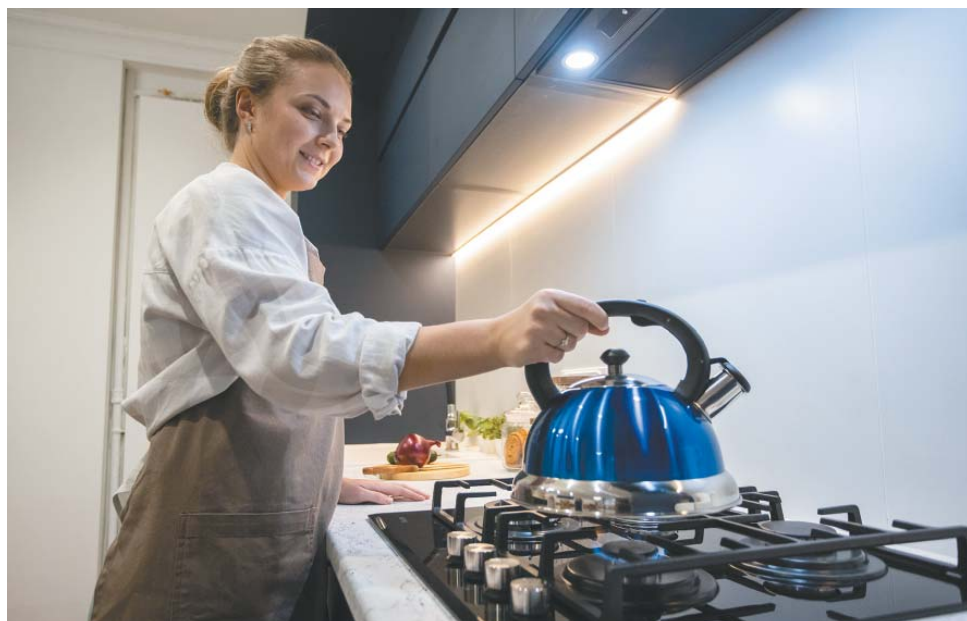
Газификация и догазификация регионов России – это ключевые социальные проекты «Газпрома»

Правление ПАО «Газпром» приняло к сведению информацию о ходе выполнения программ развития газоснабжения и газификации субъектов Российской Федерации в 2024 году.