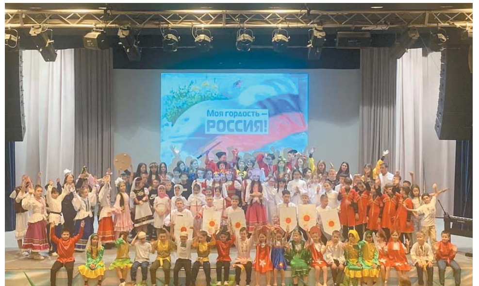
Яркое театрализованное действие юные пушкинцы подготовили при участии старших наставников