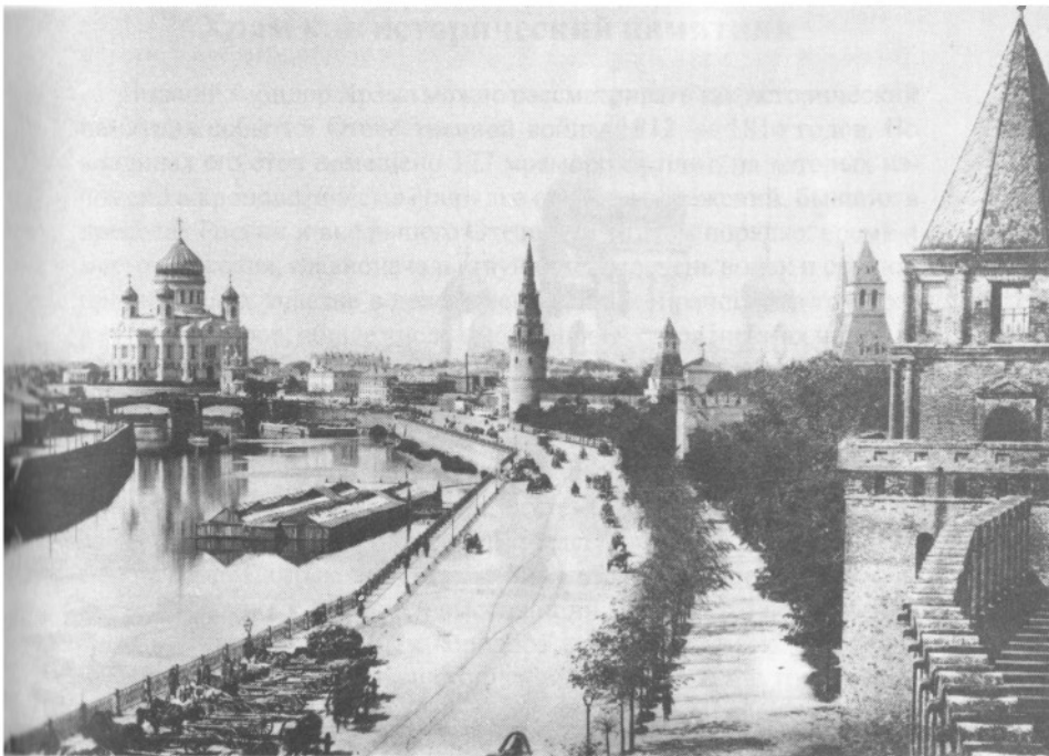
Панорама Москвы с Кремлем и Храмом Спасителя со стороны Москворецкого моста

ним образ святого благоверного князя Александра Невского, исполненный профессором Сорокиным 10 , а сверху образа живописно изображен художником Фартусовым 11 Храм Христа Спасителя по проекту архитектора Тона. Здесь же манифест о построении Храма во имя Христа Спасителя в Москве и два рисунка этого Храма по проекту Витберга. У западных дверей все описания заканчиваются манифестом о взятии Парижа и низложении Наполеона I и о заключении мира в Европе. Всех плит по этому опоясывающему Храм внутреннему коридору 177.