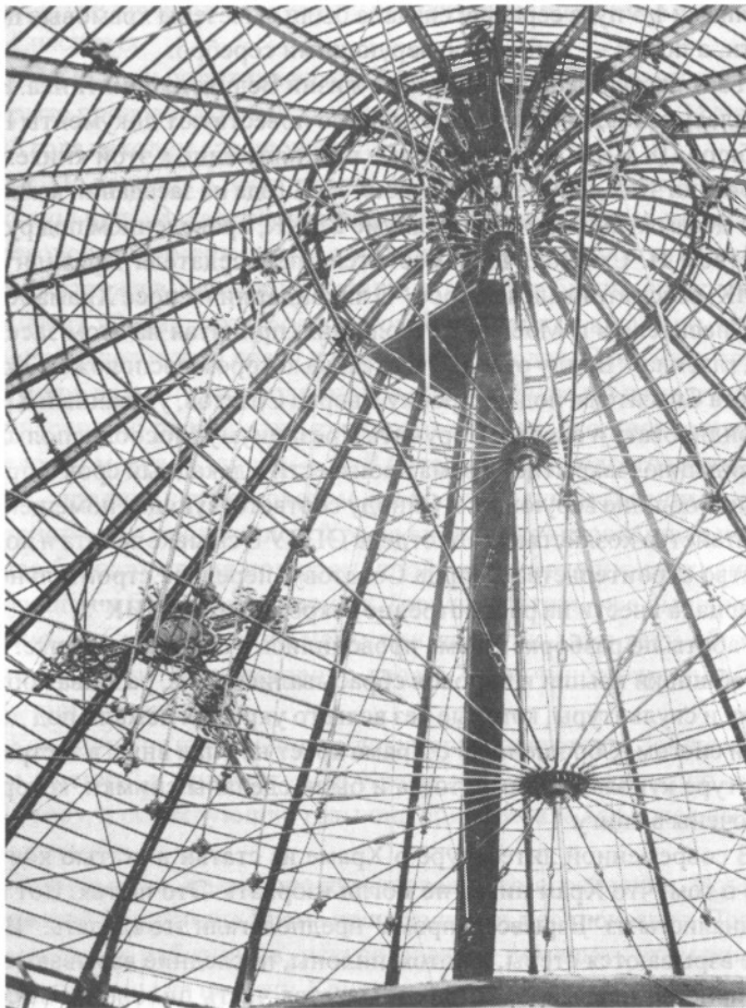
Фермы главного купола. Снятие креста