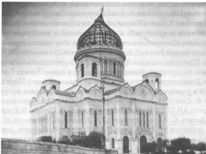
Храм с северо-запада во время разборки

взрывается остальная часть”. Страшный этот план был осуществлен 5 декабря 1931 года в течение 45 минут. Как это происходило, многим знакомо по кинокадрам.