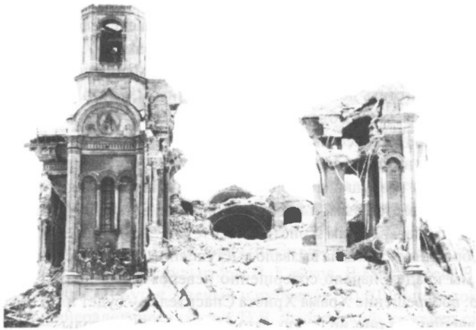
Храм после взрыва

5 декабря 1990 г. на Волхонке появился закладной камень часовни во имя иконы Державной Божией Матери, вскоре здесь же был установлен крест и начались регулярные службы в праздники и воскресные дни.