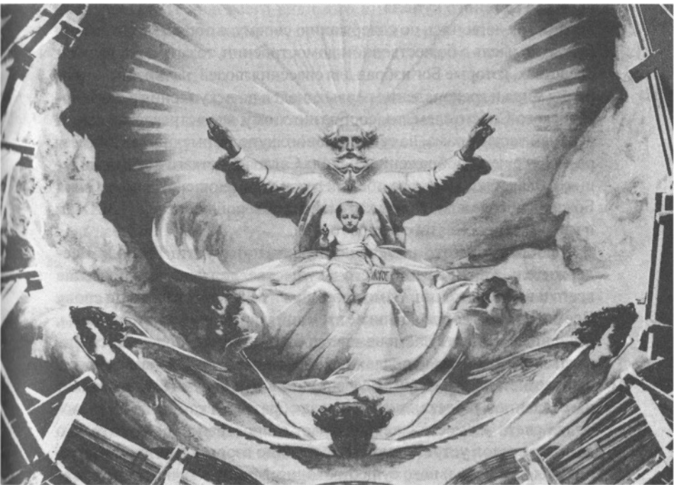
Свод главного купола с изображением Господа Саваофа. Восточная сторона. Исполнил профессор А.Т.Марков

этого Храма напоминала о всех милостях Господних, ниспосланных по молитвам праведников на русское царство в течение девяти веков. Этой идеей, а также целями сооружения Храма комиссия по построению Храма и руководилась в выборе и распределении сюжетов священных изображений.