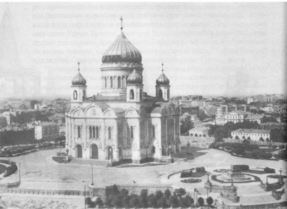
Храм с юго-востока (со стороны Пречистенской набережной)

По коридору этому совершаются крестные ходы во второй день Рождества Христова и в других случаях, когда ненастная погода не позволяет в дни крестных ходов совершить таковые вне Храма.