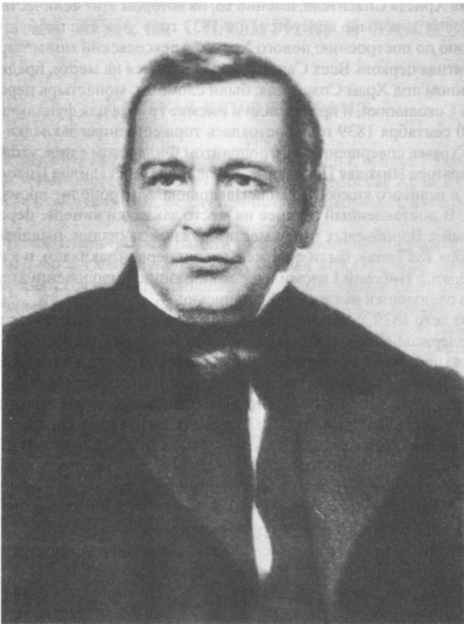
Строитель Храма Константин Андреевич Тон (1794-1881)