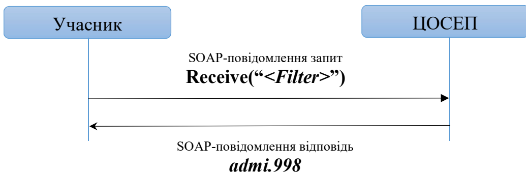
Рис. 1. Схема обміну повідомленнями

Учасник викликає сервіс ЦОСЕП та передає SOAP-повідомлення – запит на отримання інформації від ЦОСЕП. Для цього використовується операція Receive з параметром Filter , який визначає тип (структуру) даних, що необхідно надати Учаснику (докладно описано у документі «Технологія обміну» пункт «Бізнес-сценарій 2. Запит на отримання фінансової інформації»). У відповідь на цей запит ЦОСЕП надає Учаснику SOAP-повідомлення – відповідь, яке містить повідомлення ISO 20022 admi.998 з даними, тип яких було зазначено у параметрі Filter запиту.