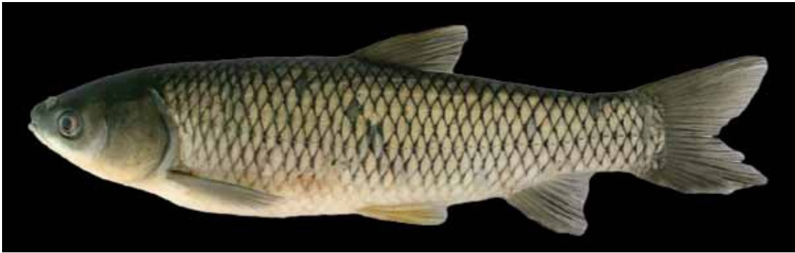
Comprimento padrão 228,4 mm