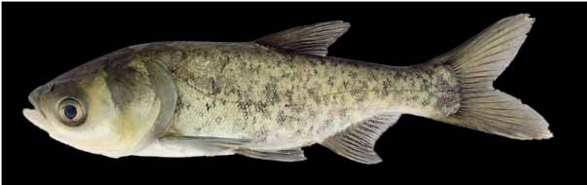
Comprimento padrão 179,7 mm