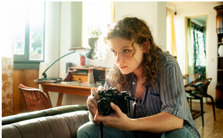
A son image de Thierry de Peretti