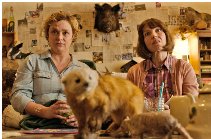
Les Pistolets en plastique de Jean-Christophe Meurisse