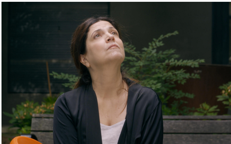
Ma vie ma gueule de Sophie Fillières