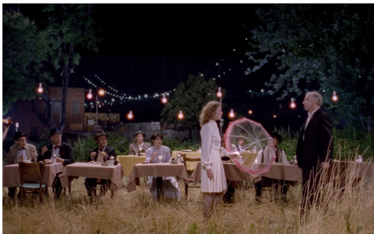
Histoires d'Amérique... de Chantal Akerman