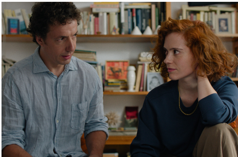
Septembre sans attendre de Jonás Trueba