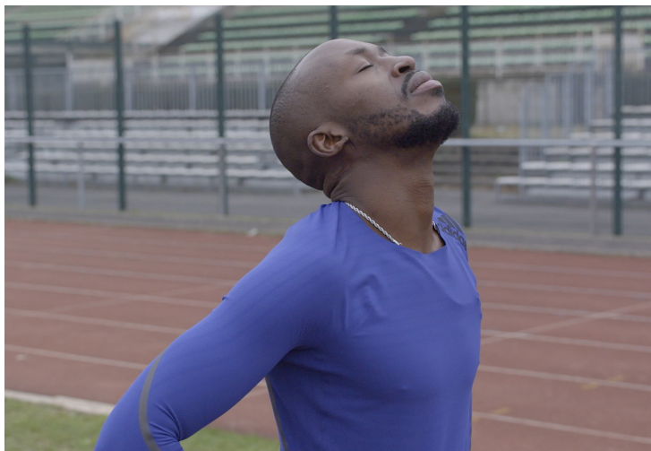
Triomphe de Audrey Espinasse - Sami Lorentz © Agence du Court Métrage