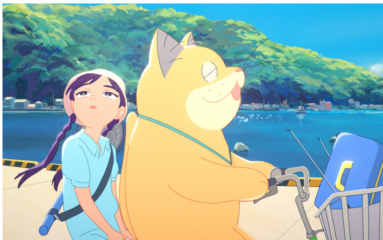
Anzu, chat-fantôme de Yoko Kuno et Nobuhiro Yamashita