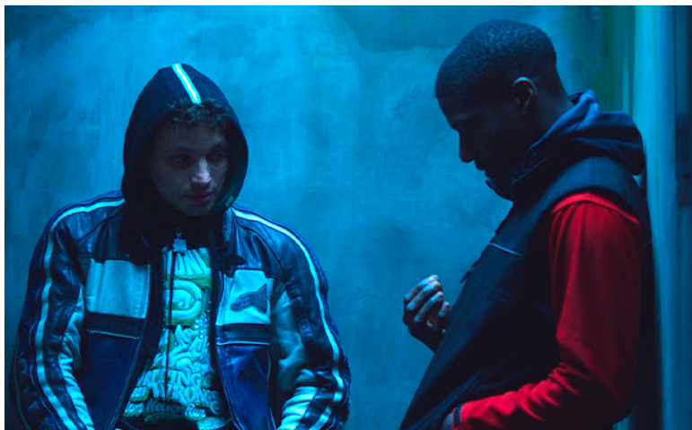
Eat the Night de Caroline Poggi et Jonathan Vinel