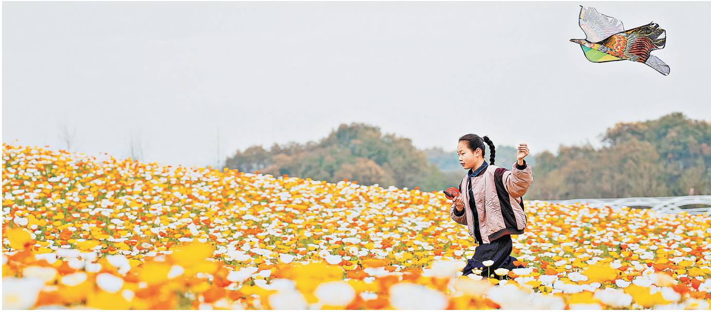
Девушка запускает воздушного змея в Чжэньцзяне, провинция Цзянсу.