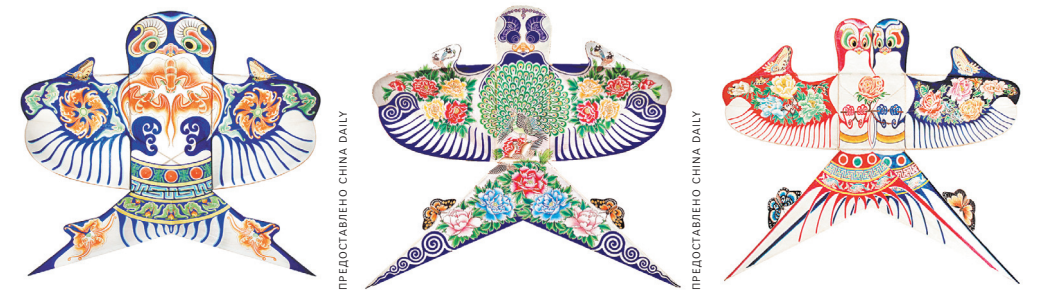
Несколько видов воздушных змеев с различными узорами, цветами и симметричной структурой.