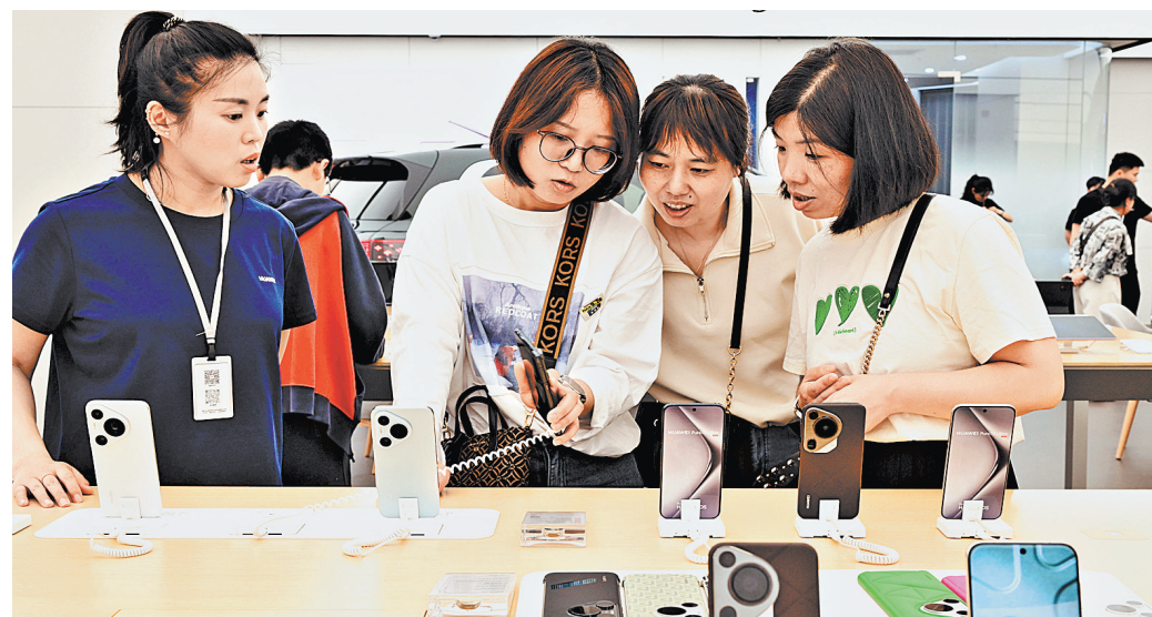
Huawei выпускает много интересных моделей смартфонов, которые заслуживают внимания покупателей. Фирменный магазин в городе Цзиньхуа, провинция Чжэцзян.

Янь, поставщик продуктов для 3D-печати, сказал, что, хотя Yi Design повторно использует некоторые керамические отходы для производства своей продукции, это, возможно, не единственное решение проблемы утилизации. «Но они представили эту проблему общественности, информируя людей о ее существовании, а также предложив решение», — сказал он. — Философия Yi Design меняет мои мысли и поведение, а также мысли и поведение многих других людей, заставляя нас более уважительно относиться к окружающей среде и защищать ее. Я верю, что все больше и больше людей будут вносить свои собственные изменения в окружающую среду в будущем». ●