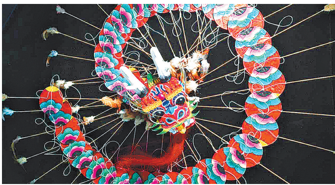
Воздушный змей-многоножка с головой дракона, изготовленный Ян Хунвэй.

она. — У нас идеальные ветровые условия, много высококлассных мастеров и много различных видов воздушных змеев ручной работы». Деревня Янцзябу достаточно густа, но при этом она стала домом для двух объектов нематериального культурного наследия национального уровня — воздушных змеев и новогодних картинок Янцзябу — традиционного вида ксилографии, используемого для украшения домов во время Праздника весны.