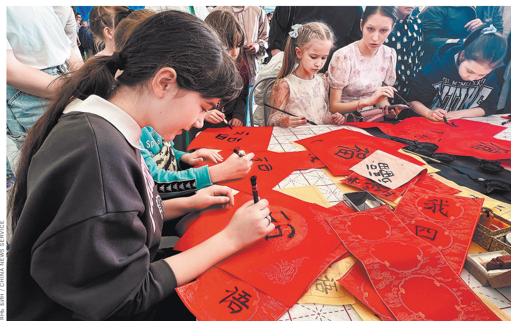
Российские дети практикуют китайскую каллиграфию во время мероприятия в рамках культурного обмена в Москве 20 апреля, в День китайского языка.

По словам экспертов, двухдневный визит президента Владимира Путина в Китай, который начался 16 мая и стал его первой зарубежной поездкой за время нового срока полномочий, нацелен на то, чтобы подпитать всеобъемлющее стратегическое партнерство двух стран на новый уровень.