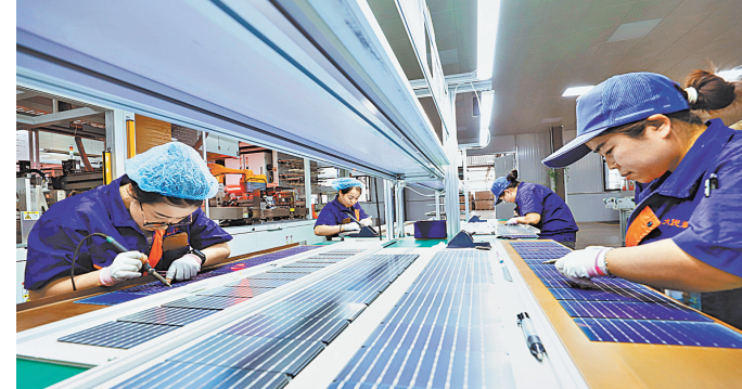
Сотрудники технологической компании проверяют солнечные батареи в Чжанье, провинция Ганьсу.

По данным Всемирной организации интеллектуальной собственности, Китай занял 12-е ме-