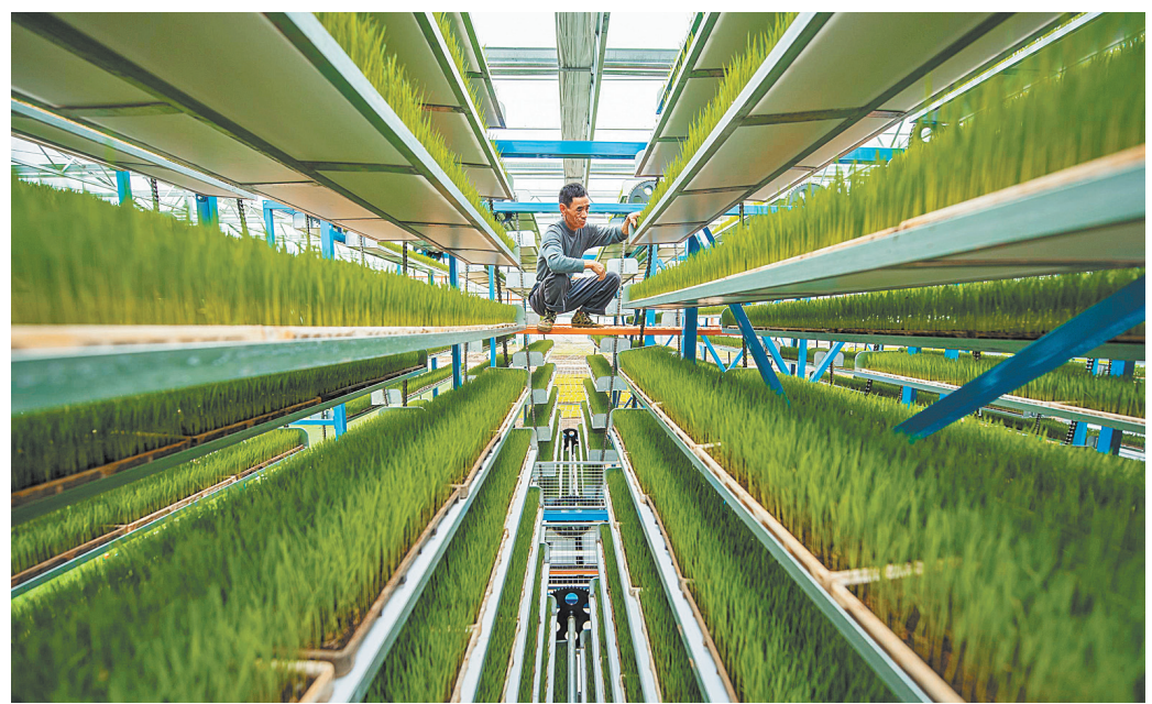
Выращивание риса в интеллектуальной теплице. Узу, провинция Аньхой.

Саньтан является одной из основных баз по выращиванию бок-чой в стране. В последние годы некоторые местные производители увеличили урожайность и доходы, внедрив новые технологии и новое оборудование для крупномасштабного выращивания. «В этом году я посадил 60 му бок-чой. Все поливальное оборудование было модернизировано для цифровой автоматизации, и простым нажатием кнопки начинается процесс полива. Новые технологии и оборудование повысили как эффективность, так и доходы», — говорит Ван Вэньшэн, владелец теплицы в деревне Чжэньдун. — С помощью передовых технологий