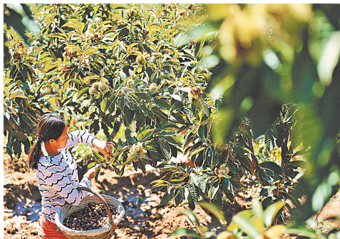
Сентябрьский сбор урожая каштанов в уезде Куаньчэн провинции Хэбэй.

ны развития каштановой промышленности, а также всесторонне содействовать защите и наследованию традиционной системы выращивания каштанов в Куаньчэне». В использовании сельскохозяйственных преимуществ Куаньчэна на следующих этапах развития «зеленой» экономики помогает отечественная компания Shen Li Food. Группа по производству продуктов питания сотрудничает с 200 тысячами местных фермеров и предлагает более 70 видов каштанов и сопутствующих продуктов, которые экспортируются в более чем 30 стран и регионов, включая США, Германию и Японию. Инновационные меры в бизнесе включают долгосрочные научно-исследовательские и технологические связи с академическими институтами, чтобы обеспечить соответствие питательных веществ и уровня производства самым высоким стандартам, утверждает компания. «Мы работаем бок о бок с фермерами и местными жителями, чтобы развить нашу каштановую промышленность, принося реальную пользу экономике и улучшая условия жизни. Внесение в список наследия ООН позволит больше насладиться нашей продукцией», — сказал Хань Годун, заместитель генерального директора компании. ●