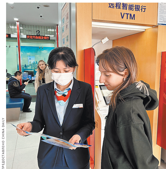
Сотрудница банка в Далине консультирует иностранных посетителей и знакомит с вариантами оплаты.