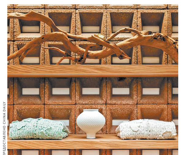
Полые кирпичи из утилизированной керамики используются в качестве фона для товаров в магазине шерстяных свитеров в Шанхае.

В первом квартале более 12 тысяч компаний с иностранными инвестициями начали свою деятельность в Китае, что на 20,7 процента больше, чем в прошлом году, а реальный объем инвестиций составил 301,7 млрд юаней (41,8 млрд долларов США), что на 41,7 процента больше, чем в четвертом квартале прошлого года, сообщило Министерство Коммерции КНР. ●