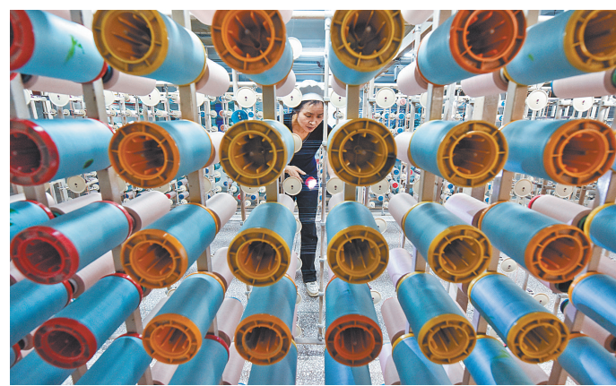
Производственная линия текстильной фабрики в Фуяне, провинция Аньхой.