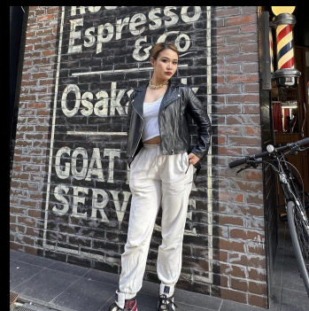
Misato 2k follower