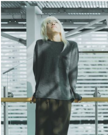
日本トップクラスのフォロワー Japanese