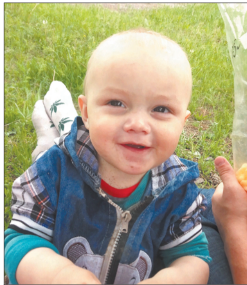
Это малыш до избиения — без травм, веселый.