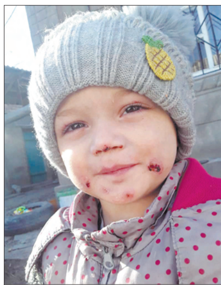
А это уже избитый, с черепной трещиной.