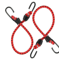
Opcional: cinta adhesiva o cuerdas elásticas