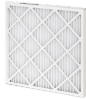
Filtro de horno de 20 "x 20" (MERV 13 o FPR 10)