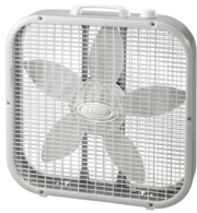
Ventilador de caja