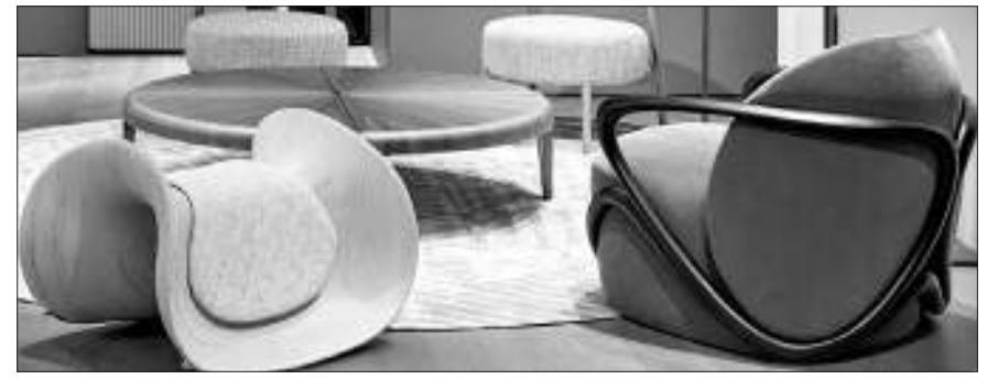
이탈리아 최고급 가구 브랜드 조르제티 무역센터점에 전시된 ‘히고’와 ‘크롬’ 의자. 현대리바트 제공

伊 조르제티 플래그십 매장 열고 소파·웃장 등 품목도 두 배 확대 프리미엄 제품으로 B2C 강화