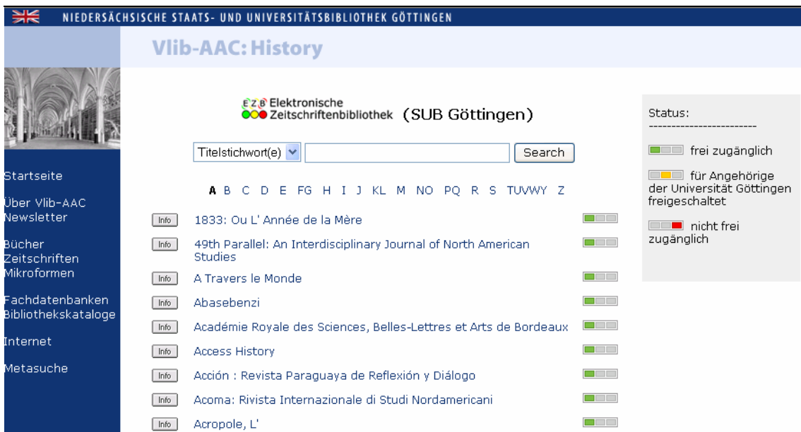
Abbildung 3: Die Elektronische Zeitschriftenbibliothek im Layout der Virtuellen Fachbibliothek Anglo-Amerikanischer Kulturraum (ViFa AAC: History)