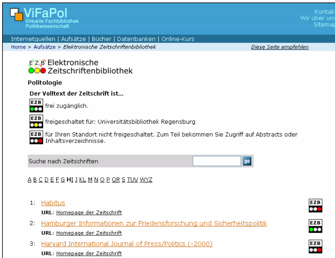
Abbildung 4: Die Elektronische Zeitschriftenbibliothek im Layout der Virtuellen Fachbibliothek Politikwissenschaft (ViFaPol)

Daneben wurde ein Prototyp erstellt, der in der EZB ein fachliches Browsing nach der in der Virtuellen Fachbibliothek Politikwissenschaft verwendeten Fachnotation ermöglicht.