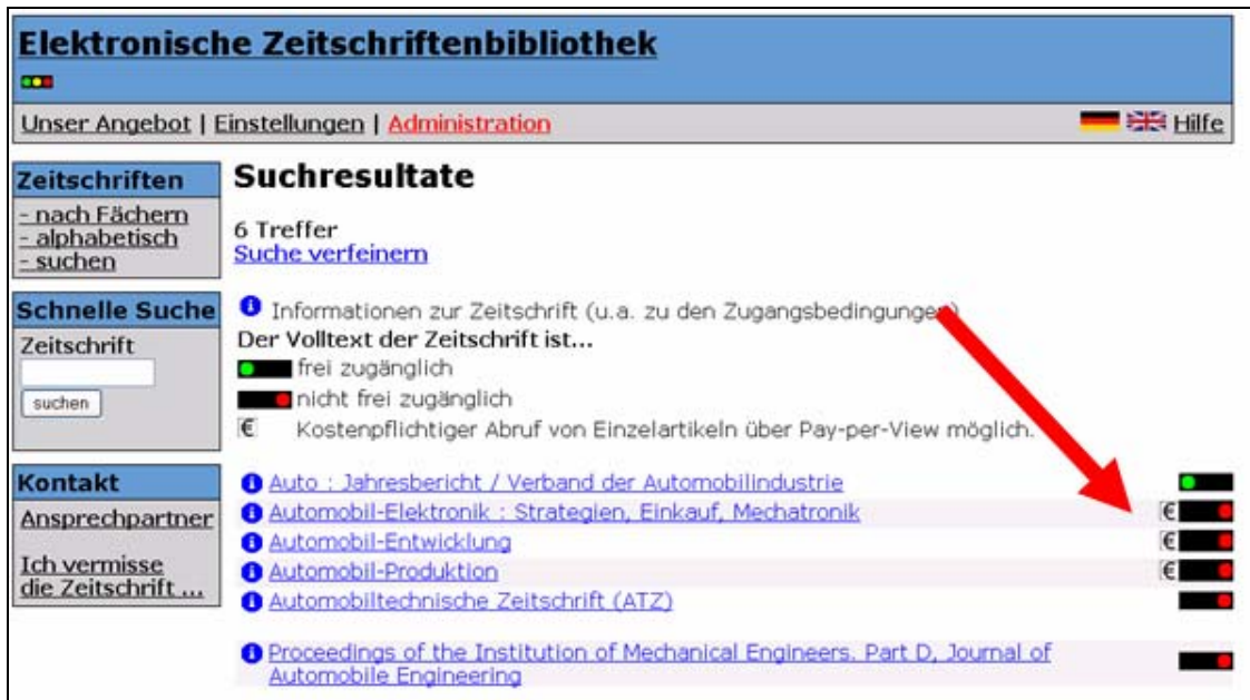
Abbildung 2: Darstellung von Pay-per-View-Angeboten in der EZB-Titelübersicht

Neben der Open-URL-Schnittstelle und der Artikelverlinkung wurden im Rahmen des Projektes eine Eingabe- und Darstellungsmöglichkeit von Pay-per-View-Optionen in der EZB entwickelt. Zeitschriften, deren Volltexte im Pay-per-View abgerufen werden können, werden in der Titelliste der EZB mit einem Eurozeichen markiert, welches darüber informiert, dass für diese Zeitschrift ein Pay-per-View-Angebot existiert.