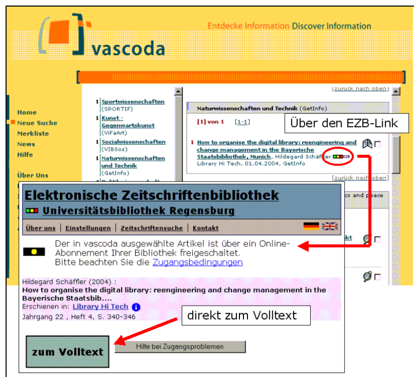
Abbildung 1: Verlinkung der EZB in vascoda mit direkter Artikelverlinkung

Im vom Bundesministerium für Bildung und Forschung (BMBF) finanzierten Projekt „ Integration der EZB in die Informationsverbünde “ konnte die Verknüpfung zwischen dem interdisziplinären Internetportal für wissenschaftliche Information in Deutschland „vascoda“ (www.vascoda.de) und der EZB weiter verbessert werden. Entwickelt wurde hierfür eine Open-URL-Schnittstelle zur EZB. Mittels dieser Schnittstelle ist es möglich von Datenbanken, die Open-URL unterstützen, zur EZB zu verlinken. Als Projektziel wurde des Weiteren für die Open-URL-Schnittstelle ein Deep-Linking realisiert. Dies bedeutet, dass bei der EZB in möglichst vielen Fällen ein direkter Link zum gesuchten Aufsatz angeboten wird. Diese direkte Artikelverlinkung war bis Ende 2004 für 8.029 E-Journale von 41 Verlagen bzw. Anbietern realisiert. Zusätzlich bietet die EZB eine Artikelverlinkung für etwa 12.000 Volltextzeitschriften in Aggregator-Datenbanken an. Dies entspricht etwa 40% der im Oktober 2004 ohne die Volltextzeitschriften aus Aggregatoren in der EZB verzeichneten 20.000 Titel und mehr als 60% der dort enthaltenen lizenzpflichtigen E-Journale. Bei 266 Zeitschriften von 4 Verlagen verweist die EZB zum Inhaltsverzeichnis des Heftes. Es ist vorgesehen, im Jahr 2005 die Artikelverlinkung weiter auszubauen.