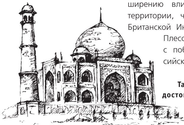
Тадж-Махал — одна из достопримечательностей Индии

Роберт Клайв (англ. Robert Clive , 1725–1774) — британский генерал и чиновник, утвердивший господство Британской Ост-Индской компании в Южной Индии и в Бенгалии. Он способствовал расширению влияния Британии на эти территории, что привело к созданию Британской Индии. После победы при Плесси получил титул барона с победным эпитетом «Плессийский».