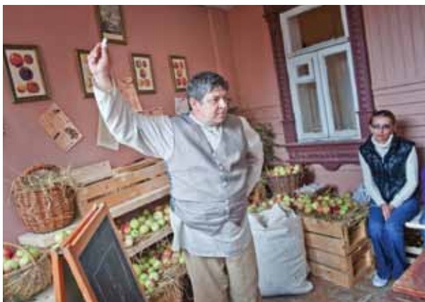
Лекция музейного садовника

ческую реконструкцию и живое мемориальное пространство, открытое производство по старинным технологиям и театрализованную экскурсию, интерактивные формы участия и дегустацию, аудиовизуальную программу и мультимедиа, музейное садоводство и популяризацию старинных садоводческих традиций. Благодаря такому подходу в ходе реализации проекта удалось воссоздать жизненный мир кондитерского заведения провинциального русского города, шагнувшего в индустриальный век вместе с багажом патриархальных традиций. Только такой мир способен перенести современного человека на целое столетие назад и дать возможность увидеть, услышать и почувствовать незаслуженно забытый пласт нашего наследия — старинное конфектно-кондитерское производство и технологии приготовления коломенской пастилы, выросшие из вековых традиций яблочно-садоводства.