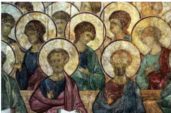
Фрески Андрея Рублева XV в. в Успенском соборе

премии Президента РФ в области образования за творческую работу по созданию здесь Детского музейного центра.