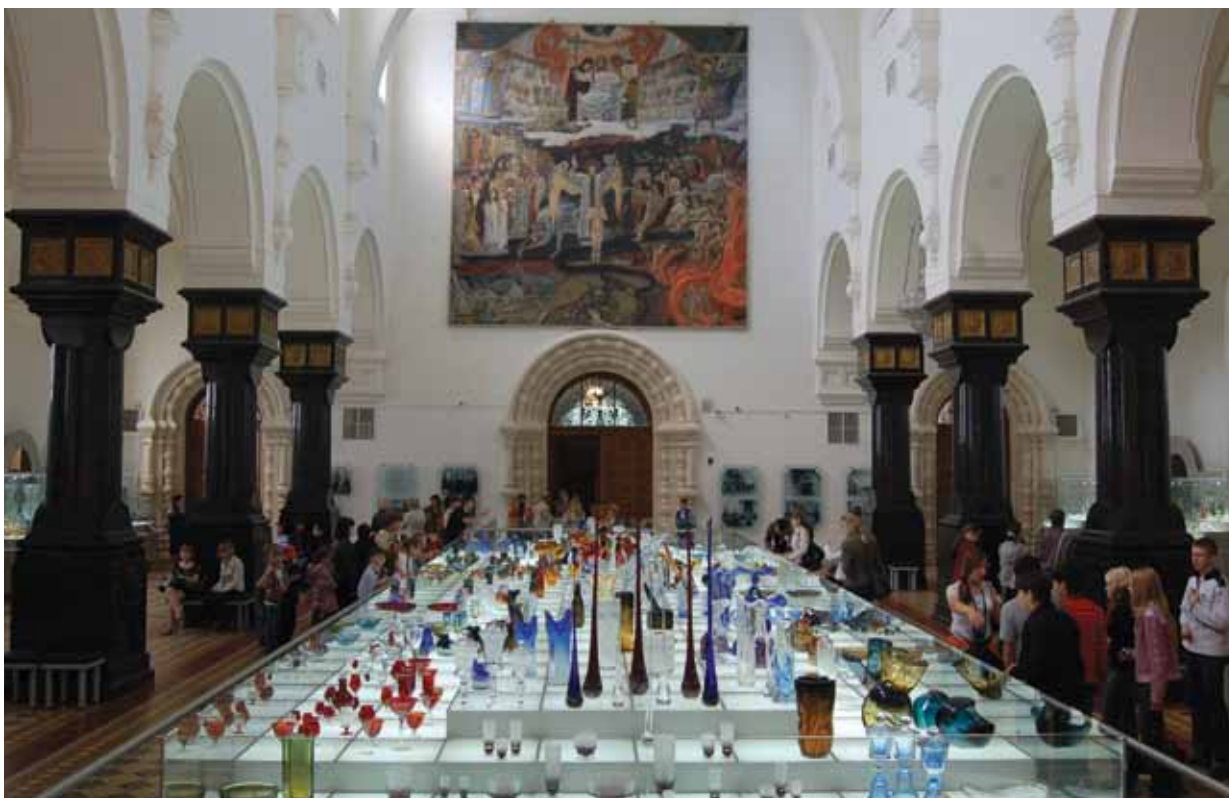
Музей хрустала им. Мальцовых в Гусь-Хрустальном

В старинном центре отечественного стеклоделия — городе Гусь-Хрустальном — открыт Музей Хрустала им. Мальцовых, по праву считающийся лучшим в России, демонстрирующий одну из богатейших коллекций художественного стекла. Он размещён в великолепном Георгиевском соборе начала XX в., созданном по проекту архитектора Л.Н. Бенуа и украшенном монументальным живописным полотном В.М. Васнецова «Страшный суд» и величественной мозаикой «О тебе радуется, Благодатная».