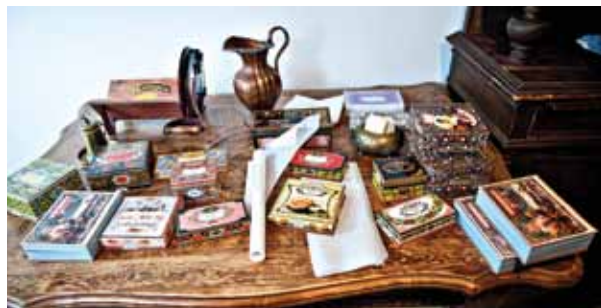
Упаковка - дело серьезное

Впитав опыт лучших музейных практик, Музейная фабрика стала настоящим «комбинатом» новейших музейных технологий, объединившим истори-