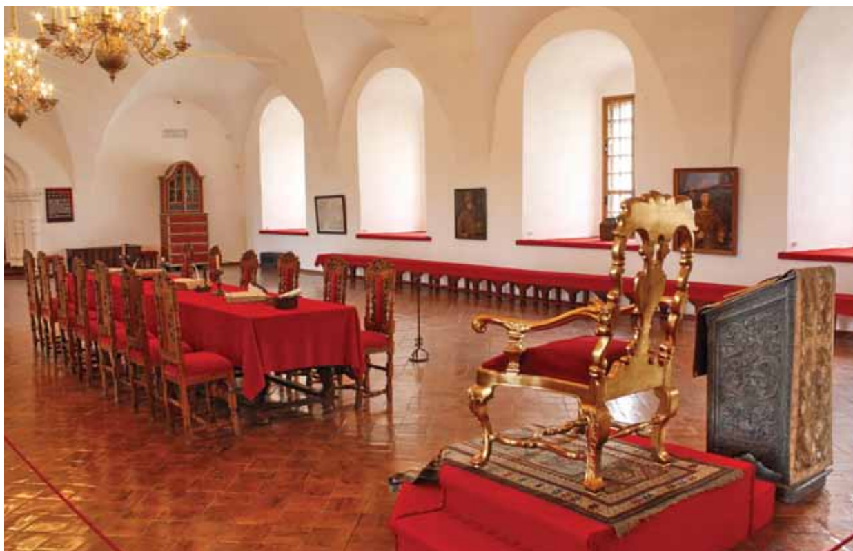
Крестовая палата суздальского кремля

Гостей Владимирской земли поражает аристократическое совершенство главного храма Древней Руси — Успенского собора, где сохранилась монументальная живопись Андрея Рублёва и Даниила Чёрного. Символом и славой Владимира являются Золотые ворота — памятник военно-оборонительного зодчества, где открыта военно-историческая экспозиция с диорамой «Решающий штурм Владимира войском хана Батыя 7 февраля 1238 г.». Особой гордостью музея-заповедника является культурно-образовательный центр «Палаты» в здании бывших Присутственных мест XVIII в. во Владимире. В 2000 г. авторский коллектив был удостоен