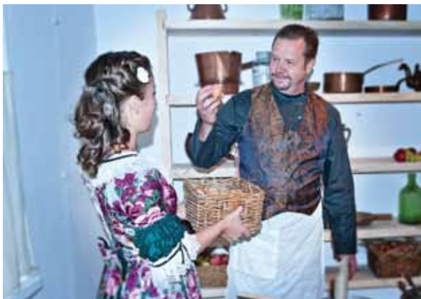
Кондитер доволен. Из свежих яиц пастила выйдет белопенная

ческую реконструкцию и живое мемориальное пространство, открытое производство по старинным технологиям и театрализованную экскурсию, интерактивные формы участия и дегустацию, аудиовизуальную программу и мультимедиа, музейное садоводство и популяризацию старинных садоводческих традиций. Благодаря такому подходу в ходе реализации проекта удалось воссоздать жизненный мир кондитерского заведения провинциального русского города, шагнувшего в индустриальный век вместе с багажом патриархальных традиций. Только такой мир способен перенести современного человека на целое столетие назад и дать возможность увидеть, услышать и почувствовать незаслуженно забытый пласт нашего наследия — старинное конфектно-кондитерское производство и технологии приготовления коломенской пастилы, выросшие из вековых традиций яблочно-садоводства.