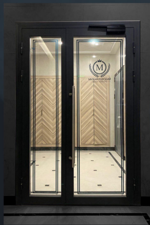
Новосибирск ЖК Михайловский