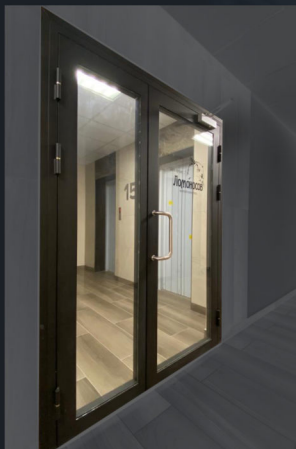
Новосибирск ЖК Ломоносов