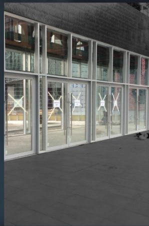
Самара ТЦ Гудок