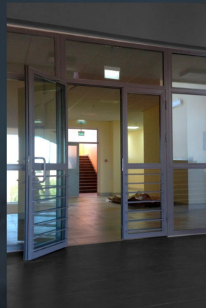
Самара Школа №7 Крутые Ключи