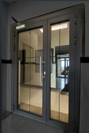
Новосибирск ЖК Классик