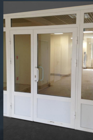
Самара Областной перинатальный центр