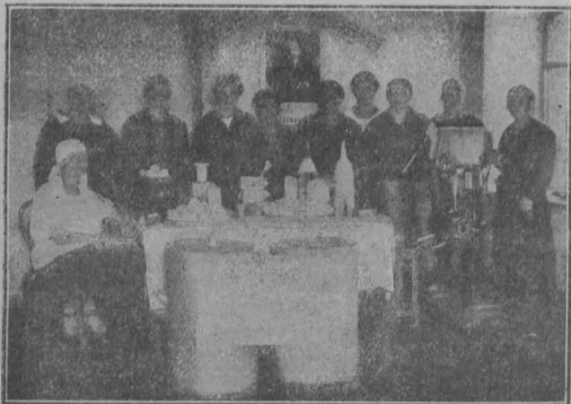
Молочно-кооперативная артель имени «Крупской» г. Саранск. Пензенской губернии.

При всех городских делегатских собраниях УЖО имелись кооперативные секции, которые работали по программе Центросоюза, под руководством кооперативных и партийных работников. Всех кооперативных секций было 11, с количеством делегаток в них—129. Но постановка работы секций не удовлетворительна, потому что не имеется хороших, подготовленных руководителей на местах, не имеется новой кооперативной литературы, занятия