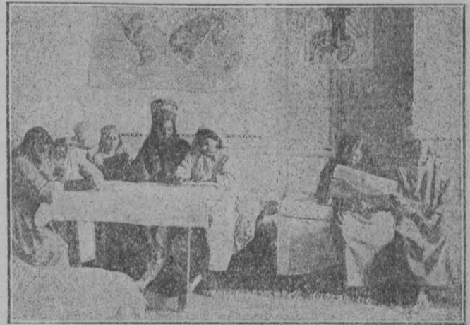
В общежитии курсов волостных организаторов по работе среди декханок.

Первые курсы волорганов влили еще маленький отряд в армию женотдельских работников по Туркестану.