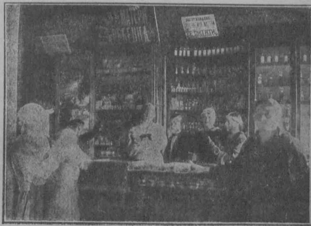
Уголок „Матери и ребенка“ при Саранском горепе Саранского уезда, Пензенской губернии.

В настоящий момент проводится качественный учет и намечается плановое распределение инструкторов по вовлечению работниц и крестьянок в кооперацию, с целью подравнивания работы и укомплектования крупных текстильных районов. Число работниц и крестьянок в органах управления и контроля к лету 24-го года равняется 4.004, на всякого рода курсах учтено 979 работниц и крестьянок. Необходимо тут же отметить, что на местах не вели качественного учета этим кусанткам, и поэтому не могли пользоваться их для регулярного пополнения кадра, и давая цифру в отчетах,