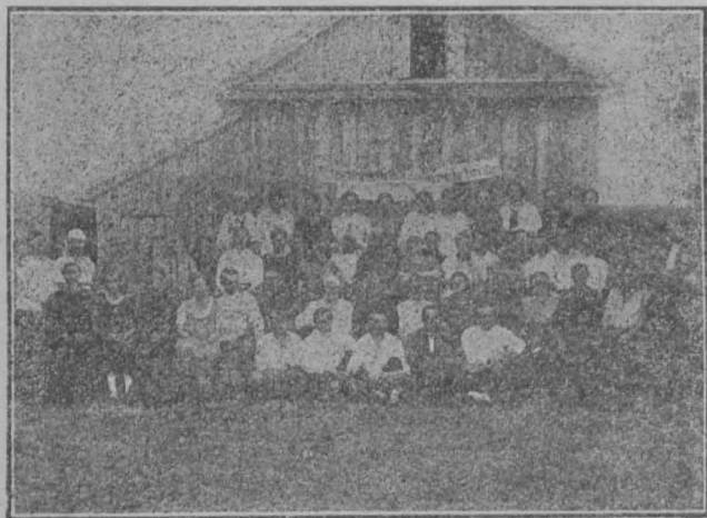
1-ая конференция крестьянок в обл. немцев Поволжья.

В декабре 1920 г. была проведена первая Об-