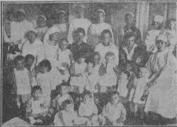
Группа детей 2-х и 3-летнего возраста со служащими дневных ясель в г. Петрозаводске имени „Самойловой“, открытых силами работниц 2 июня 1923 г.

Политвоспитательная работа среди делегатов еще не поставлена на должную высоту. Через школы политграмоты в 1924 г. из количества 1600 делегатов, прошло только около 50%, включая сюда и волостных делегатов. Ленинский кружок существовал в самом Петрозаводске и Кем-