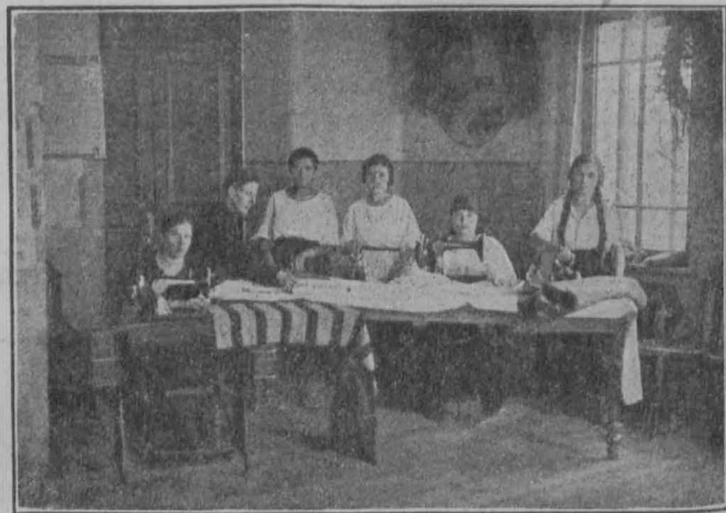
Кружок кройки и шитья при рабочем клубе ф-ки „Красный Октябрь“ в Н.-Новгороде.

Работа среди жен рабочих обновит домашний уклад семьи, отразится на воспитании нашего нового поколения, значительно расширит круг интересов рабочей семьи и наполнит ее новым содер-