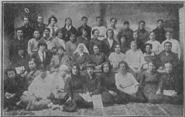
Первые курсы волорганизаторов в Татреспублике.

Съехалось всего 40 человек, из них 18 татарок, 14 русских, 3 чувашки и 5 кряшенок.