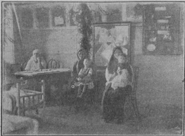
„Уголок матери“ при рабочем клубе ф-ки „Красный Октябрь“ в Н. Новгороде.

Были намечены четыре центра, вокруг которых организуются жены рабочих: рабочий или союз-