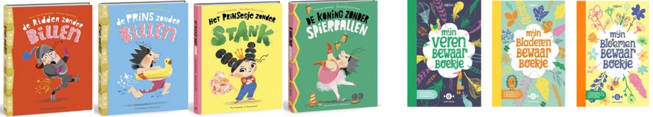
15 th print Normal size, XL version, cardboard version. Translations: China, France, Spain. italie, Australia.