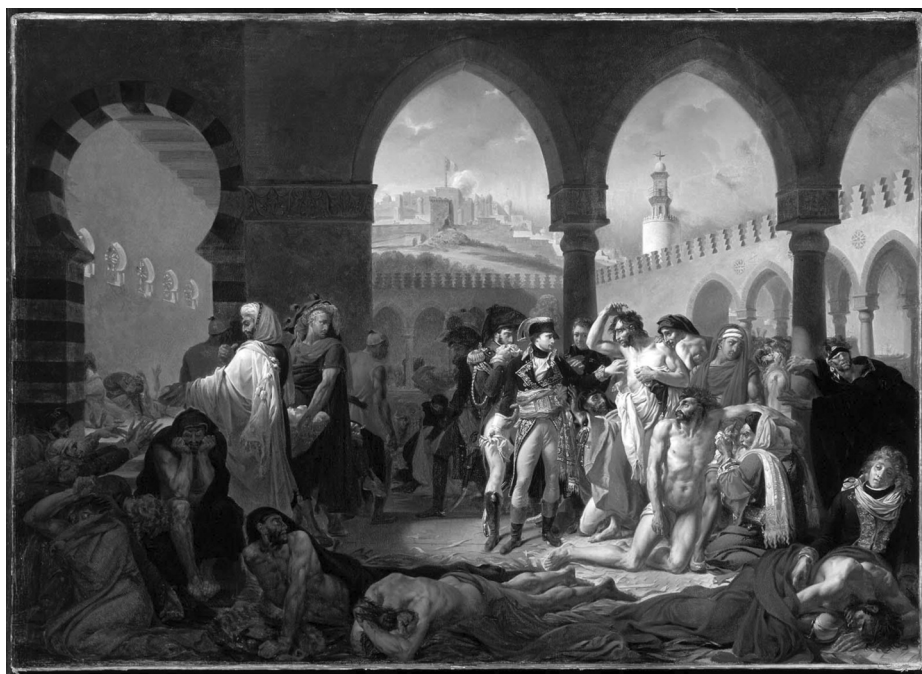
Ил. 1. Антуан Жан-Гро. «Наполеон посещает чумной госпиталь в Яффе» (1804). Из коллекции Лувра 5 .

Значительная часть живописных отражений героической биографии Наполеона принадлежит художнику Антуану-Жану Гро (1771—1835), известному как «живописец Наполеона» [Munhall 1960; O'Brien 1995; 2006: 157]. Из всех картин Гро наибольшей известностью пользовалось полотно «Наполеон посещает чумной госпиталь в Яффе» (1804) (ил. 1). Специальным жюри картина Гро была признана в 1810 году самым значительным после «Коронации Наполеона» Давида произведением в жанре исторической живописи за десять предшествующих лет [Grimaldo 1995: 4]. Выставленная в год коронации Наполеона на Парижском салоне 1804 года, она привлекла к себе внимание публики прежде всего тем, что предлагала неожиданную и во многом противоречивую в глазах современников интерпретацию этого драматического эпизода — посещения Наполеоном в качестве командующего Французской армией в Египте госпиталя в Яффе 24 марта 1799 года. Именно благодаря картине Гро в биографии Наполеона в качестве ключевого утвердился сюжет о том, как спокойно и отстраненно, почти безучастно, Наполеон касается рукой без перчатки чумного бубона на обнаженном теле французского солдата. Фоном этого жеста на картине стали испуганные чумой спутники Наполеона, как, напри-