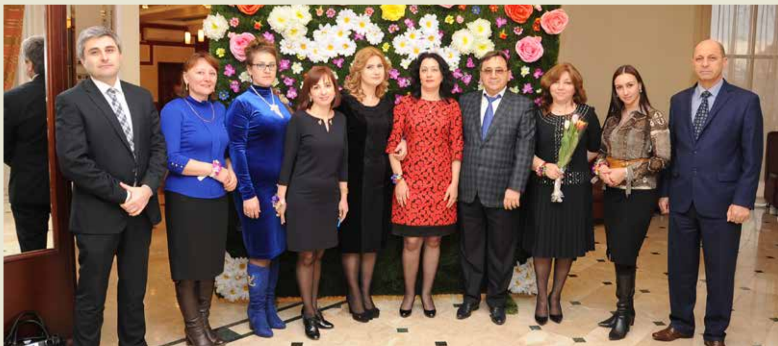
Руководство в прекрасном и приятном обществе

В этот весенний вечер каждый пришедший на праздник унес массу приятных воспоминаний и хорошего настроения. Коллектив Общества продемонстрировал – отдыхать, как и работать, он умеет. Такие мероприятия надолго запоминаются приятными впечатлениями и эмоциями, и способствуют развитию общих интересов и дружеских отношений, которые, в свою очередь, являются залогом успешной работы и новых достижений в совместном труде.