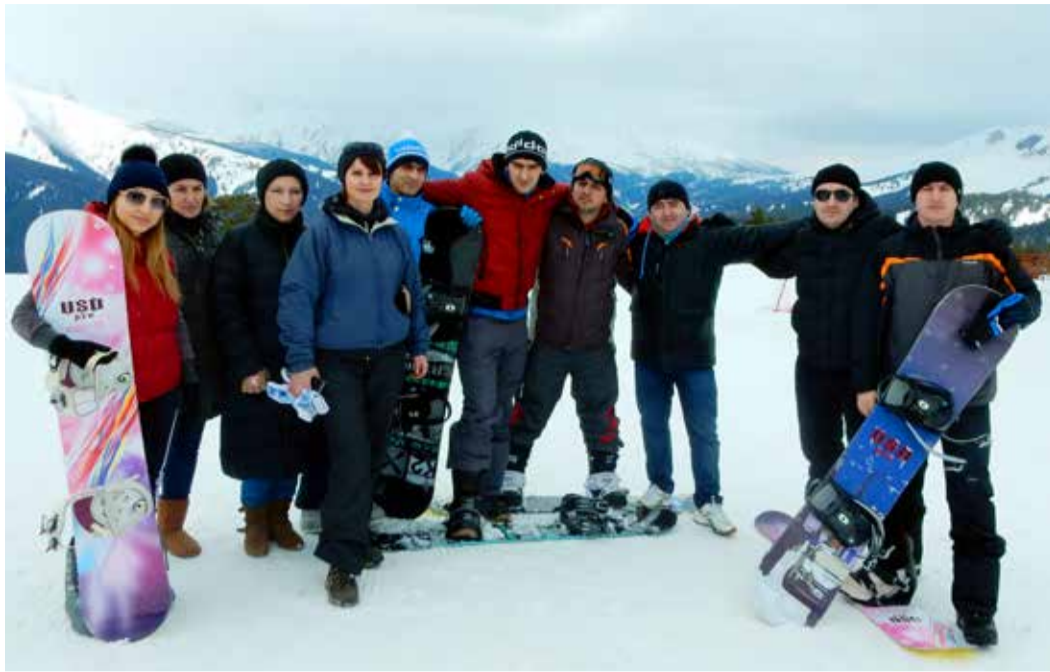
К скоростному спуску готовы

На нашем предприятии большой популярностью пользуются коллективные экскурсии в живописные уголки и исторические места Дагестана и соседних республик и краев. Одно из важнейших их преимуществ – то, что эти выезды, как правило, привязываются к «длинным выходным» и не требуют отрыва от рабочего процесса. К тому же представляется возможность еще раз убедиться в многоликости и поистине удивительной красоте нашего горного региона, а также познакомиться с культурой, обычаями и традициями братских народов Кавказа.