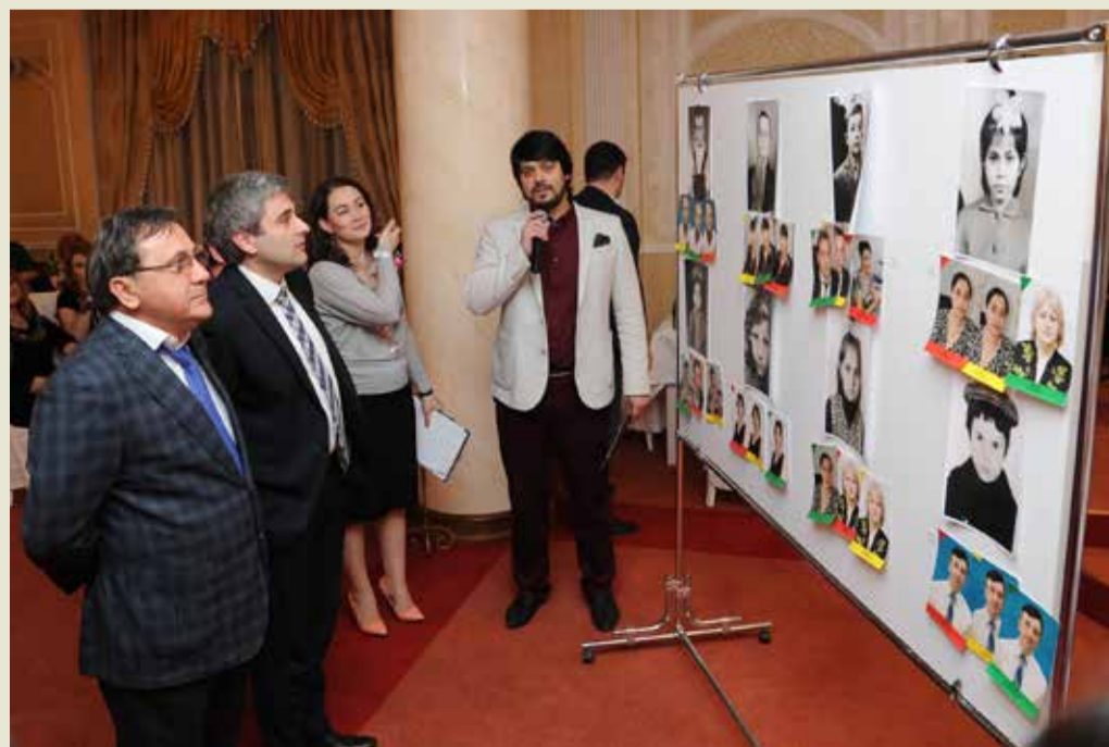
Состязания, викторины, конкурсы, организованные в рамках корпоративного торжества – интересны всем без исключения