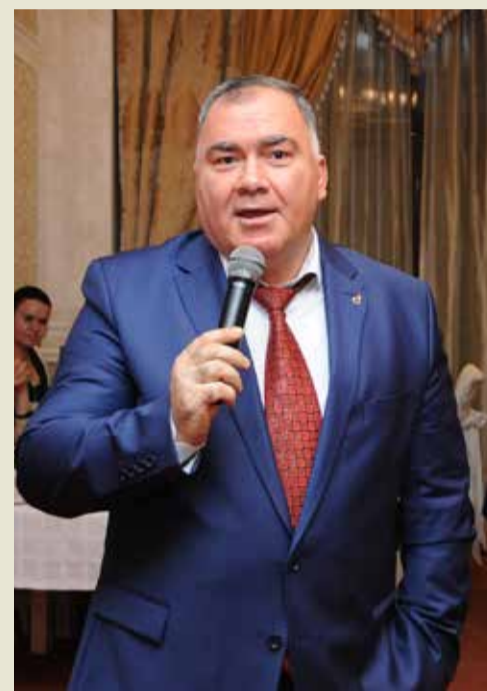
Поздравление главного «персональщика» Общества