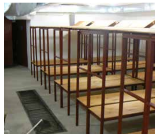
Помещение для укрываемых