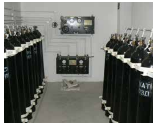
Помещение для хранения баллонов со сжатым воздухом

Самир АСКЕРАЛИЕВ инженер 1 категории Специального отдела