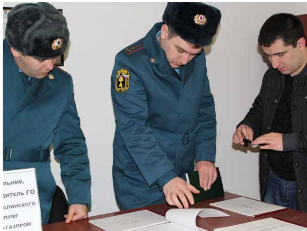
Ознакомление с документацией защитного сооружения