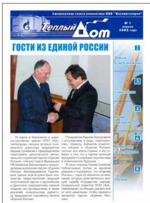
Первый номер газеты «Теплый дом»

Корпоративная ежемесячная газета «Теплый дом» – печатный орган трудового коллектива ООО «Газпром трансгаз Махачкала». Название газеты отражает значение для дагестанцев предприятия, которое обеспечивает их дома теплом и уютом. Если быть точным, газета начала выходить еще в 1999 году, тогда вышло в свет несколько ее номеров формата А2. Но по разным причинам в то время газета не стала регулярной.