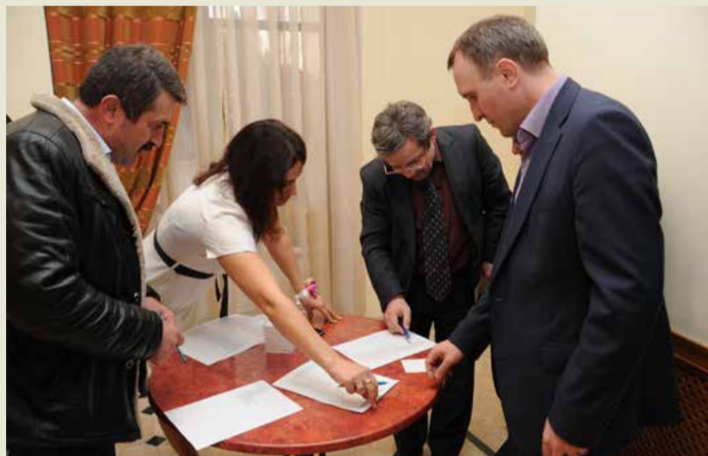
Мужчины перед трудным выбором: надо определить самую обаятельную и привлекательную...