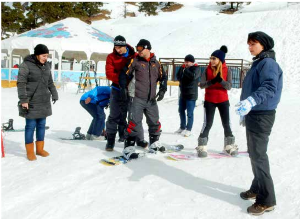
Правильно экипироваться – целая наука