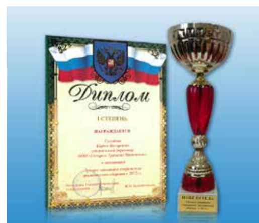
Диплом по итогам смотр-конкурса