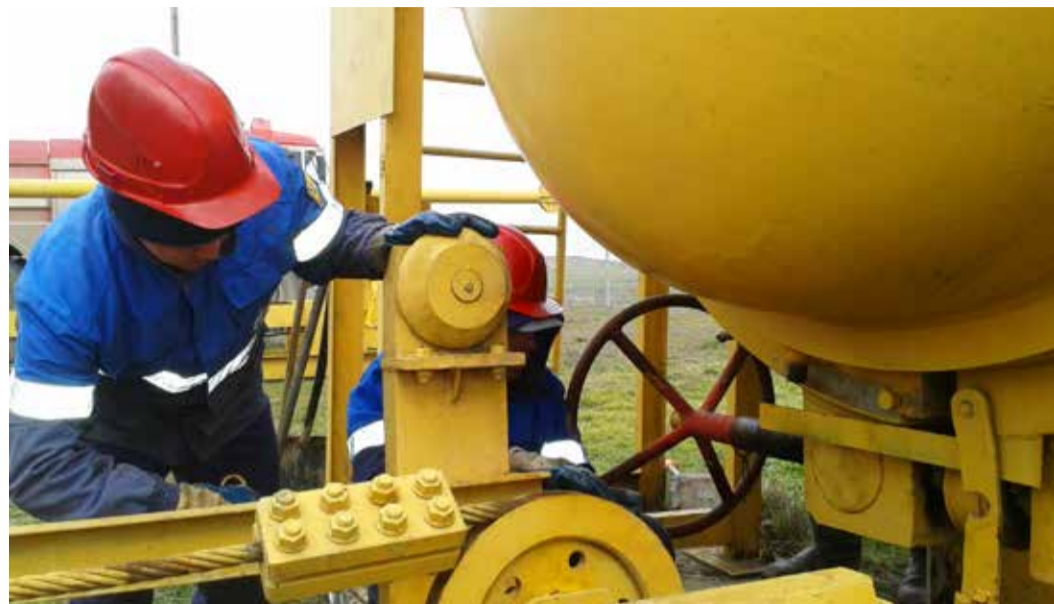
Подготовка к запуску дефектоскопа

В соответствии с пообъектным планом работ по диагностическому обследованию объектов ООО «Газпром трансгаз Махачкала» на 2015 год с 10 по 17 марта в Тарумовском ЛПУМГ на участке МГ «Мака́т – Северный Кавказ» проводятся работы по очистке и внутритрубной дефектоскопии.