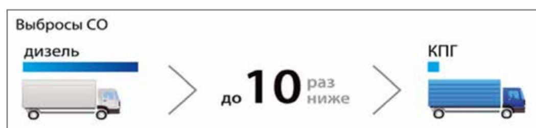
КПП – самый экологичный вид топлива

В разных странах органы государственной власти по-разному подходят к решению экологических проблем. Так, в России в целях стимулирования использования экологически чистых видов моторных топлив, в том числе газомоторного, Президент РФ В. Путин в мае 2013 года провел специальное совещание. В частности, он отметил необходимость более широкого использования техники, работающей на газомоторном топли-