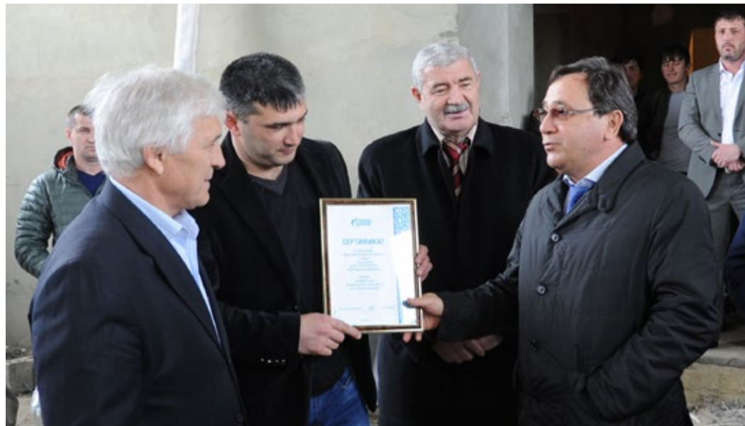
Вручение сертификата администрации Буйнакского района

ООО «Газпром трансгаз Махачкала» 20 апреля вручило администрации муниципального образования «село Нижнее Казанище» Буйнакского района Республики Дагестан сертификат на получение благотворительных средств для завершения строительства спортивного комплекса.