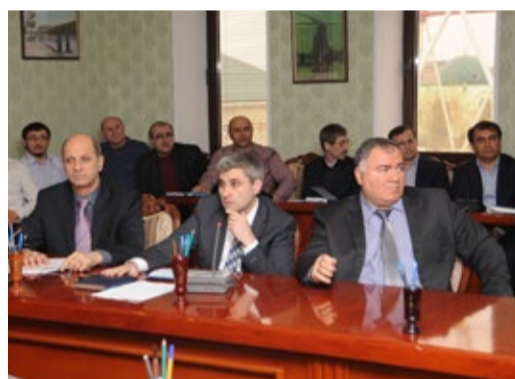
Заслушивание результатов производственно-хозяйственной деятельности

Бюджет затрат Дербентского ЛПУМГ за 2014 г. исполнен на 100%.