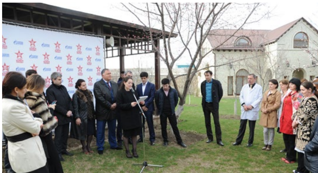
Торжественное открытие акции по посадке именных деревьев ветеранов Великой Отечественной войны