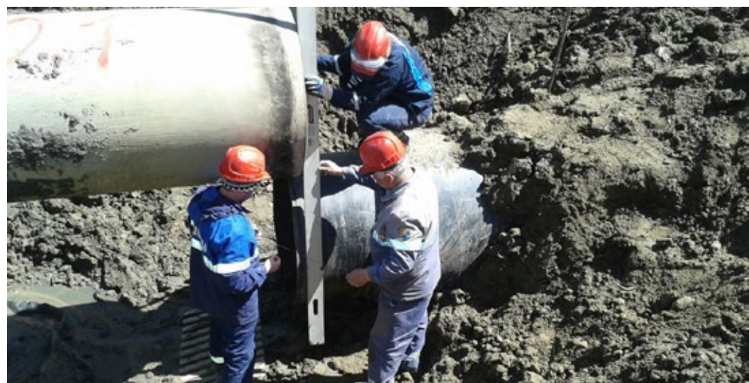
Идет процесс разметки для врезки «катушки»