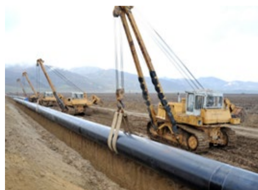
Реконструкция магистрального газопровода «Моздок – Казимагомед» на участке 610–623 км

Как один из самых крупных и добросовестных налогоплательщиков республики, ООО «Газпром трансгаз Махачкала» в уходящем году перечислило 823,3 млн рублей налогов и страховых взносов в бюджеты различных уровней, в том числе в федеральный бюджет — 359,3 млн рублей, в республиканский бюджет — 157,9 млн рублей и в местные бюджеты — 22,1 млн рублей; размер страховых взносов составил 284,0 млн рублей.