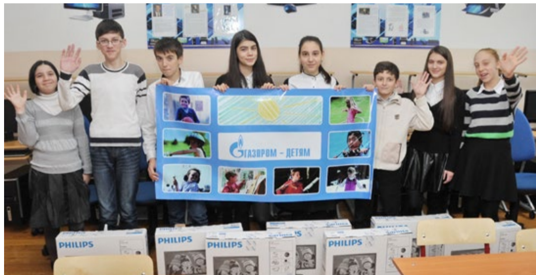
Интерактивный класс – поколению индиго

В преддверии Нового года дагестанские школьники стали обладателями новых современных компьютеров, приобретенных на средства, полученные ООО «Газпром трансгаз Махачкала» по программе «Газпром – детям».