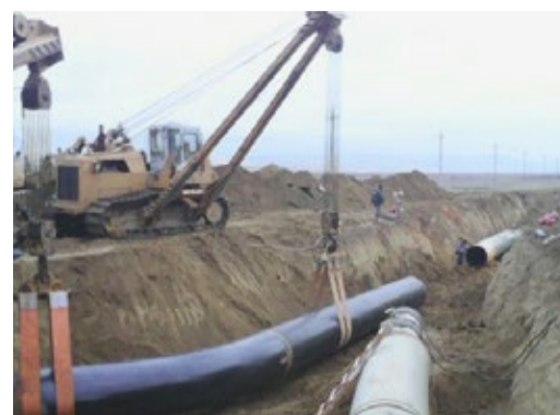
Подключение реконструированного участка к действующему магистральному газопроводу «Моздок – Казимагомед»

Мы ежегодно определяем значимые экологические приоритеты, являющиеся основой для постановки экологических целей, разработки и реализации программы природоохран-