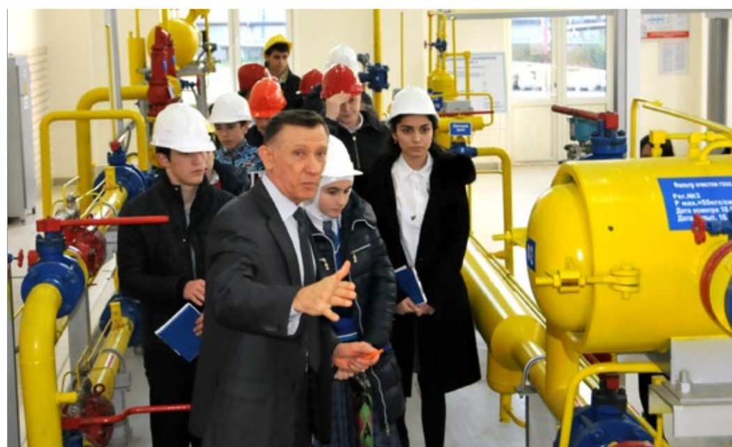
Рассказ об устройстве и работе ГРС