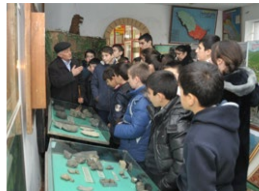
У стенда с артефактами