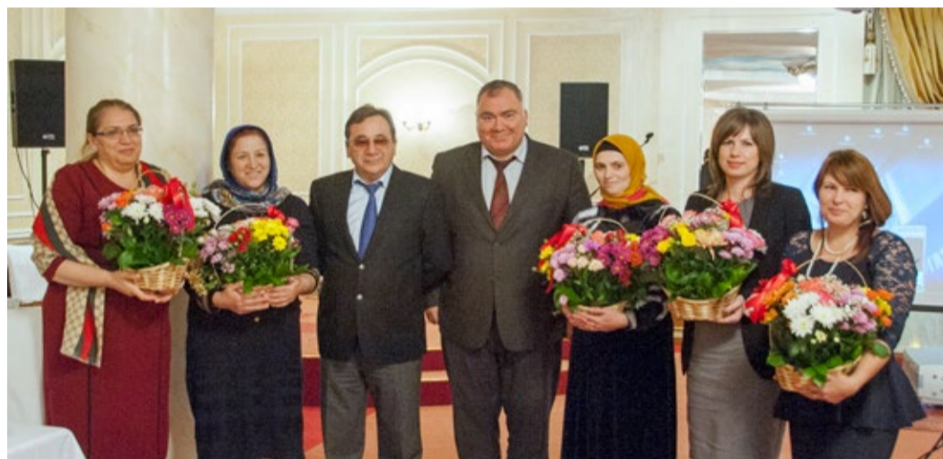
Женщины с цветами – украшение любого праздника