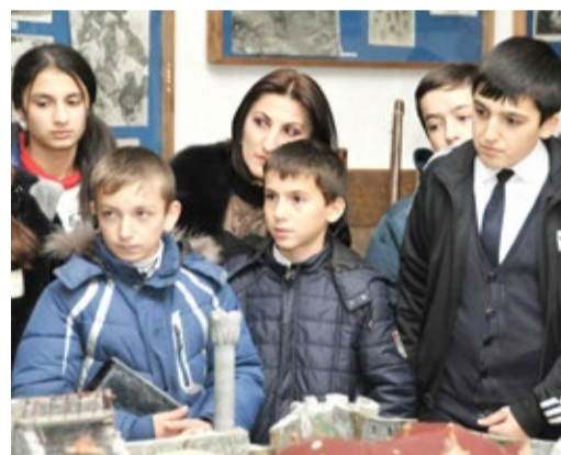
Интересно не только детям, но и взрослым