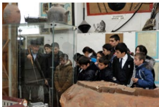
В краеведческом музее

6 декабря учащиеся ГКОУ «Общеобразовательная средняя школа-интернат № 6» г. Дербента посетили краеведческий музей в с. Ахты Ахтынского района.