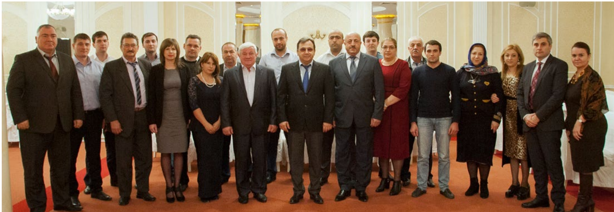
Участники встречи поколений – представителей трудовых династий с активом молодежи и руководством Общества

27 ноября в зале торжеств «Асиль» состоялась встреча представителей трудовых династий ООО «Газпром трансгаз Махачкала» с молодыми рабочими и специалистами предприятия. Встреча, организованная Службой по связям с общественностью и СМИ, прошла под девизом «Больше, чем коллеги, больше, чем семья!».