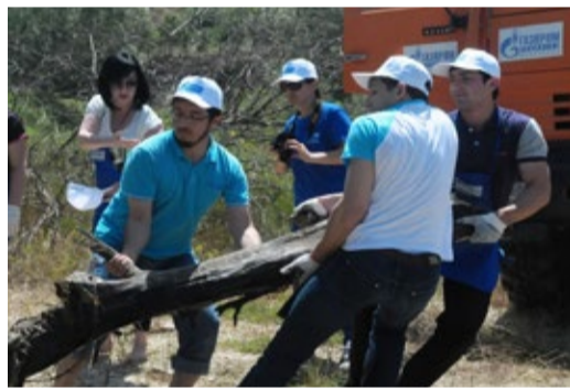
Очистка русла реки Манас-озень

В целях поддержания, развития и повышения уровня квалификации персонала в ООО «Газпром трансгаз Махачкала» функционирует Учебно-производственный центр (УПЦ) с учебным полигоном, учебно-сварочной мастерской, лабораторией по электротехнике и связи. В УПЦ, использующем в своей работе целый комплекс обучающих, тренажерных и консультационных систем, ежегодно проходят профессиональную подготовку, переподготовку, повышают квалификацию, овладевают вторыми (смежными) профессиями более 1000 работников предприятия.