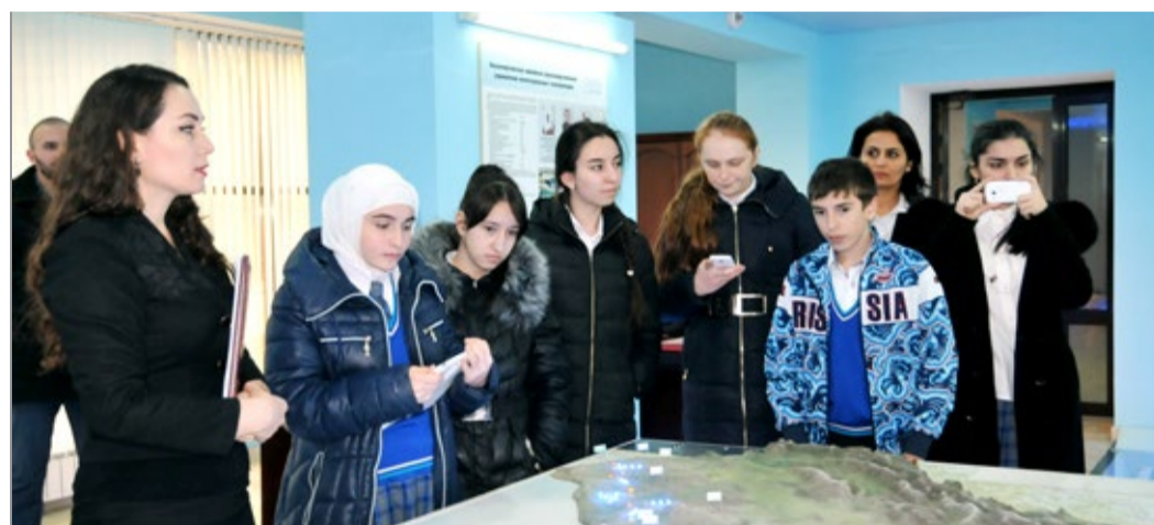
У музейного макета