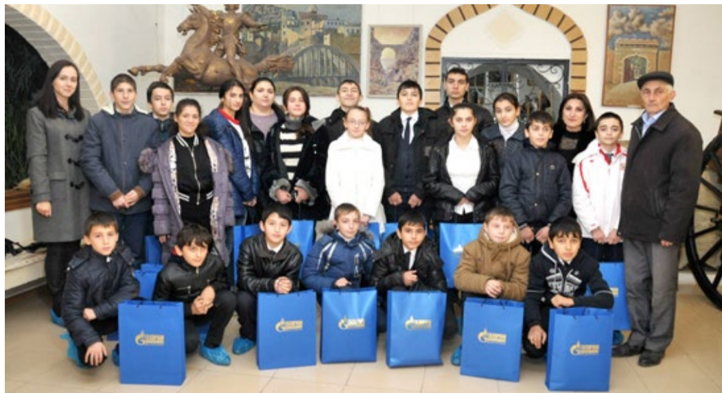
В дополнение к новым знаниям дети получили подарки от Общества

6 декабря учащиеся ГКОУ «Общеобразовательная средняя школа-интернат № 6» г. Дербента посетили краеведческий музей в с. Ахты Ахтынского района.