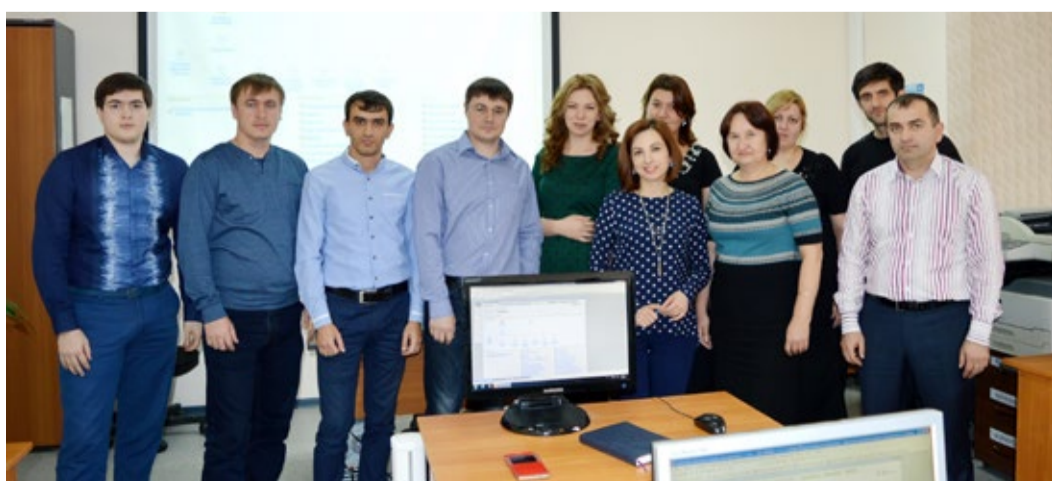
Экономисты и финансисты Общества – участники семинара

С 23 по 27 ноября экономисты и финансисты ООО «Газпром трансгаз Махачкала» прошли