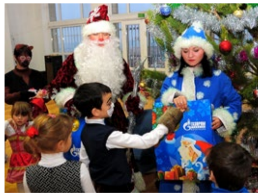
Подарки детям беженцев из Восточной Украины, проживающим в санатории «Леззет»

— ООО «Газпром трансгаз Махачкала» давно и активно позиционирует себя как социально ответственное предприятие. Мы предпочитаем оказывать адресную помощь детским, спортивным, культурным учреждениям, общественным организациям инвалидов и участников войн, артистам и спортсменам, лицам, оказавшимся в трудной жизненной ситуации. Такого рода благотворительную помощь в 2015 году мы оказали на общую сумму более 7 млн рублей.