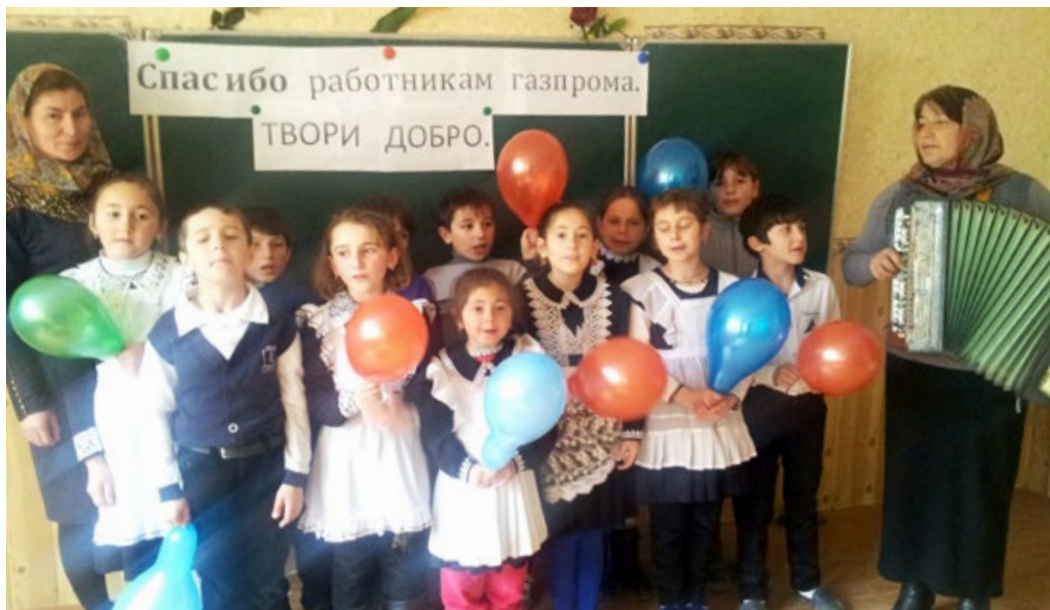
Веселая песня – в подарок газпромовцам