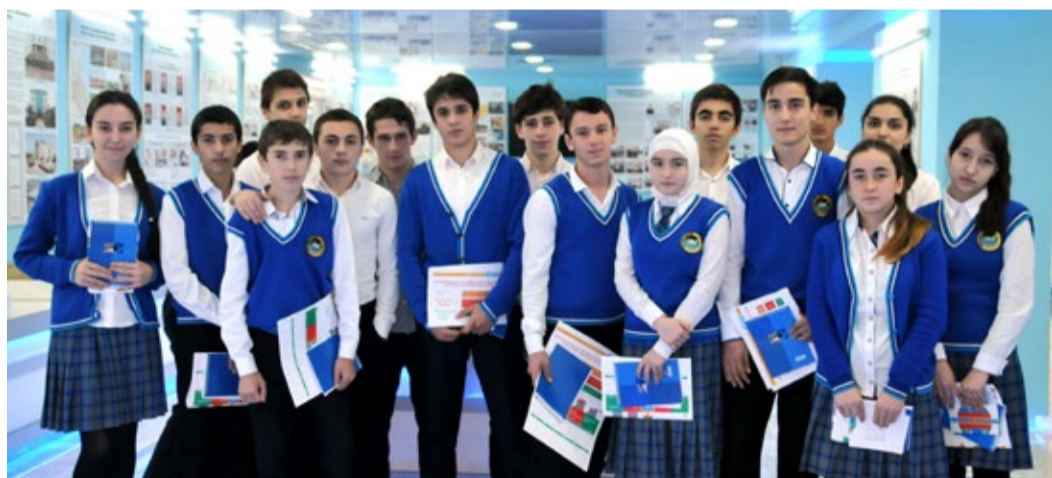
Школьники в Музее истории развития предприятия

10 декабря учащиеся Махачкалинской СОШ №2 посетили ООО «Газпром трансгаз Махачкала» с экскурсией в рамках просветительской акции «Осторожно, газопровод!».