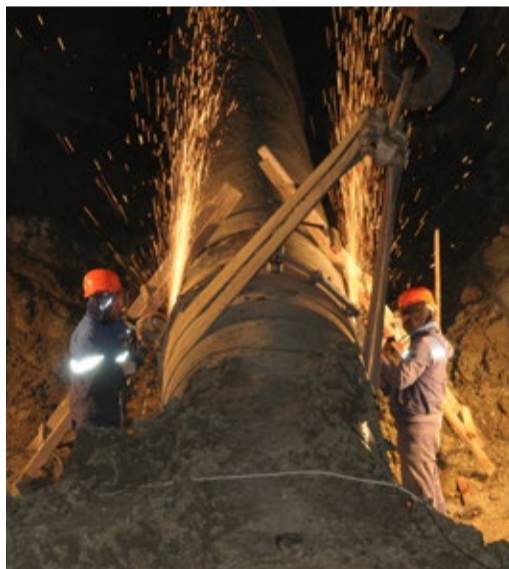
Огневые работы на магистральном газопроводе

— Дагестанцам известно, что в Обществе большое внимание уделяется вопросам экологии. Каковы практические результаты природоохранной деятельности Вашего предприятия?