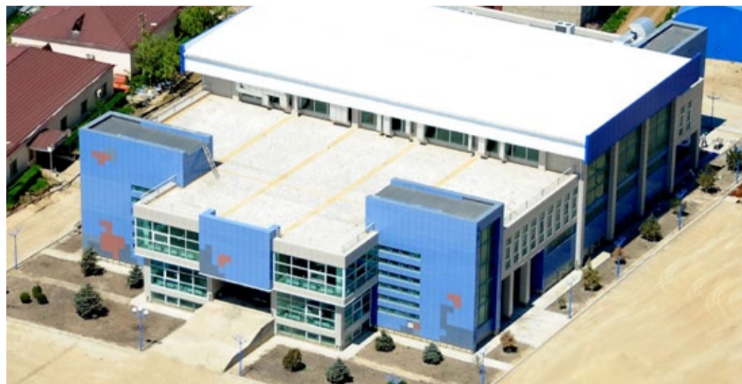
Детский многофункциональный спорткомплекс в г. Махачкале

Отдельно стоит отметить, что ООО «Газпром