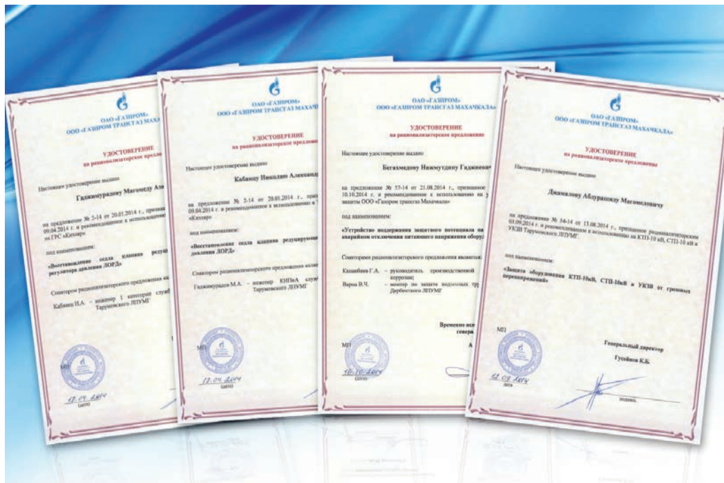
Свидетельства внедрений новейших разработок в производство