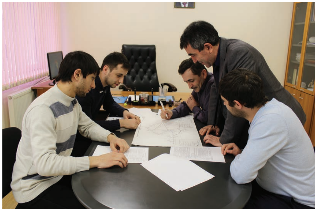
Рационализаторы за работой