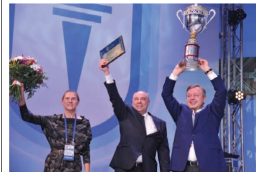
«Газпром трансгаз Сургут» – победитель спартакиады в общекомандном зачете среди взрослых