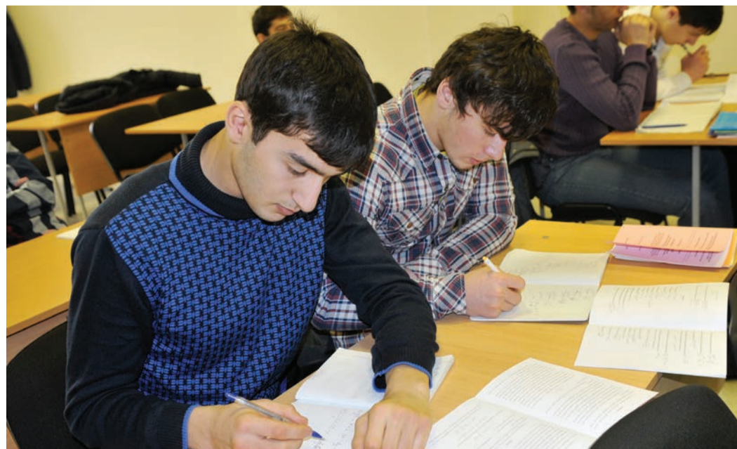
Тестирование кандидатов в студенты-целевики