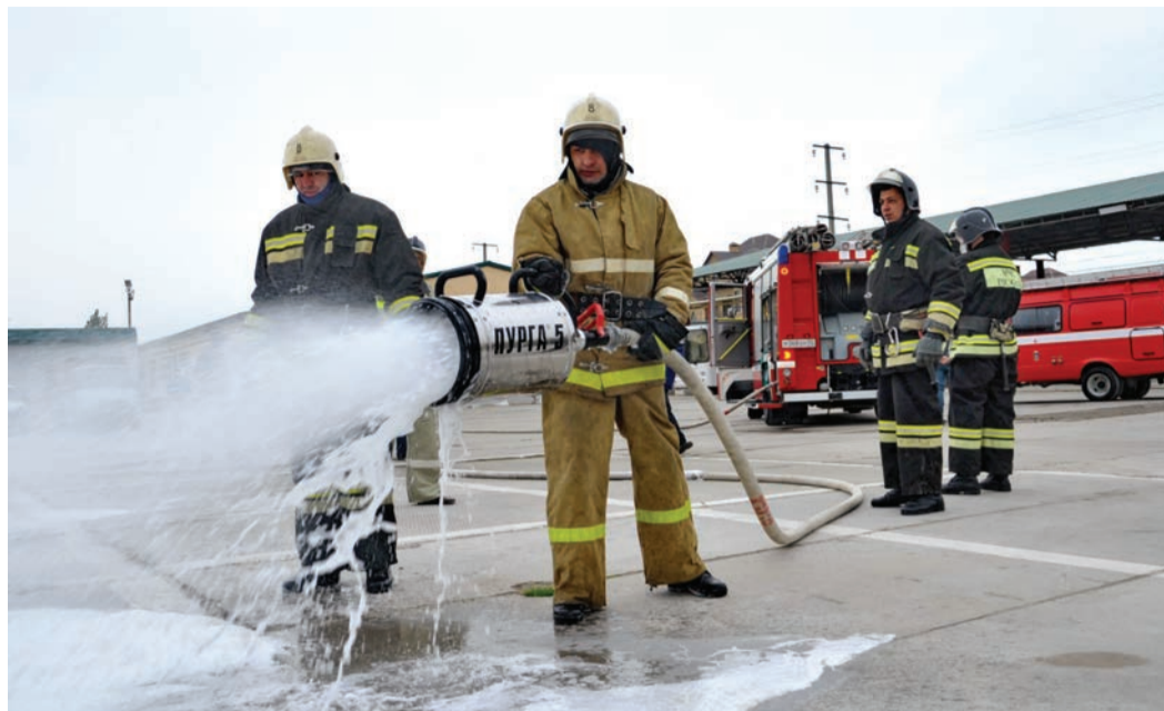
Учебное тушение пожара