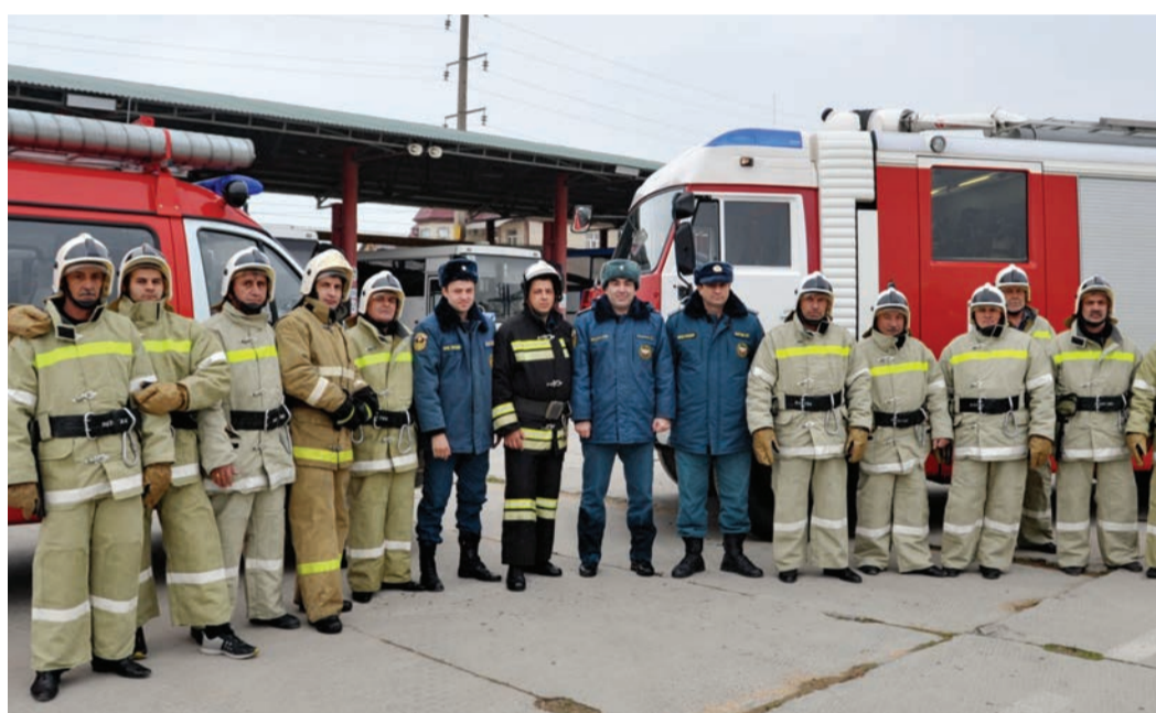
Добровольная пожарная дружина Общества