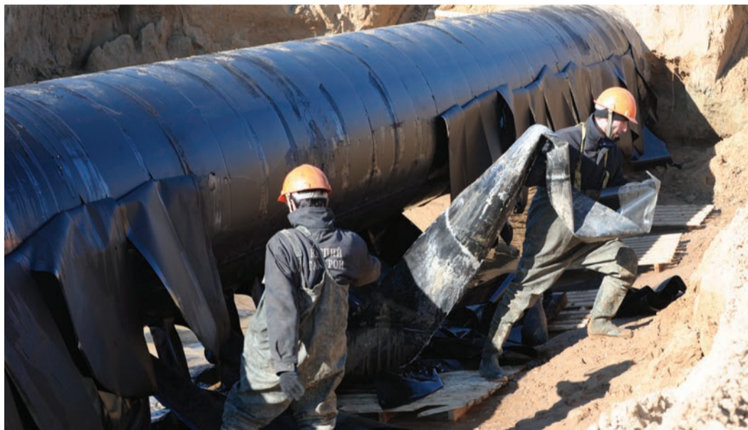
Снятие старого изоляционного покрытия ручным способом

В Тарумовском ЛПУМГ ведутся масштабные работы по капитальному ремонту изоляцион-