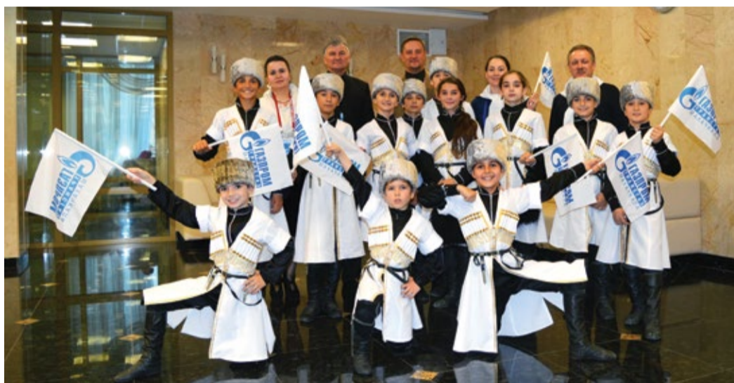
Делегация Общества на фестивале «Факел»