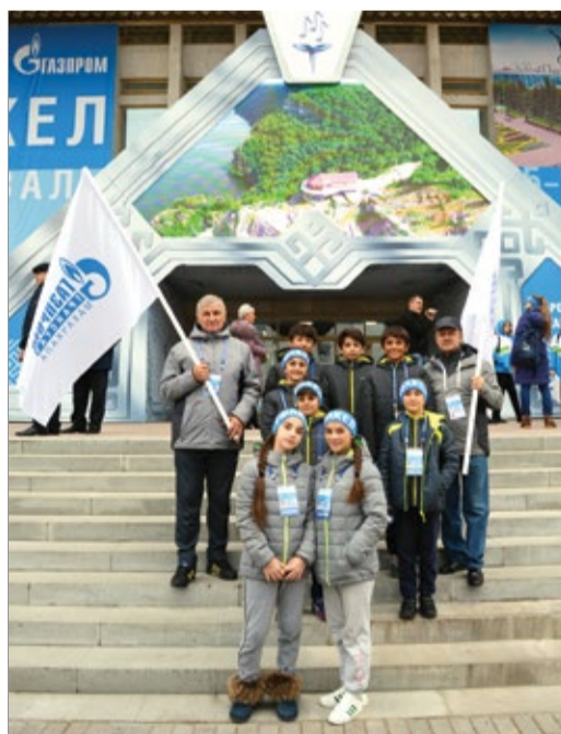
Дружная команда «Сари Кума»