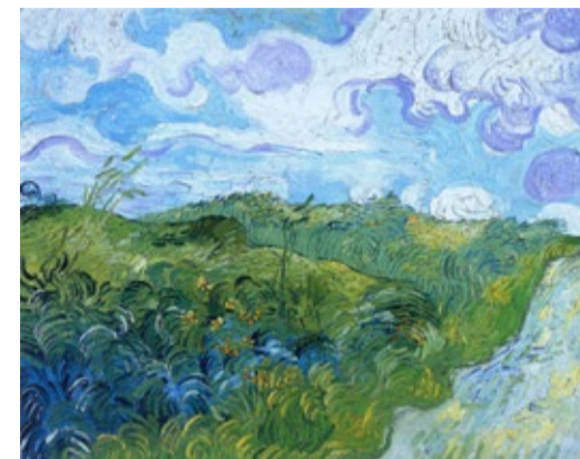
Ван Гог «Зеленые поля пшеницы»

Редакция «Теплого дома» предлагает вниманию читателей новый проект – современные производственные пейзажи глазами импрессиониста Винсента Виллема ван Гога. На фото – производственно-профилактические работы по замене участка магистрального трубопровода «Моздок – Казимагомед» в Избербашском ЛПУМГ.