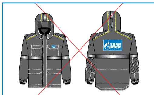
Не допускается размещать фирменный блок в виде нашивки. Фирменный блок размещается только на элементах одежды синего цвета

Появилась новая глава, регулирующая брендинг спецодежды. В ней, в частности, говорится, что логотип с наименованием дочернего общества теперь нельзя наносить на одежду как нашивку – специальные