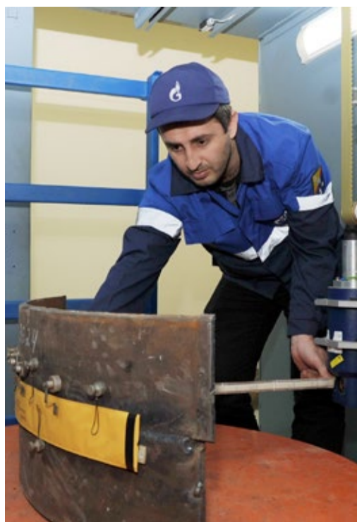
Выполнение практического задания