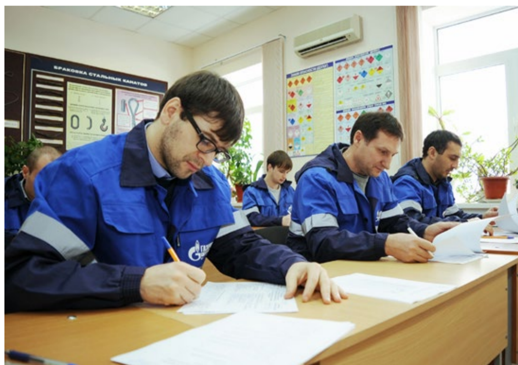
Участники конкурсов за выполнением теоретического задания

В середине февраля в ООО «Газпром трансгаз Махачкала» прошел конкурс профмастерства «Лучший специалист радиационного контроля – 2017». Подобные конкурсы проводятся в Обществе ежегодно в целях повышения престижа работы специалистов по радиационному контролю, выявления и распространения передовых методов и приемов труда, а также для совершенствования профессионального мастерства специалистов предприятия.