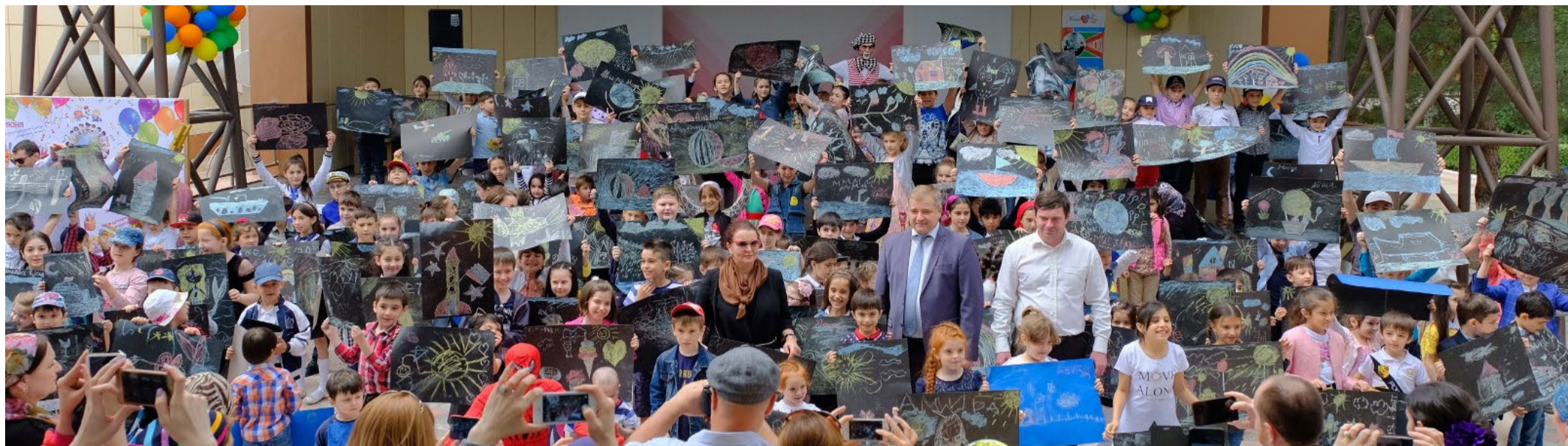
Памятное фото с руководством предприятия

Ежегодно в первый летний день принято отмечать Международный день защиты детей. Этот праздник является напоминанием обществу о необходимости защищать права ребенка, чтобы все дети росли счастливыми, учились, занимались любимым делом и в будущем стали замечательными родителями и гражданами своей страны.