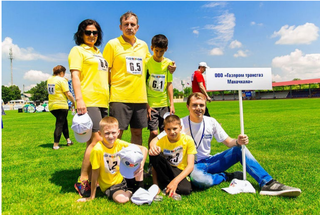
Команда ООО «Газпром трансгаз Махачкала» – призеры «Энергии поколений»

Город Ставрополь утопает в изумрудной зелени, поскольку он создавался на месте природных лесов. Прогулки по его бульварам и паркам забываемы... Пирамидальные тополя, краснолистные клены, акации – белая и шаровидная, ясень, розы, жасмин, высокие каштаны, вековые дубы... Город очень уютный и интересный, богатый своей историей и культурой. Мне кажется, прекрасные природные и рекреационные возможности, которые раскрываются перед всеми гостями Ставрополя, сказались и на характерах и темпераменте здешних жителей – ставропольчане гостеприимные и улыбочивые, открытые и искрен-