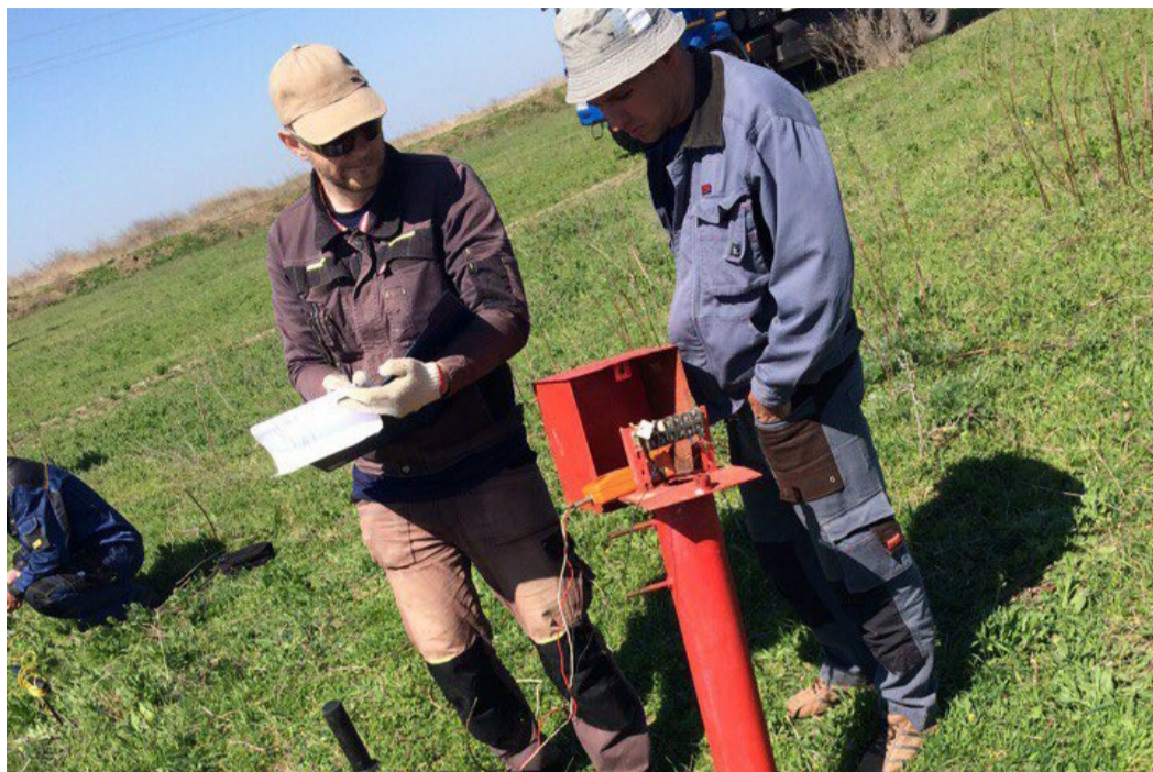
Измерение защитного потенциала газопровода

Данные, полученные при обследовании, обрабатываются специалистами подрядной