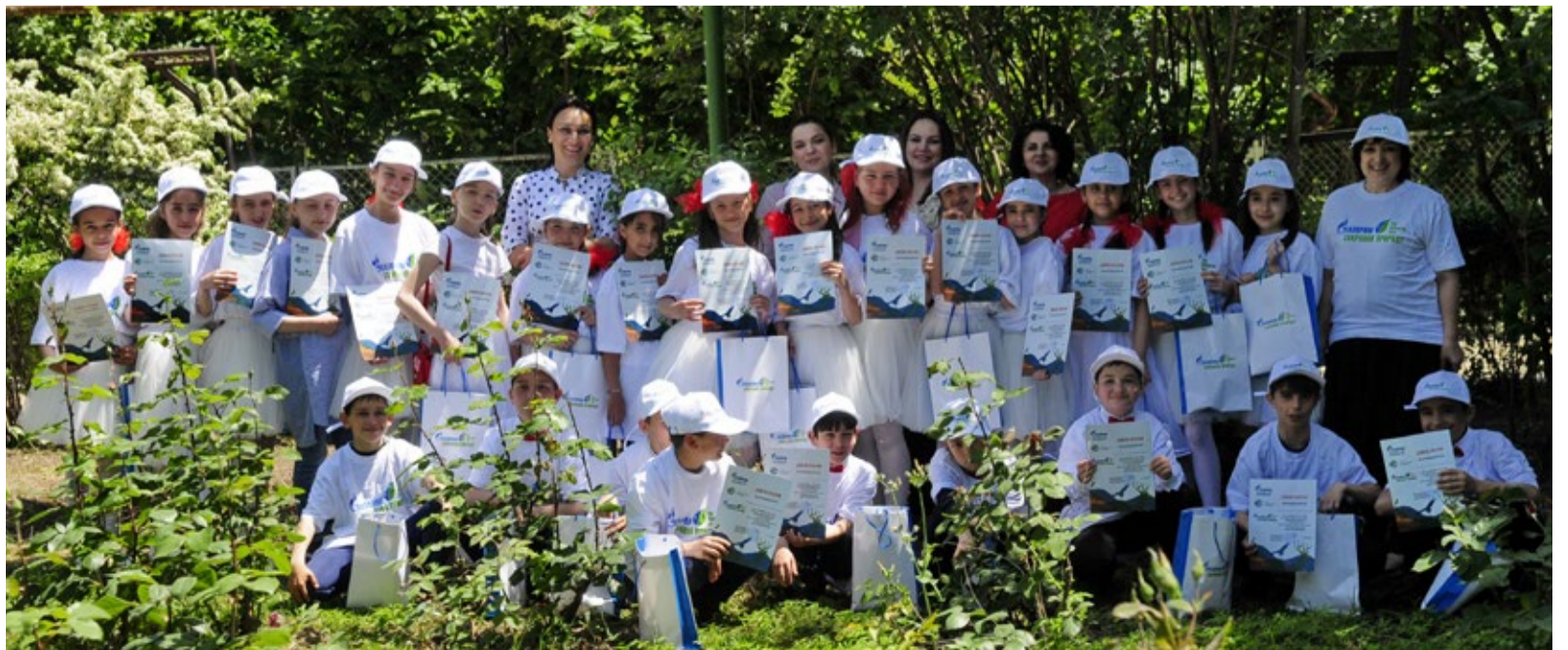
Коллективное фото на память