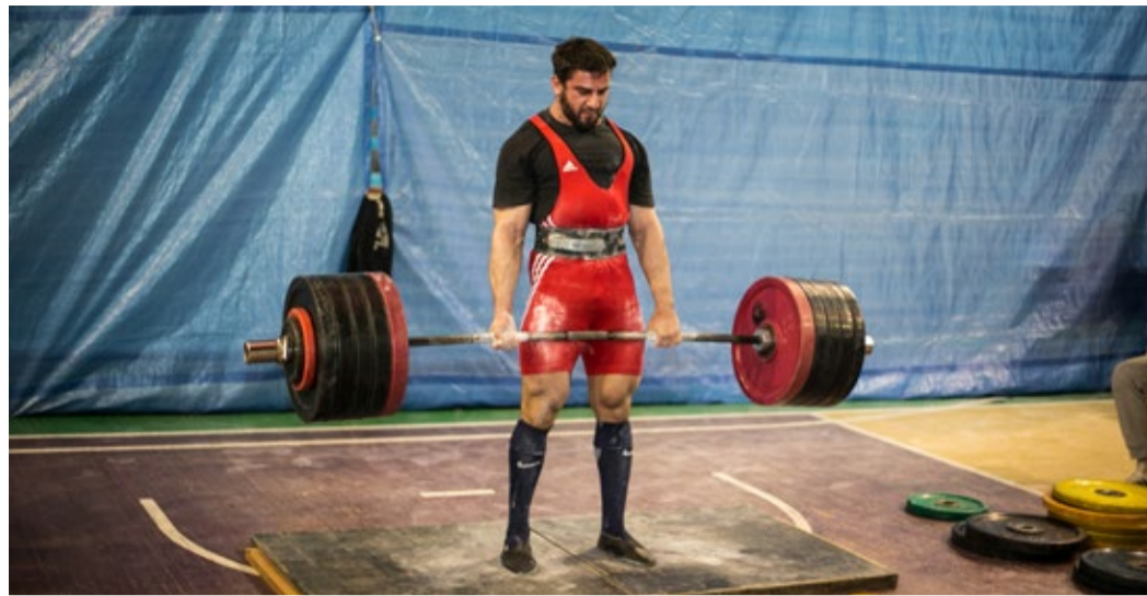
Кульминационный момент. Рывок... Победа!

Общеизвестно, что спорт укрепляет здоровье, воспитывает характер, делает человека выносливым и сильным, закаляет организм. Для некоторых людей спорт является смыслом жизни. Они ставят рекорды, завоевывают медали. И, конечно, эти спортсмены известны на весь мир.