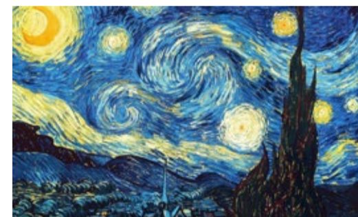
Винсент ван Гог «Звёздная ночь». 1889 г.

Редакция «Теплого дома» продолжает проект – «Современные производственные пейзажи глазами импрессиониста Винсента Виллема ван Гога».