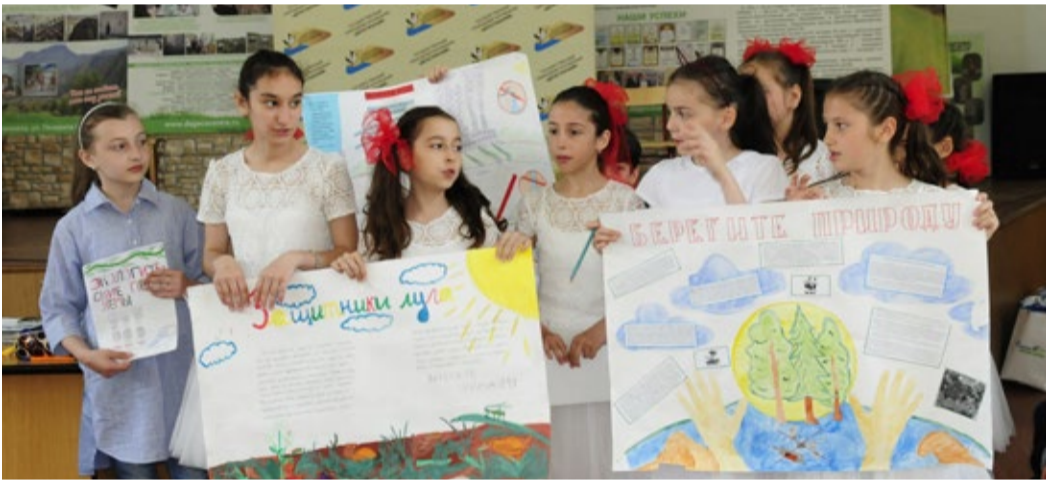
Презентация команды «Защитники природы»

В рамках Плана мероприятий по проведению Года экологии в ООО «Газпром трансгаз Махачкала» на 2017 год Группой охраны окружающей среды и энергосбережения совместно с ГБУ ГО РД «Республиканский эколого-биологический центр учащихся» (РЭБЦ) в конце мая была проведена экологическая игра «Знатоки природы».