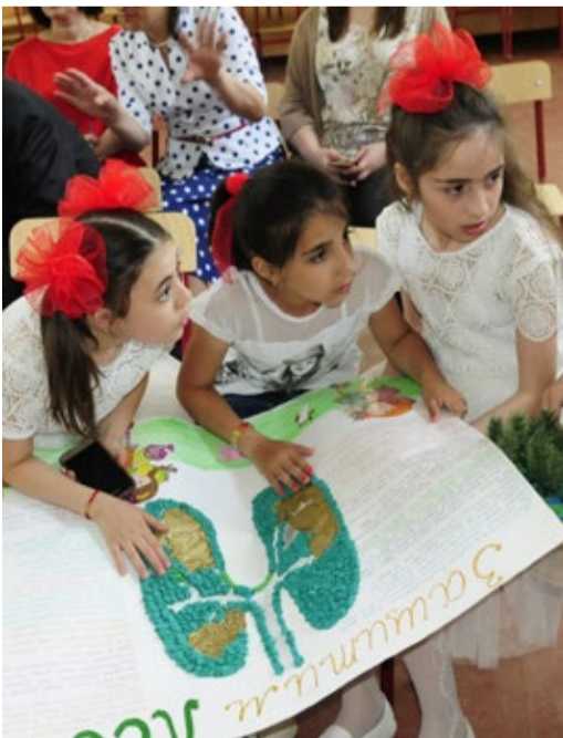
Обсуждение проекта «Защитим лес»