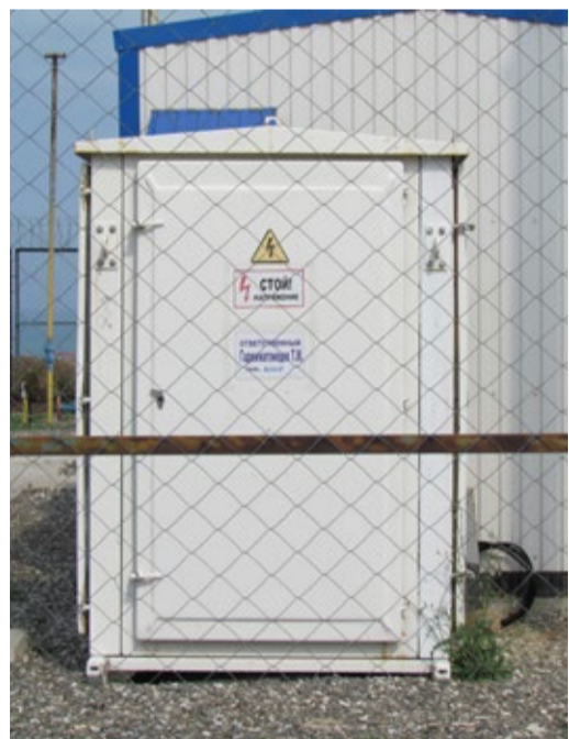
Станция катодной защиты