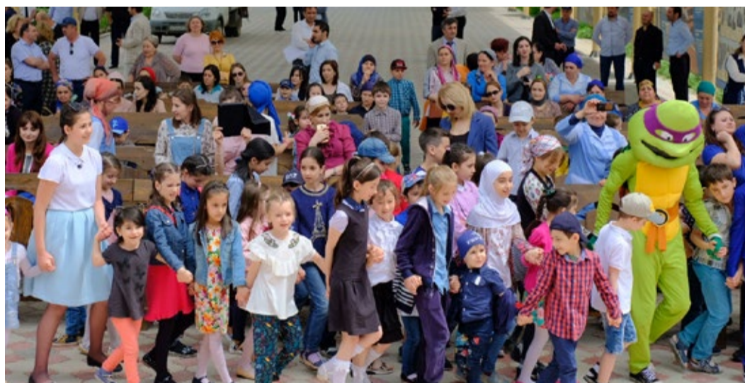
В разгар веселья

детей!!! Все получилось очень здорово! Участники праздника просто счастливы, а это значит, что все получилось! Огромное спасибо руководству предприятия и Объединенной профсоюзной организации за множество ярких эмоций и положительный заряд наших деток.»