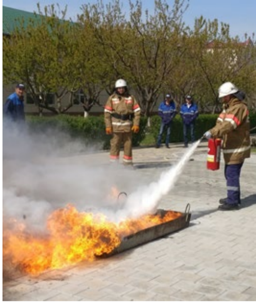
Тушение предполагаемого пожара

О беспечение безопасных и комфортных условий труда для сотрудников – одно из приоритетных направлений работы «Газпрома».