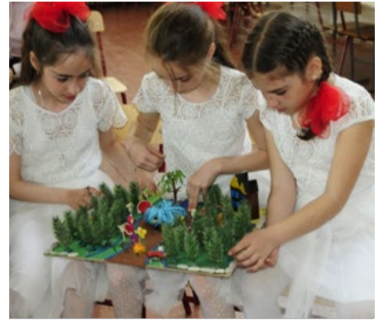
Макет острова, подготовленный юными экологами

В заключение жюри экологической игры «Знатоки природы», состоявшее из преподавателей Республиканского эколого-биологического центра, единогласно при-