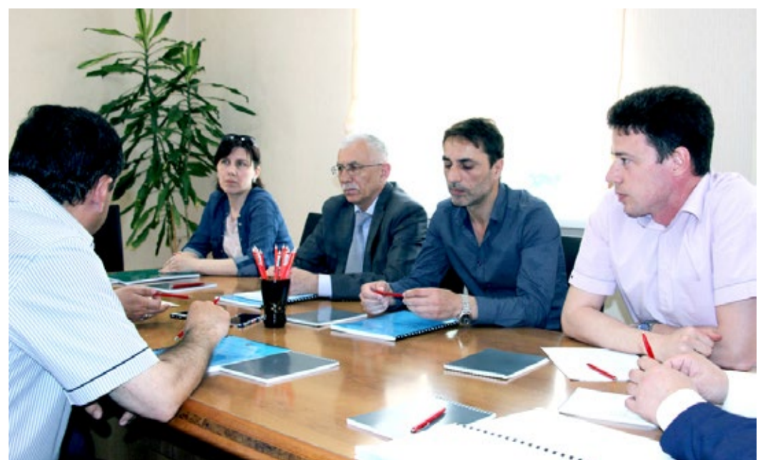
Во время обсуждения Стратегии обеспечения единства измерений