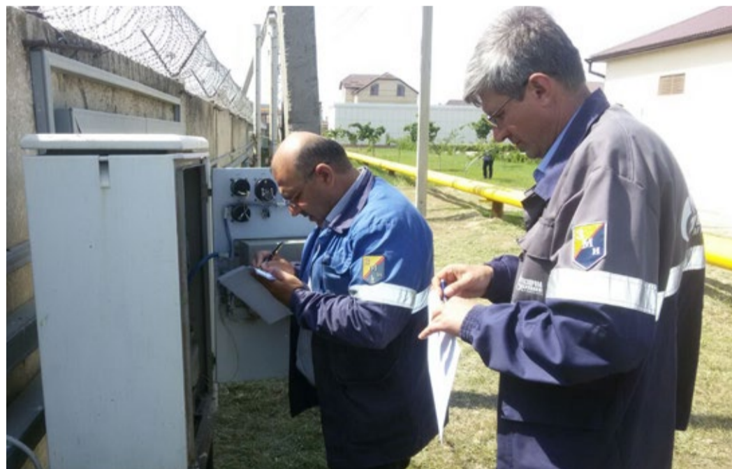
Выполнение практического задания конкурса

Противокоррозионная защита – это важная часть системы, которая обеспечивает надежность эксплуатации подземных и наружных металлических сооружений, продлевает срок службы эксплуатируемых объектов. Именно от работы инженеров по электрохимической защите в конечном счете зависит безаварийная работа оборудования, бесперебойное снабжение сырьем перерабатывающих мощностей, экологическая безопасность на территориях, где ведет свою деятельность предприятие, и именно они проводят противокоррозионные мероприятия, которые заключаются в обследовании изоляционных покрытий и обслуживании средств электрохимической защиты подземных газопроводов. В этой связи высококвалифицированная работа специалистов электрохимической защиты приобретает особое значение.