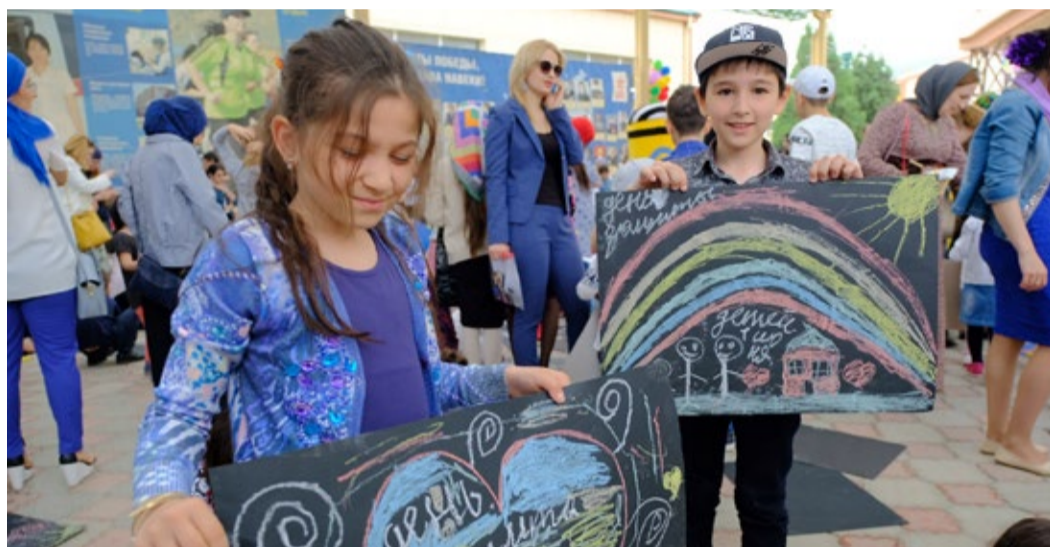
Творчество юных художников

– Замечательный повод. Чудесный, радостный, веселый праздник организован для наших детей. Думаю, что он надолго запомнится всем его участникам, ведь дети получили настоящее удовольствие от спектакля, подарков и сюрпризов. Никто не остался без внимания, а это очень важно! Вместе с персонажами любимых мультфильмов дети выполняли за клоуном Клепой