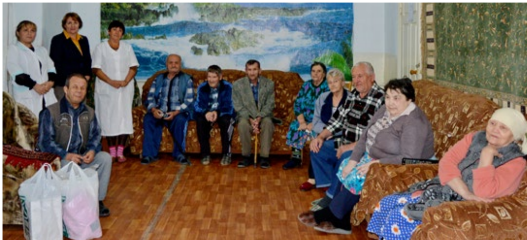
Коллектив и подопечные Дома престарелых