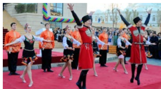
Ансамбль «Лезгинка» на открытии Исторического парка «Россия – моя история»

исторического парка: «Компания «Газпром трансгаз Махачкала» вносит посильный вклад в реализацию культурных, социальных, благотворительных проектов на территории Республики Дагестан. Хочется отметить, что труд газозавиков – не только создавать уют и приносить тепло в дома, но и строить будущее для наших детей, учить новые поколения созидательному труду, любви, уважению и знанию истории и культурных традиций России и Дагестана. И сегодня мы рады поздравить всех жителей республики с замечательным событием – открытием нового интерактивного музея площадью свыше семи тысяч квадратных метров, аналогов которому нет на Северном Кавказе. Уверен, что музейные площадки всегда будут полны молодежи и студентов, для которых каждая экспозиция представляет огромный интерес и возможность прикоснуться к истории России и Дагестана».