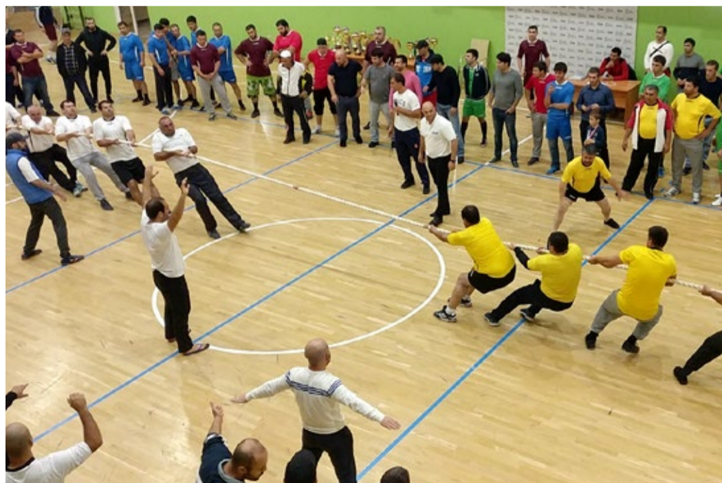
Еще один рывок