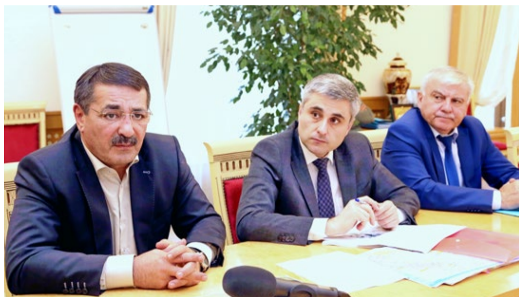
Участники совещания по охранным зонам

Согласно ст. 90 Земельного кодекса Российской Федерации и ст. 28 Федерального закона от 31.03.1999 № 69-ФЗ «О газоснабжении в Российской Федерации» границы охранных зон, на которых размещены объекты системы газоснабжения, определяются на основа-