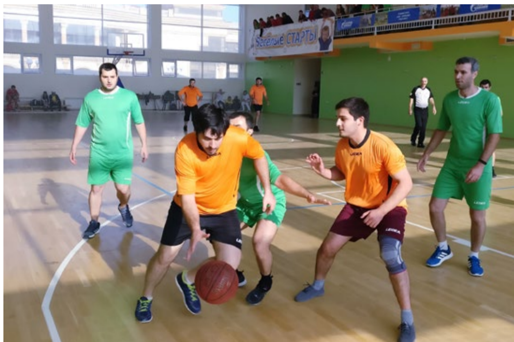
Серьезная борьба за результат