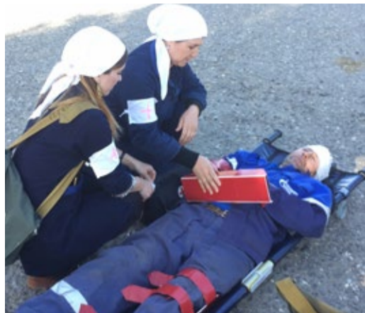
Оказание помощи «пострадавшему»

В рамках прошедшей 4–6 октября 2017 года Всероссийской штабной тренировки по гражданской обороне в Обществе 5–6 октября проведено командно-штабное учение: «Организация управления мероприятиями по локализации и ликвидации ЧС мирного времени и перевод системы гражданской обороны Общества с мирного на военное положение».