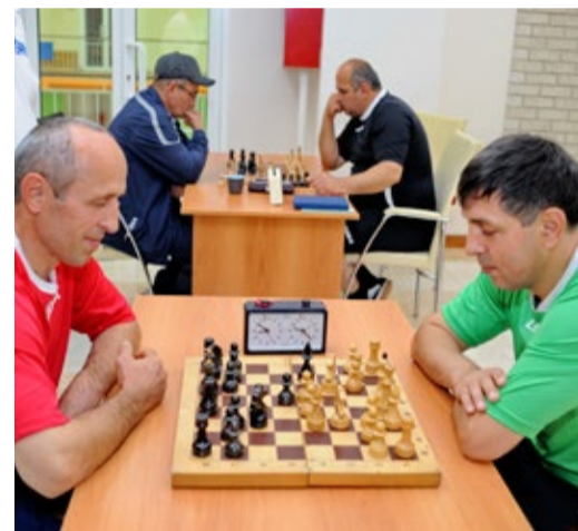
Шах или мат?