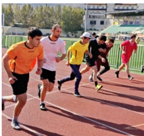
До финиша – всего чуть-чуть