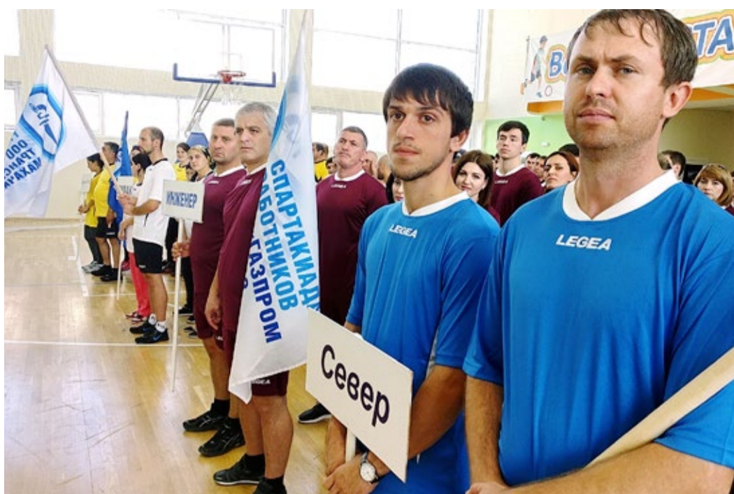
К старту готовы