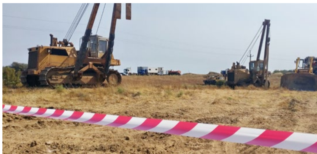
Ремонтные работы на магистральном газопроводе