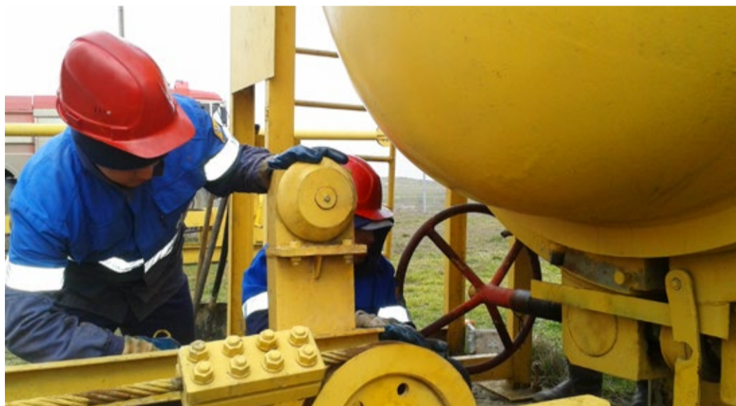
Камера запуска внутритрубных устройств