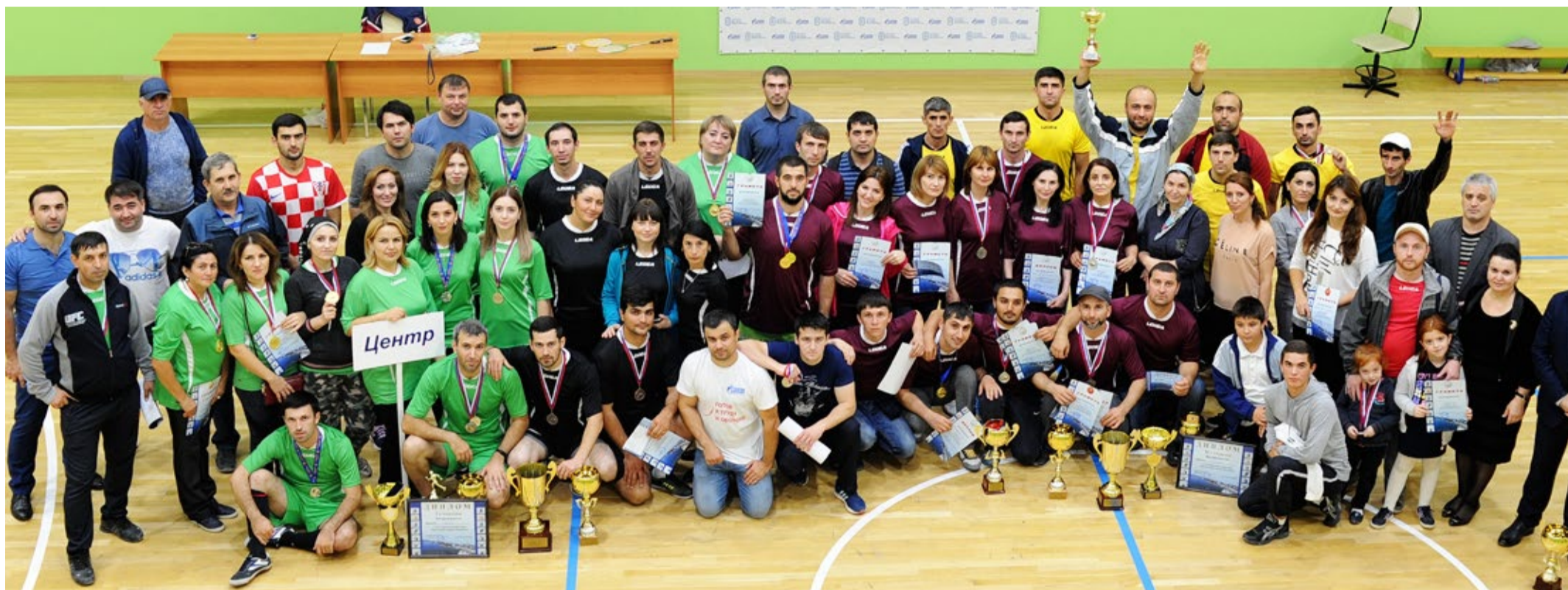
Памятное фото победителей и призеров Спартакиады

Прошла VII Спартакиада работников ООО «Газпром трансгаз Махачкала» 12–13 октября. По традиции спортивное мероприятие было организовано усилиями Объединенной первичной профсоюзной организации «Газпром трансгаз Махачкала Профсоюз». За первенство в Спартакиаде соперничали около 300 человек в составе 8 команд, представляющих все филиалы и управления предприятия: «Порт-Петровск» –