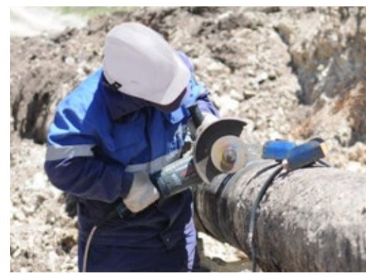
Подготовка к сварочным работам