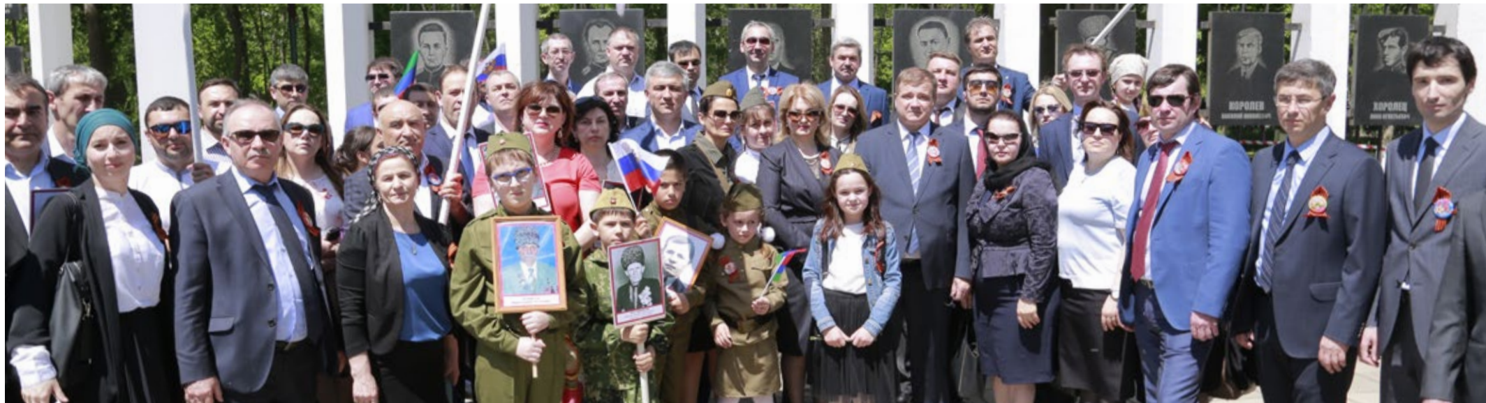
Коллектив ООО «Газпром трансгаз Махачкала» на праздновании Дня Победы

Каждый год 9 мая всей страной мы отмечаем дорогой для всех нас праздник – День Победы! Победы, которая вернула людям право на свободную и мирную жизнь. В этот день мы вспоминаем самоотверженность всех, кто с честью принял удар и с первых дней войны не давал пощады врагу. Кто, не жалея собственной жизни, шел в бой. Кто упорным и тяжелым трудом обеспечивал фронт, бесстрашно противостоял захватчикам на оккупированной территории.