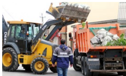
ЗЕЛЕНАЯ ВЕСНА: ПУСТЬ ВСЕГДА БУДЕТ ЧИСТО!

Подведены итоги конкурса профмастерства Стр. 2