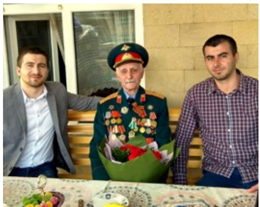
В гостях у ветерана