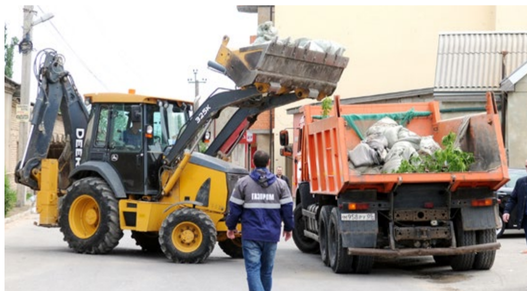
Спецтехника – главный помощник