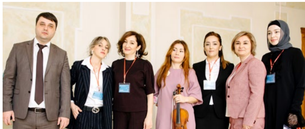
Участники республиканского семинара «Маммология от А до Я»

В конференц-зале ООО «Газпром трансгаз Махачкала» 21 апреля состоялся республиканский семинар «Маммология от А до Я», направленный на повышение квалификации врачей, занимающихся ранней диагностикой патологии молочных желез.