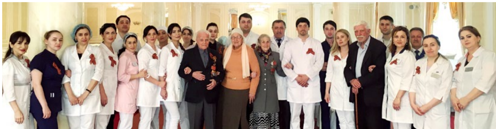
Коллектив Медицинской службы Общества во время чествования ветеранов Великой Отечественной войны