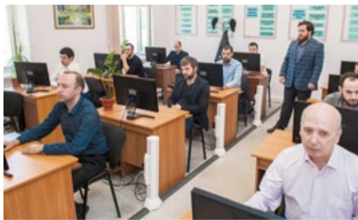
Выполнение теоретических заданий

На базе Учебно-производственного центра ООО «Газпром трансгаз Махачкала» 26 апреля состоялся конкурс профессионального мастерства «Лучший по профессии – 2018», ежегодно проводимый Обществом в целях повышения престижа профессий, распространения передового опыта среди молодых специалистов и совершенствования профессионального мастерства.