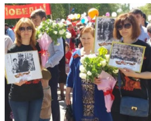
Представители коллектива Тарумовского ЛПУМГ