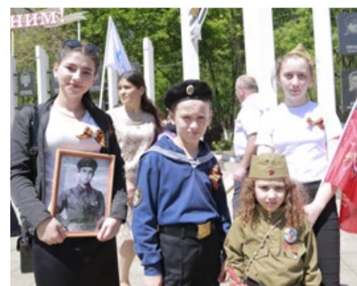
Молодое поколение газпромцев