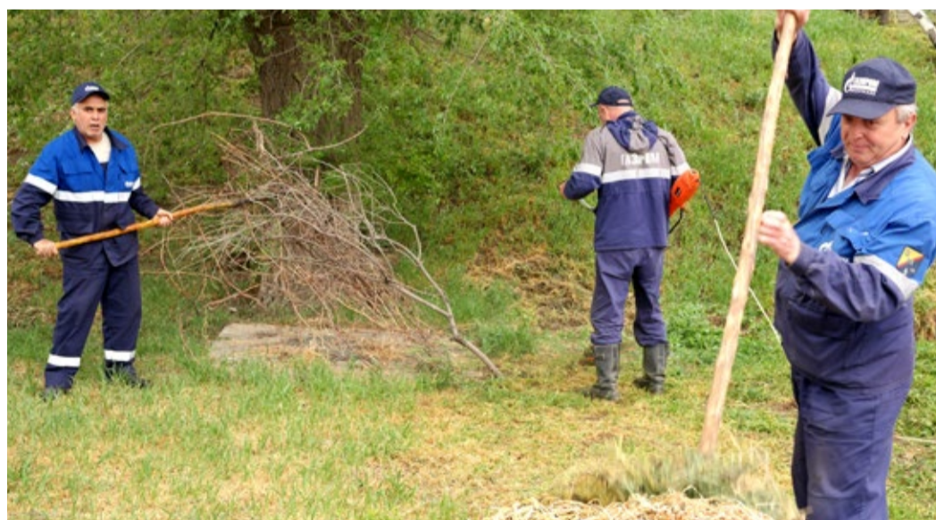
Работники Избербашского ЛПУМГ на субботнике