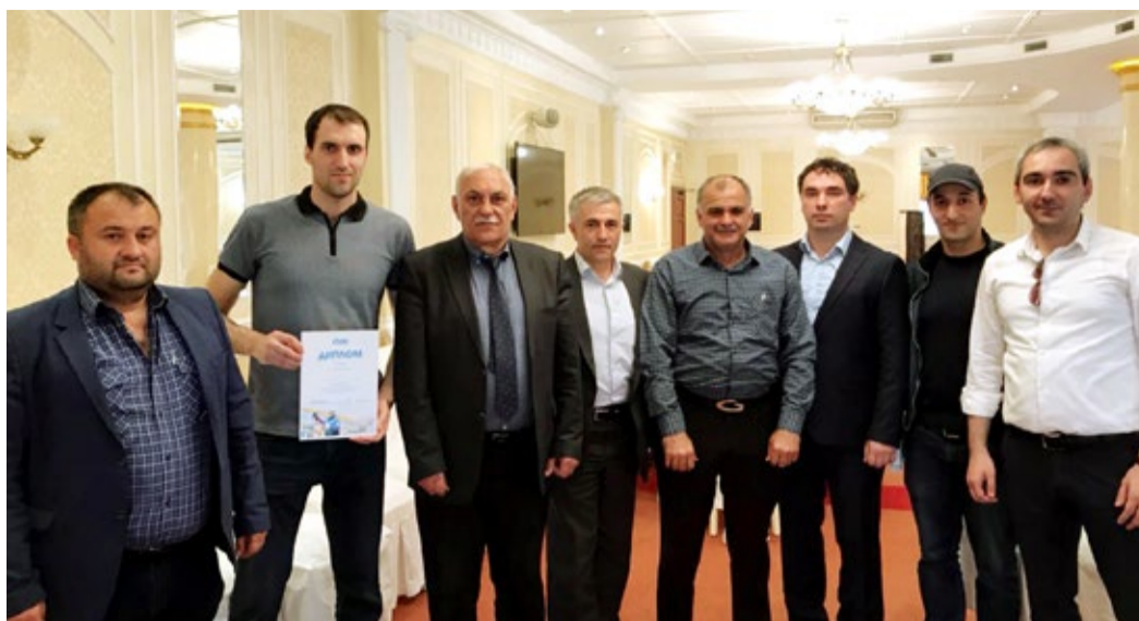
Команда «Каспий» – победитель интеллектуальной игры «Узнать за 60 секунд»