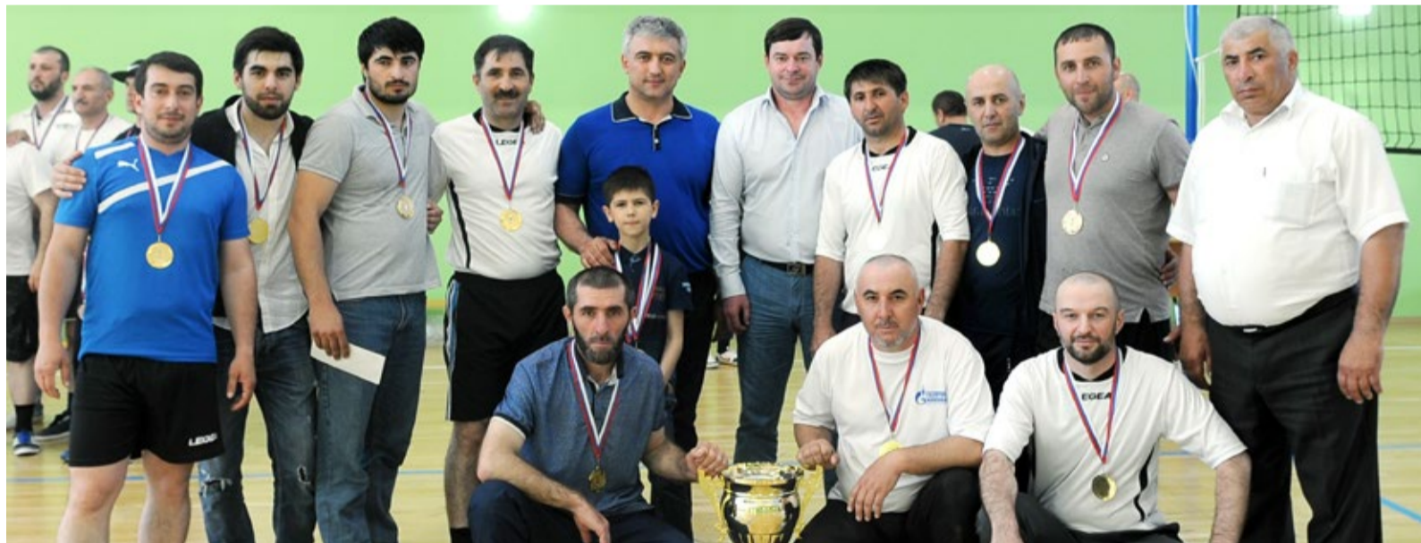
Победители волейбольного турнира – команда «Сулак»