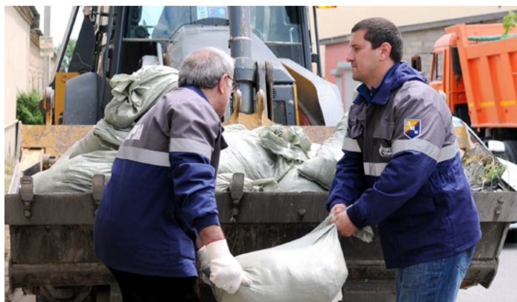
Ну-ка вместе, ну-ка дружно!