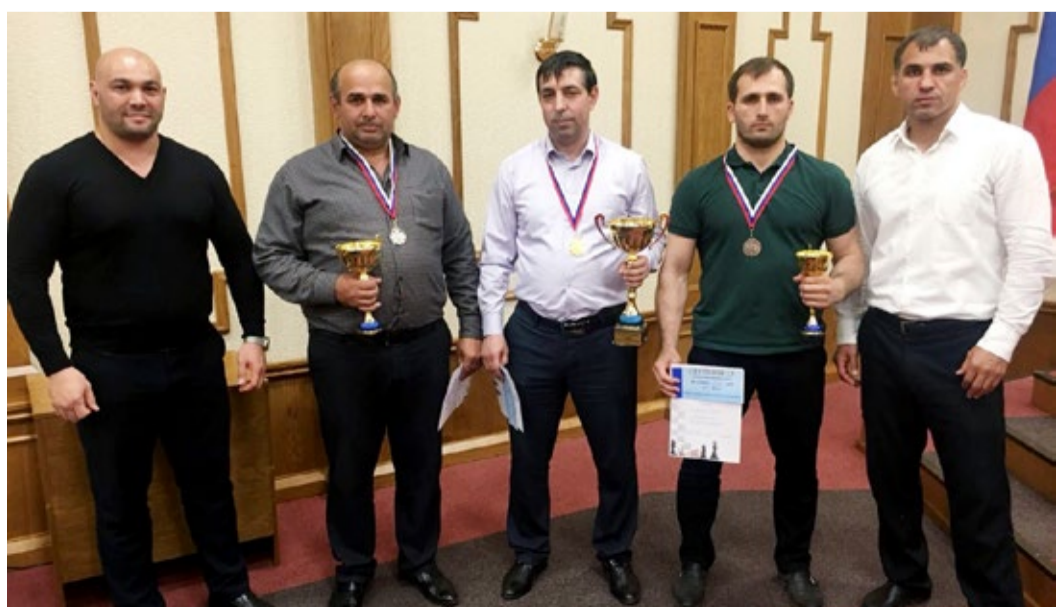
Победители и призеры шахматного турнира