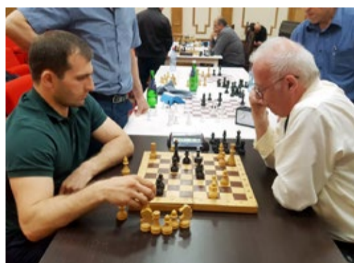
Шах или мат?

На той же интеллектуальной волне, что и игра «Узнать за 60 секунд», 26 апреля прошел шахматный турнир, организованный Объединенной первичной профсоюзной организацией «Газпром трансгаз Махачкала профсоюз». В нем приняли участие 12 представителей филиалов и подразделений Общества.