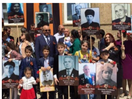
Коллектив Дербентского ЛПУМГ на торжественном митинге