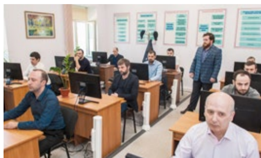
ТЕОРИЯ И ПРАКТИКА ДЛЯ ЛУЧШИХ ПО ПРОФЕССИИ

Подведены итоги конкурса профмастерства Стр. 2