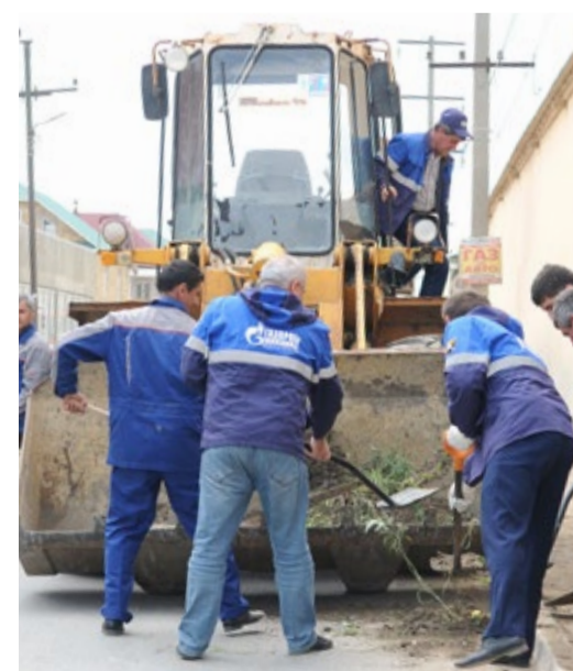
В разгаре субботника