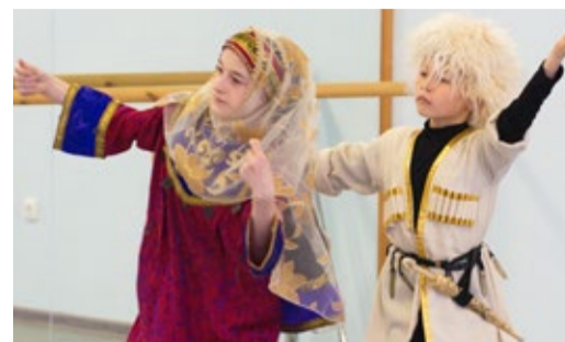
ЗАЖИГАЕМ ПЛАМЯ «ФАКЕЛА»!

Молодые специалисты Общества поздравили ветеранов Стр. 4