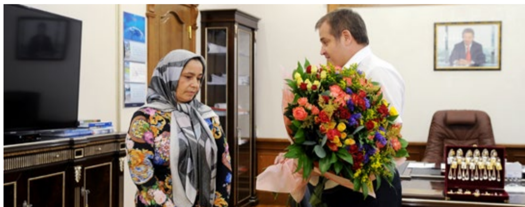
С наилучшими пожеланиями и поздравлениями