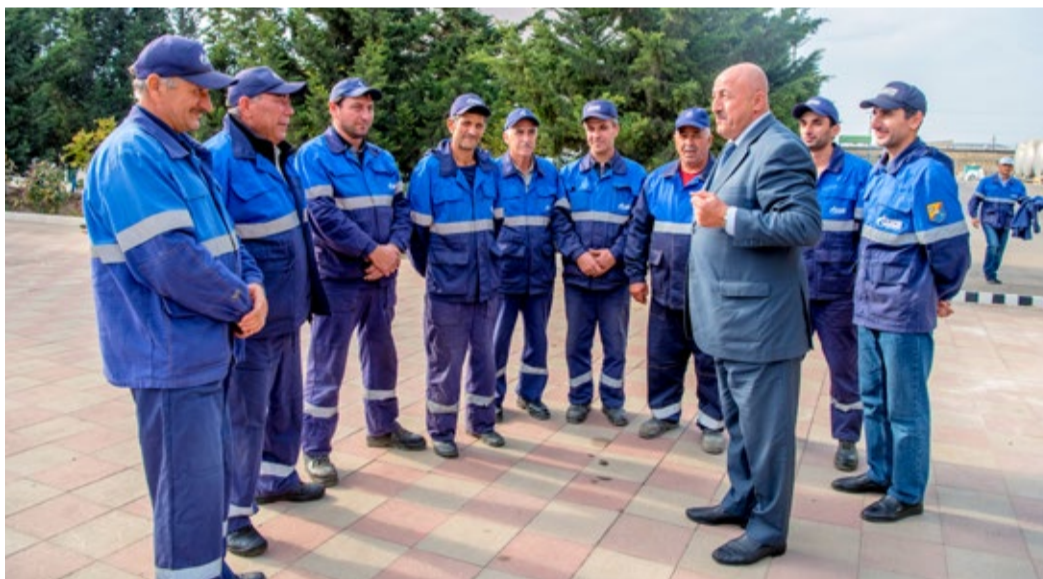
В окружении коллектива

– На мой взгляд, никакого секрета тут нет. Любой человек может добиться успеха в работе при определенных условиях. Для этого необходимо, во-первых, знать и любить свое дело – это самое главное! Во-вторых, постоянно развиваться, регулярно учиться чему-то новому, двигаться вперед. За моими плечами огромный опыт: в горной местности построено более 150 км газопроводов, 15 ГРС, несколько трансформаторных станций, проложены километры линий технологической связи и электропере-