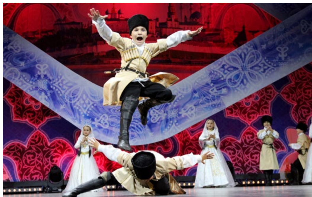
Азарт молодежной лезгинки

Затем перед гостями выступил Государственный ансамбль песни и танца Республики Татарстан, познакомивший зрителей с богатой национальной татарской культурой. В последние три фестивальных дня сцена МИЦ стала родной для всех самодеятельных артистов: на ней исполняли оперные арии и кружились в вихре бального танца, шагали на ходулях и мастерски проделывали акробатические трюки, радовали взгляд народными плясками и многообразием национальных костюмов коллективы из Беларуси и Кыргызстана, из Санкт-Петербурга и Москвы, Волгограда и Краснодар, Астрахани и Ставрополя, Махачкалы и Нижнего Новгорода, Казани и Саратова, Самары, Уфы и Оренбурга.