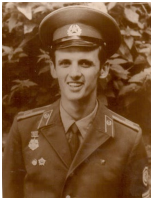
г. Тырныауз, 1981 г.

В 1980 году я был участником так называемой «Эльбрусиады – 80», организованной накануне Олимпийских игр и в честь XXVI съезда КПСС. Тогда я и почти 50 моих товарищей совершили восхождение на высочайшую вершину Европы – двуглавый Эльбрус, водрузив на вершине (5642 м) знамена родов войск и знамя СССР. По окончании училища нам всем было присвоено звание «Альпинист СССР», вручены удостоверения и нагрудные знаки.