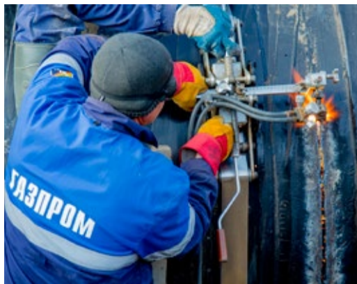
Демонтаж заменяемого участка

Наше Общество ведет огневые работы в рамках программы капитального ремонта газотранспортной системы ООО «Газпром трансгаз Махачкала» в целях обеспечения надежности и безопасности ее функционирования.