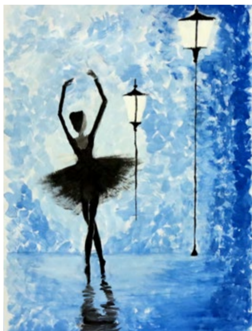
«Вечерний танец» – работа Сабины Караяновой

носятся далеко в горах и повторяются эхом. И наконец, два любящих сердца встречаются, и радость от этой встречи готовы передать в танце, подарить зрителю, вложив ее в каждое движение. Андийский танец – это гармония природы и человека, повесть о любви и жизни горцев в суровых условиях. Интересно, что костюмы танцоров выполнены в тра-