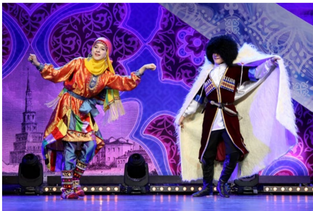
Яркий танец хореографического ансамбля «Чулпан»

ную ценность, танец рассказывает об одном из самых радостных моментов жизни горца, высоко в горах пасущего отары овец. Долгие месяцы пастух водит стада по склонам гор и мечтает о встрече с любимой, поет песни о разлуке и любви, отзвуки которых раз-