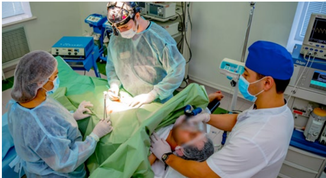
Во время операции в хирургическом блоке МСЧ

Мы оказываем услуги хирургического направления: лапароскопическая холецистэктомия, грыжесечение всех видов грыж – как открыто, так и лапароскопически, абдоминопластика, геморроидэктомия; урологической направленности – варикоцеле, водянка; делаем лороперации, в том числе септопластику – выравнивание перегородки носа, и другие виды операций, об этом можно узнать из прайс-листа. Отмечу, что гастрокопист, он же и хирург, выполняет клипирование сосудов пищевода