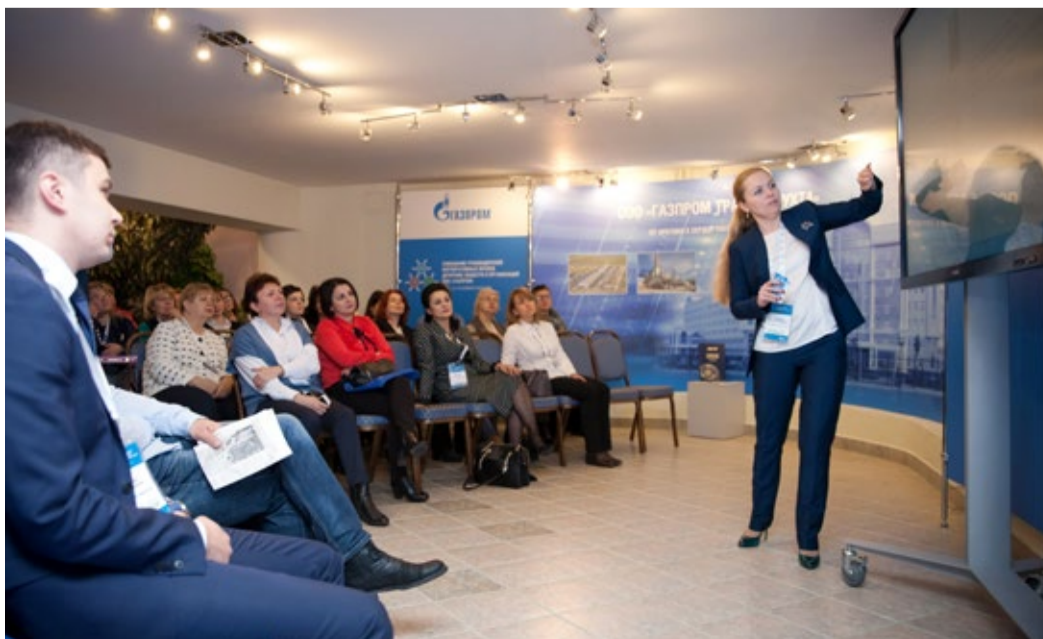
Презентация мультимедийной версии «Хронографа отечественной газовой и нефтяной промышленности»