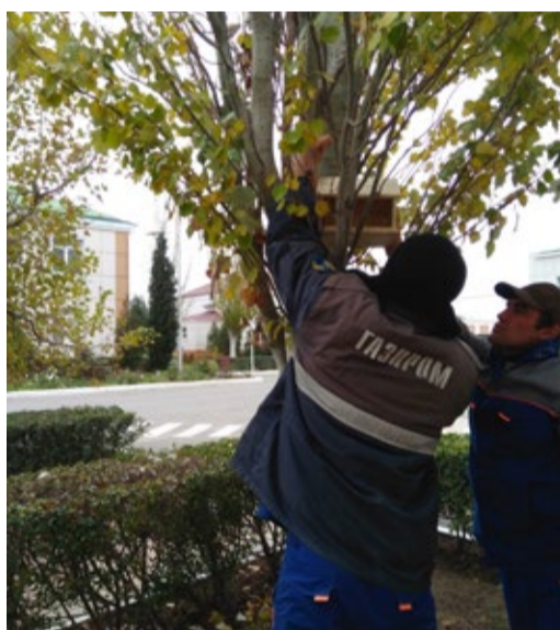
В Махачкалинском ЛПУМГ к зимовке птиц готовы