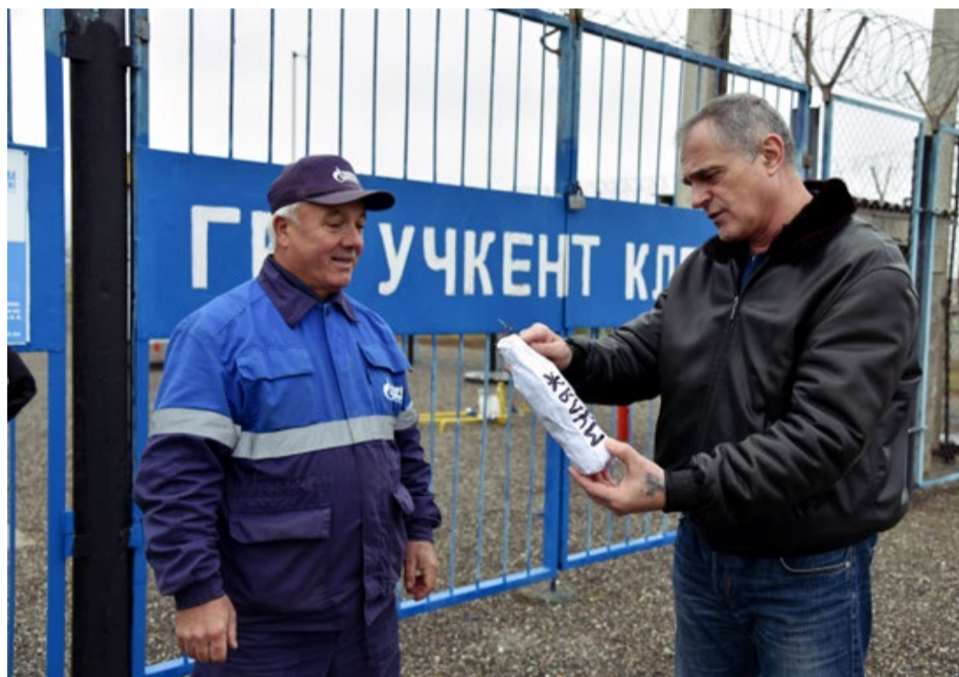
Практическое занятие с оператором ГРС

После подписания Постановления «О соблюдении законодательства в сфере охранных зон объектов систем нефте- и газоснабжения» Главой Республики Дагестан дано указание профильным министерствам об особом контроле этих вопросов. Кроме того, на совещаниях, проводимых Владимиром Васильевым, главы местных администраций отчи-