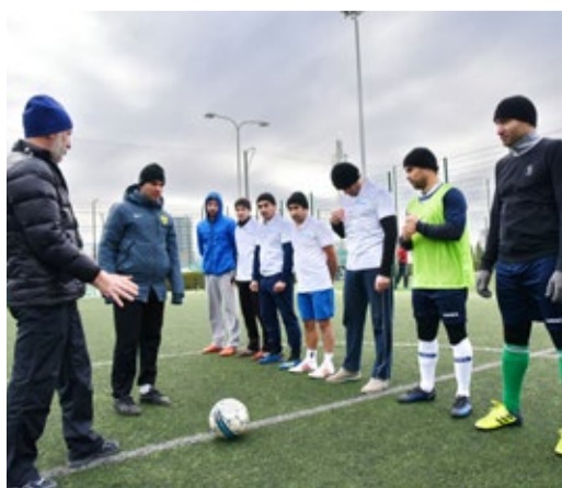
Судья разъясняет правила игры

От имени руководства предприятия с приветственным словом к участникам турнира об-