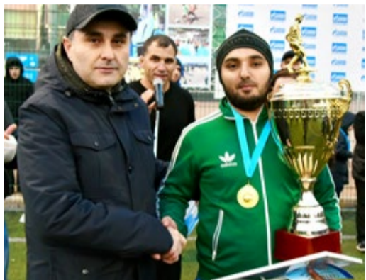
Награждение команды «Great team»