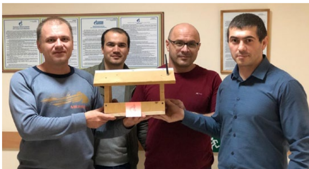
Результат совместного труда работников Управления связи