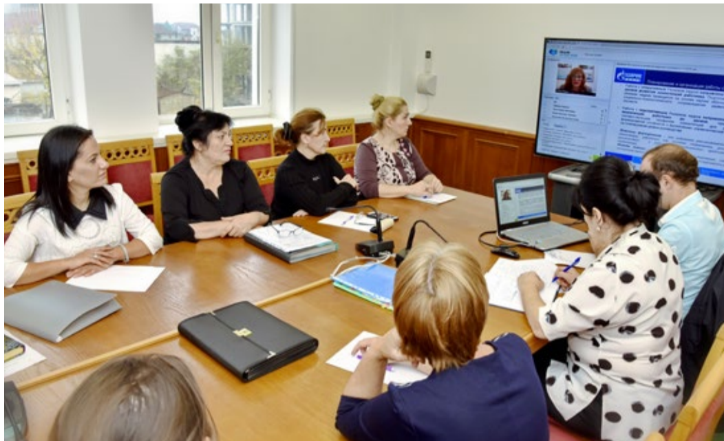
Обучение в онлайн – режиме

В начале ноября, специалисты кадровой службы администрации и филиалов предприятия приняли участие в обучающем вебинаре «Инструменты развития кадрового резерва».