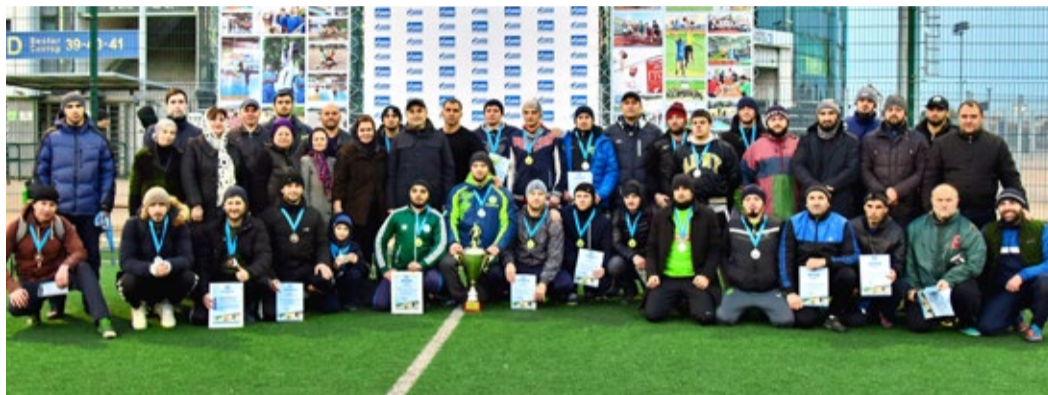
Турнир объединил коллег