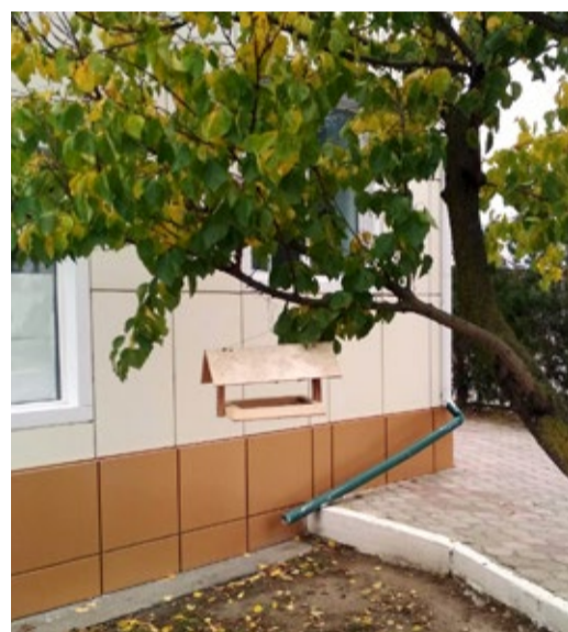
Старт акции дали в Тарумовском ЛПУМГ

В Синичкин день жители разных населенных пунктов страны готовятся к встрече «зимних гостей» – птиц, остающихся на зимовку в наших краях: синиц, воробьев, голубей, соек и других. Люди делают и развешивают кормушки, заготавливают для них подкормку, в том числе и «синичкины лакомства»: несоленое сало, нежареные семечки тыквы, подсолнечника или арахиса.