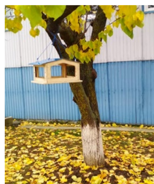
Одна из кормушек Избербашского филиала