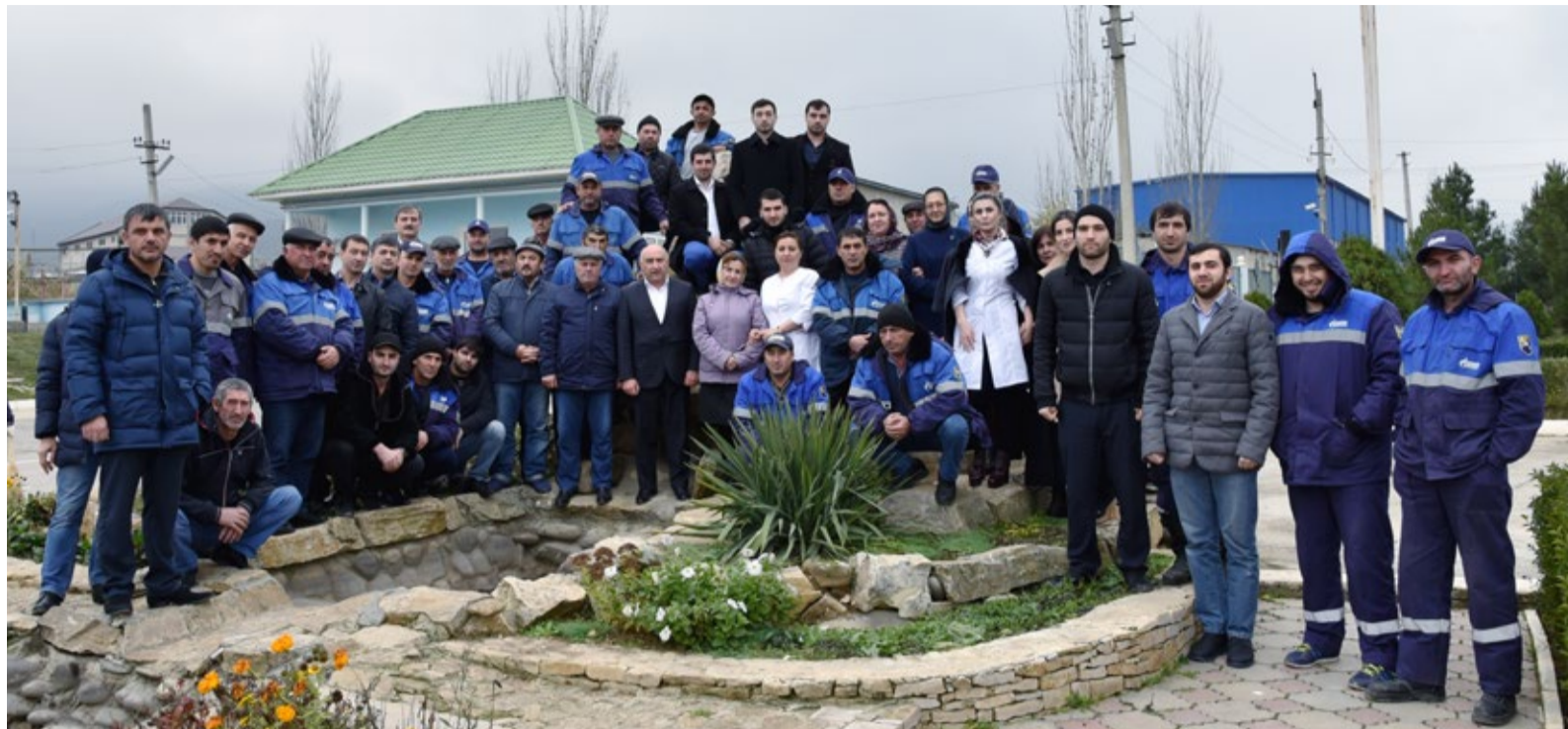
Трудовой коллектив UAVP

В 2018 году исполнилось 15 лет с момента образования филиала, на который возложена ответственная задача – ликвидация последствий аварий на газотранспортной системе Общества.