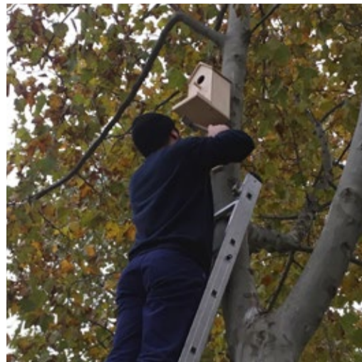
Скворечник от СНУС