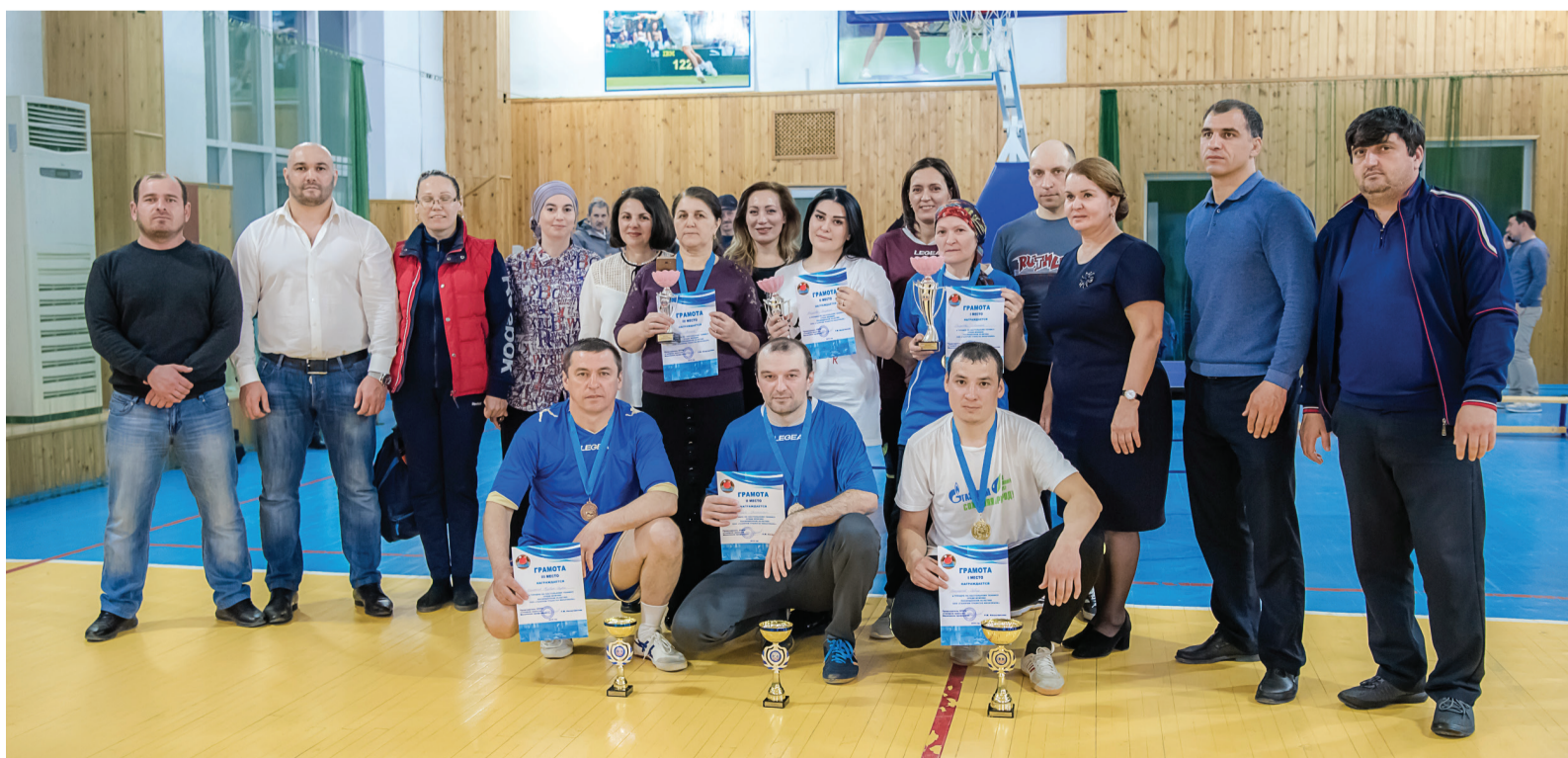
Участники турнира по настольному теннису

Подводя итоги замечательного спортивного турнира, хочется отметить, что такие мероприятия прежде всего дарят участникам заряд бодрости и хорошего настроения, а еще они прочно внедряют в сознание мысль о пользе и необходимости заниматься спортом и вести здоровый образ жизни.