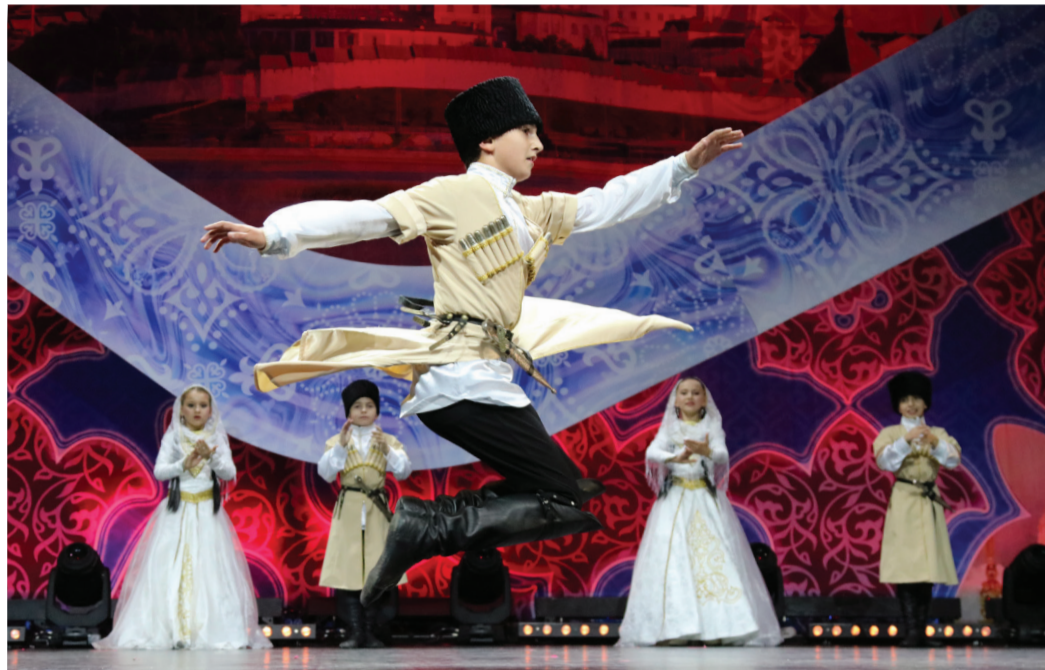
Детский хореографический ансамбль «Тарки-Тау»

ный коллектив предприятия и ветеран фестиваля. Из всех призовых мест 10 принадлежат именно его участникам – детям работников Общества. В 2008 году детский ансамбль «Кумторкала» (по сути младший состав ансамбля «Сари Кум») был удостоен Гран-при