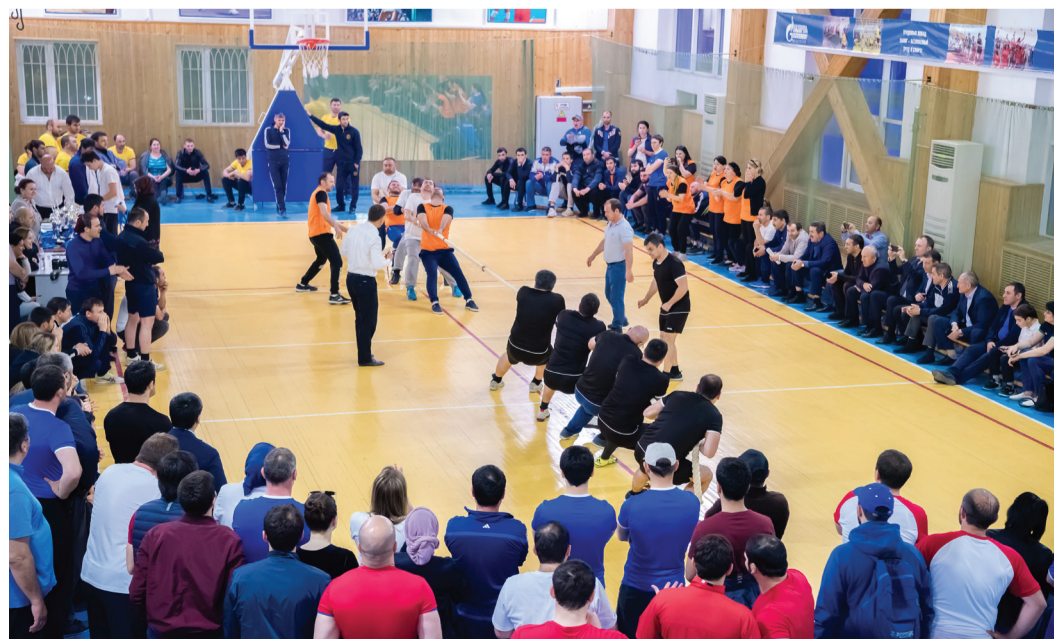
Заключительное состязание – перетягивание каната

яркими победами работников, на протяжении многих лет демонстрирующих свои лучшие профессиональные качества не только на производстве, но и в спортивной жизни коллектива. Подтверждение тому – многочисленные кубки, медали и грамоты, украшающие стенды производственных и административных зданий предприятия.