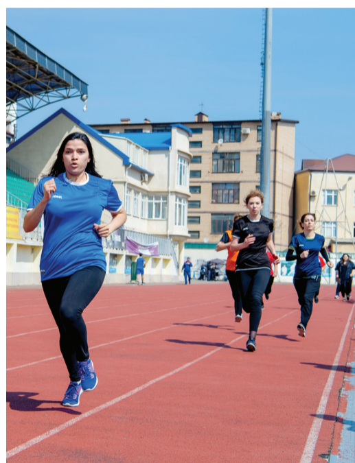
Соревнования по бегу

яркими победами работников, на протяжении многих лет демонстрирующих свои лучшие профессиональные качества не только на производстве, но и в спортивной жизни коллектива. Подтверждение тому – многочисленные кубки, медали и грамоты, украшающие стенды производственных и административных зданий предприятия.