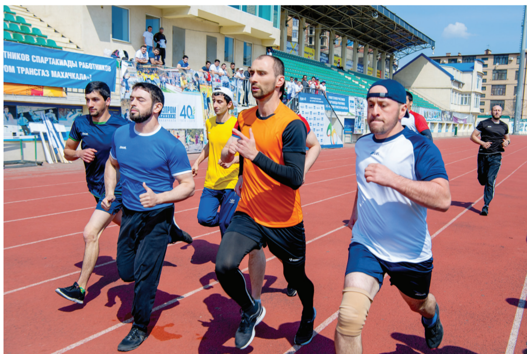
Мужской забег. Дистанция 1000 метров