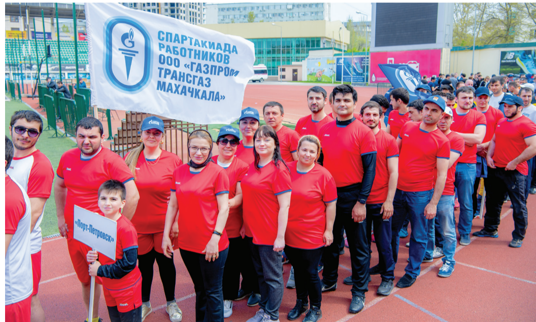
Парад команд-участниц IX Спартакиады