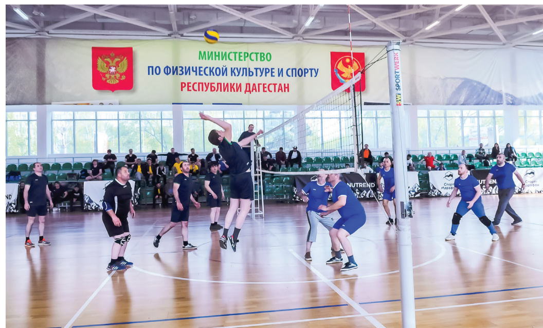
Встреча команд «Центр» и «Инженер»

Особенно захватывающее зрелище представляли собой состязания, в которых за право первенства боролись признанные лидеры прошлых лет: на волейбольной площадке сошлись две команды – «Центр» и «Сулак». За