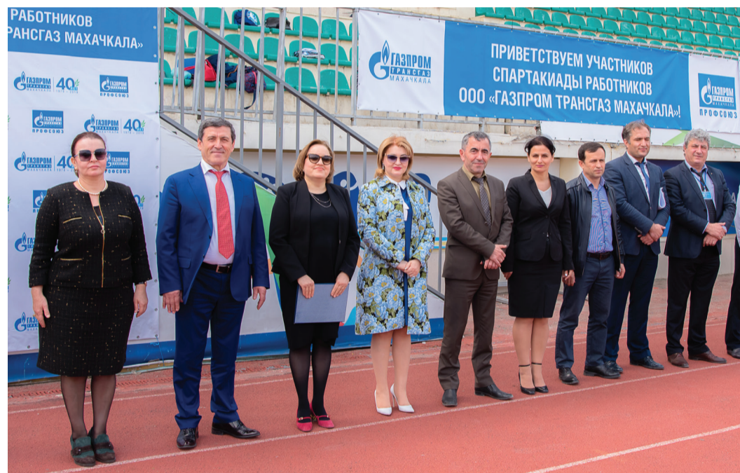
Торжественное открытие IX Спартакиады

аплодисменты групп поддержки – все болели за всех! – пронеслись бегуны, передавая эстафетную палочку в командном забеге, опережая соперников на коротких дистанциях в личном первенстве и стремясь к финишу изо всех сил. Да, были победители и побежденные, но именно это чувство – быть частью большой команды, где все стремятся к