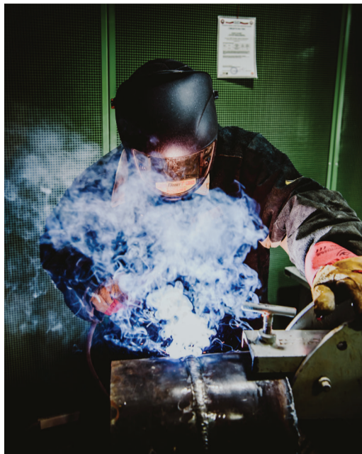
Проверка практических навыков сварщика

После завершения всех экзаменов и подведения итогов аттестации ее участникам были выданы соответствующие удостоверения, согласно которым аттестованные специалисты