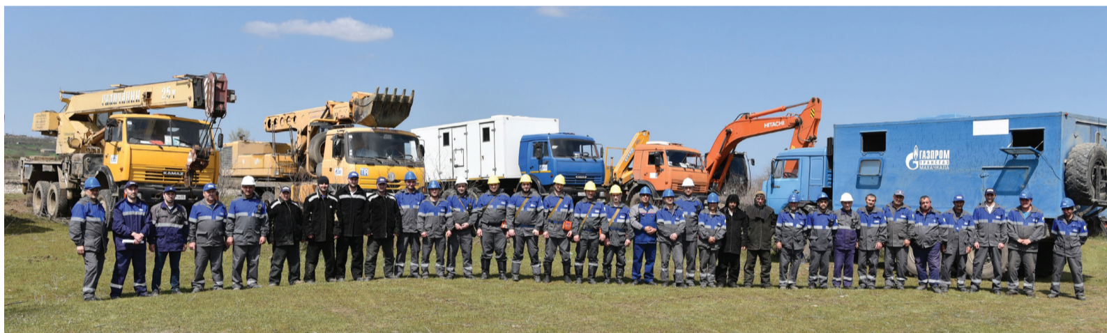
Более 170 работников и 47 единиц автомобильной и специальной техники приняли участие в комплексных противоаварийных тренировках