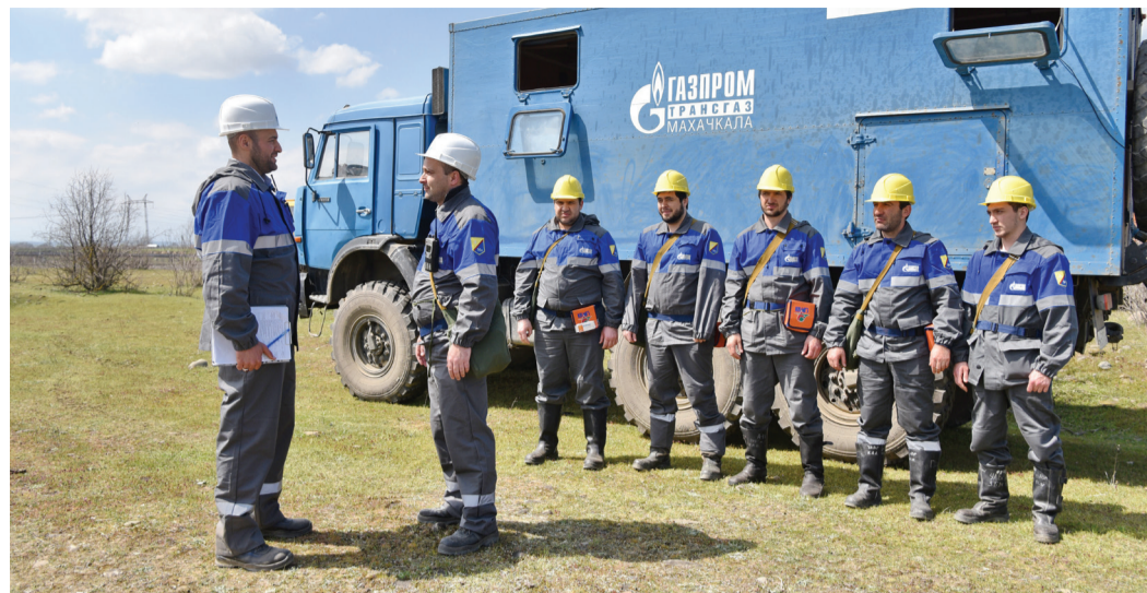
Бригада НАСФ точно и в срок прибыла на участок условного разрыва

Участники тренировки отработали сценарий в соответствии с регламентом: по системе телемеханики были оперативно закрыты линейные краны, обеспечивающие отсечение аварийного участка, а также отводные краны газопроводов-отводов; оповещены все лица, принимающие участие в локализации