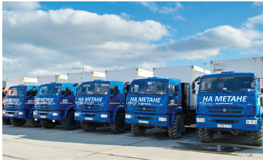
Спецтехника – основа автопарка предприятия