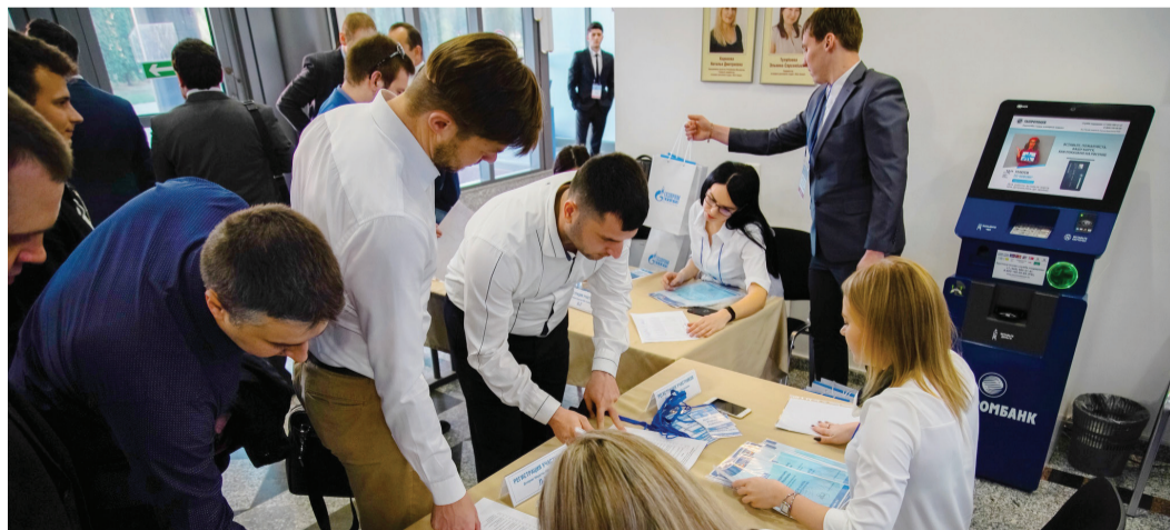
Специалисты нашего предприятия на регистрации участников конференции

С 8 по 12 апреля на базе ООО «Газпром добыча Астрахань» прошла VIII открытая научно-практическая конференция молодых специалистов и молодых работников «Молодежь и наука: знания, опыт, перспективы». В мероприятии приняли участие 154 представителя 39 организаций Группы «Газпром» из Ухты, Иркутска, Кузнецка, Салавата, Москвы, Саратова, Краснодар и Уренгоя. Кроме того активными участниками конференции стали преподаватели и студенты Астраханского государственного технического университета, Московского государственного технического университета им. Н.Э. Баумана,