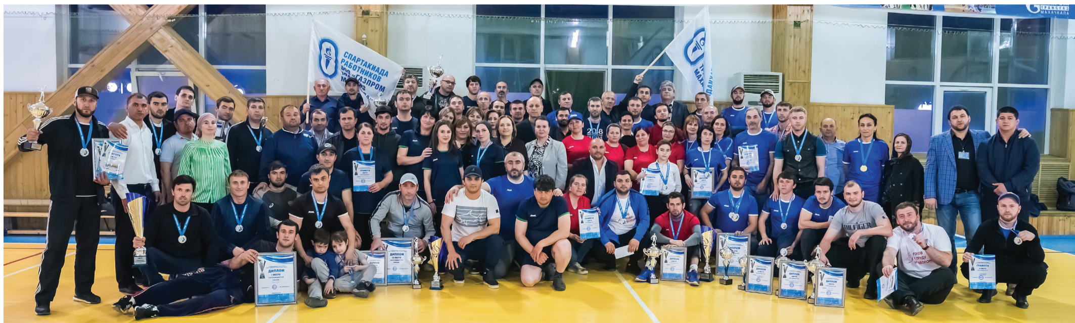
Коллективное фото призеров и победителей IX Спартакиады работников ООО «Газпром трансгаз Махачкала»