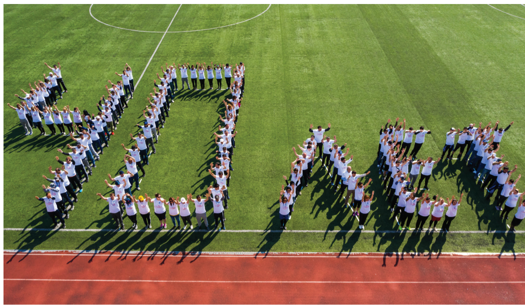
IX Спартакиада посвящена 40-летию ООО «Газпром трансгаз Махачкала»

этой игрой, где все решали минуты и минимальный разрыв по очкам, болельщики наблюдали, зажав дыхание. И их ожидания оправдались в полной мере – слаженная работа команды, царившее на площадке напряжение и молниеносные решения, принимаемые игроками, чувство локтя и полная самоотда-