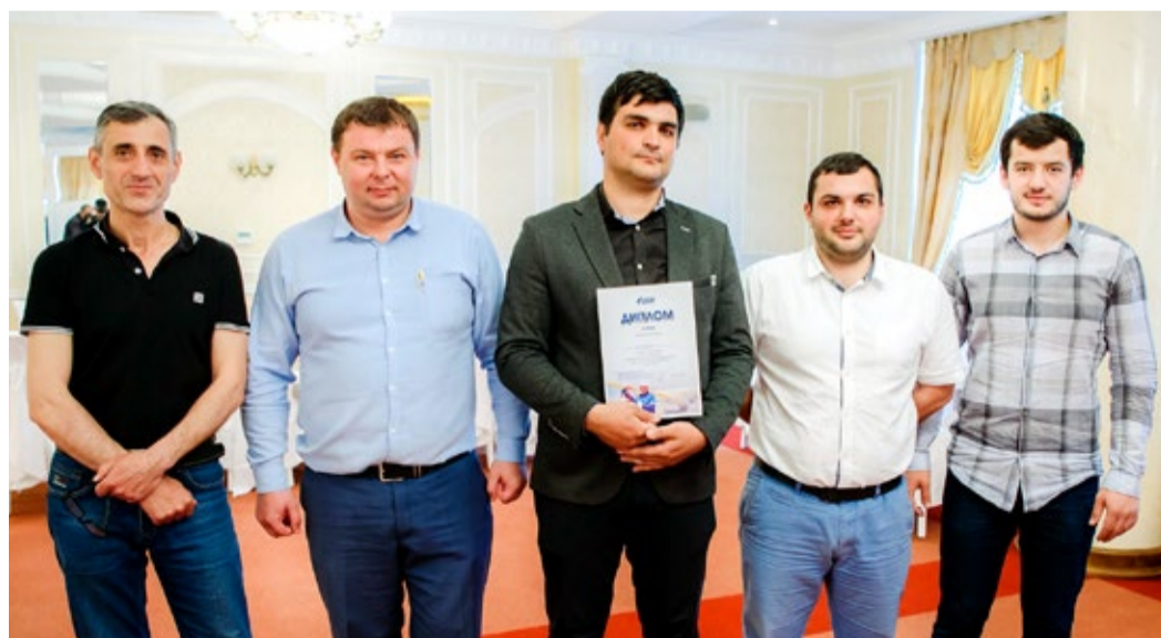
Команда «Столица» – победительница игры

В результате первое место было присуждено команде Махачкалинского ЛПУМГ «Столица», на втором месте – команда УПЦ «Комитет 300», и тройку лидеров замкнула команда «Да УАВР и все!».