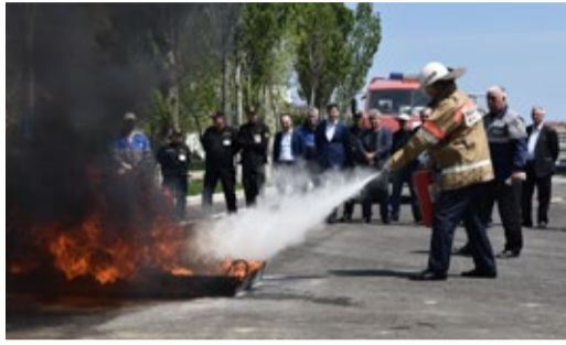
ОТРАБОТАЛИ НАВЫКИ ТУШЕНИЯ ПОЖАРОВ Учебно-тренировочное занятие прошло в Обществе Стр. 2