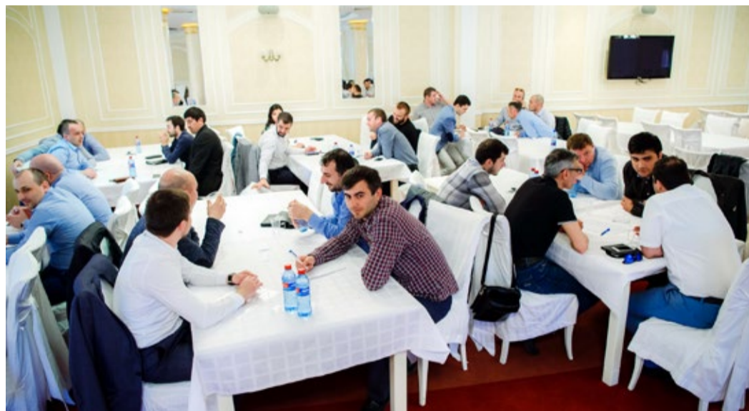
Интеллектуалы в деле

После подведения итогов выяснилось, что тройку лидеров в этой игре поможет сформировать дополнительный вопрос. В зале наступила глубокая тишина. Участники сосредоточились, готовые проявить чудеса эрудиции и отвоевать заветный балл в свою пользу.