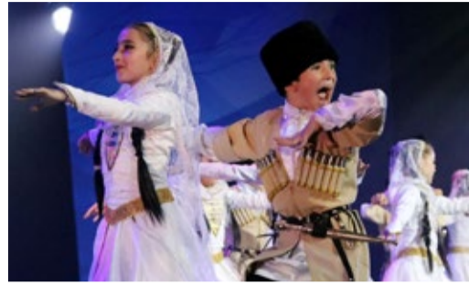
«ФАКЕЛ» – ЭТО БОЛЬШАЯ ГАЗПРОМОВСКАЯ СЕМЬЯ! Подведены итоги корпоративного фестиваля Стр. 4-5