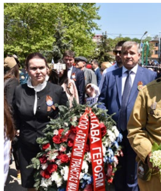
Возложение венка к памятнику Воину-освободителю

После церемонии возложения цветов состоялась акция «Бессмертный полк». Многие из нас ежегодно по собственному жела-