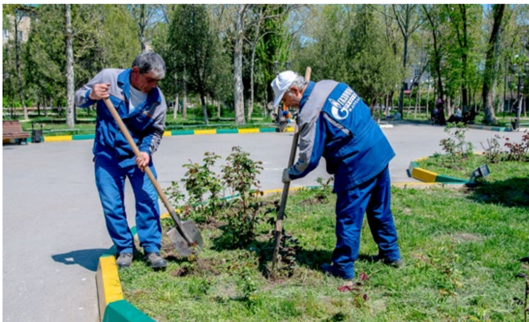
Посадка кустов роз

Любовь к родной стране начинается с любви к природе К.Г. Паустовский