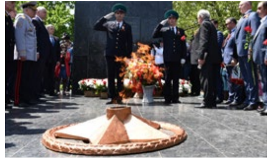
ПОКА ПАМЯТЬ ЖИВА Работники предприятия приняли участие в праздновании Дня Победы Стр. 6