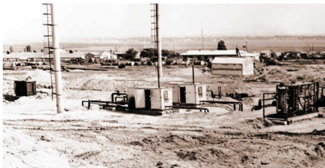
Строительство КС «Избербаи»