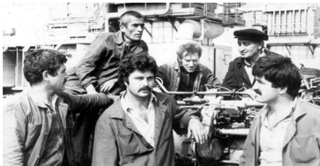
Машинисты технологических установок КС «Избербаи»