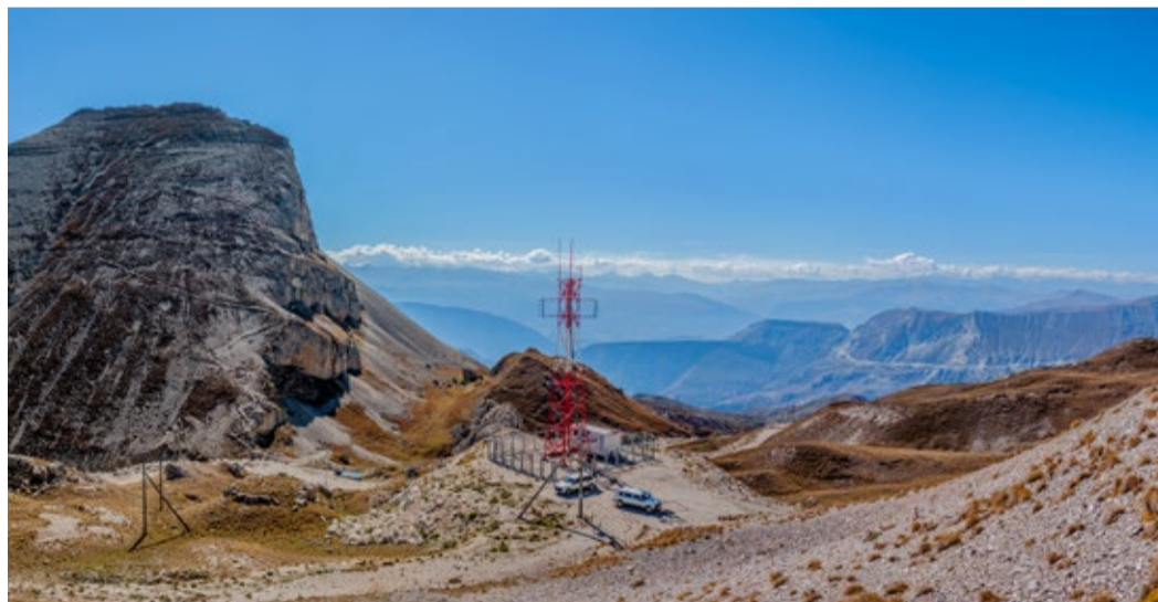
ПРС «Андиийские ворота»