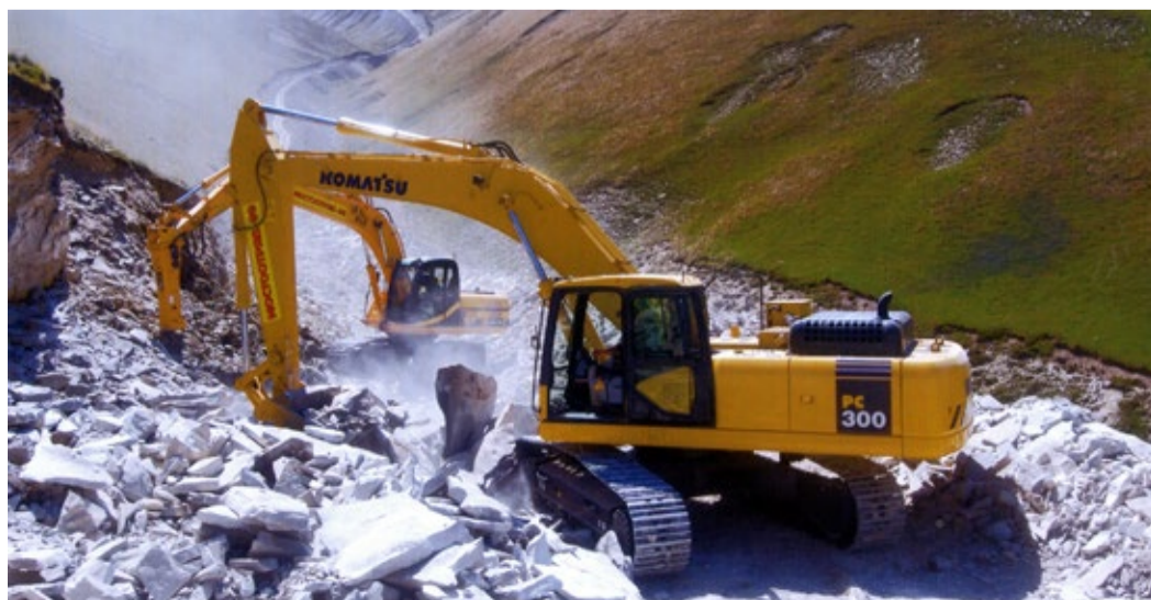
Строительство ГО к с. Ботлих Ботлихского района