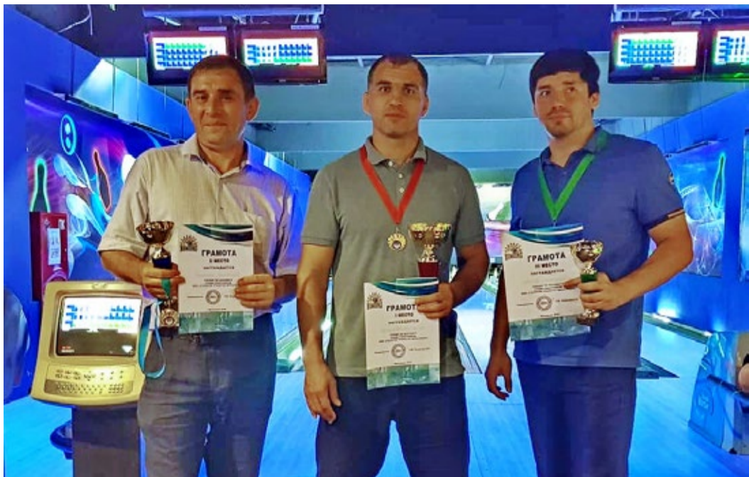
Победители и призеры турнира

В середине июля в Центре семейного отдыха г. Махачкала состоялся турнир по боулингу среди работников ООО «Газпром трансгаз Махачкала», организованный ОППО «Газпром трансгаз Махачкала профсоюз». Он собрал 30 участников из разных подразделений, для которых посвятить несколько часов после работы коллективным соревнованиям показалось увлекательным.