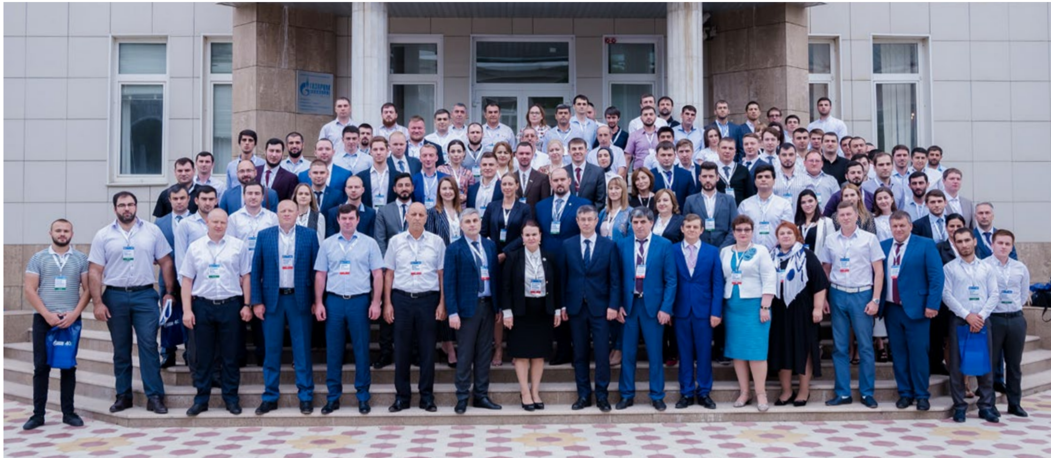
Участники IX научно-практической конференции молодых работников Общества «Магистраль 2019: Инициатива. Развитие. Потенциал»

С 5 по 9 августа на площадке ООО «Газпром трансгаз Махачкала» прошла IX научно-практическая конференция молодых работников «Магистраль 2019: Инициатива. Развитие. Потенциал», организованная совместными усилиями Объединенной первичной профсоюзной организации «Газпром трансгаз Махачкала профсоюз» и Совета молодых ученых и специалистов предприятия.