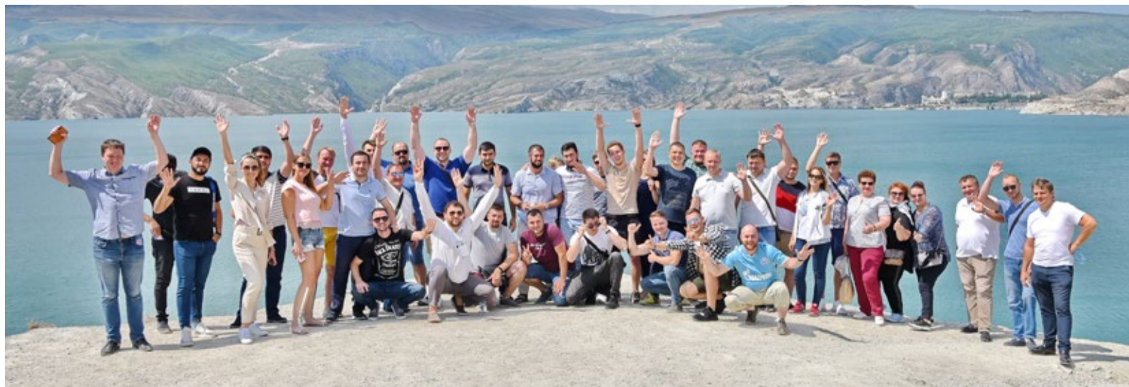
На Сулакском каньоне

– Хочется выразить искреннюю благодарность за высокий уровень организации конференции Совету молодых ученых и специалистов ООО «Газпром трансгаз Махачкала». Ребята поразили по-настоящему теплым и радужным приемом. Конференция прошла на одном дыхании. Все ребята приехали с интересными и актуальными темами, которые прошли отбор на конференцию. Я выступала в секции «Управление предприятием». Эксперты задавали целевые вопросы, которые помогли многим посмотреть на свои работы с новой стороны и, возможно, в последующем их доработать. Подобная конференция, где встречается активная и мыслящая молодежь, бесспорно, способствуют росту корпоративного духа и желанию совершенствоваться в профессиональных компетенциях. Отдельное спасибо за экскурсионный день! Мы побывали на Сулакском каньоне, Чиркейском водохранилище и бархане Сарыкум, насладились незабываемыми видами Дагестана, гостеприимством местных жителей и вкусной едой. Впечатления от поездки останутся надолго, и, надеюсь, что новые знакомства будут способствовать полезному обмену опытом между специалистами дочерних обществ Группы «Газпром».