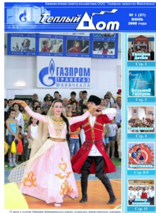
Один из первых номеров «Теплого дома»