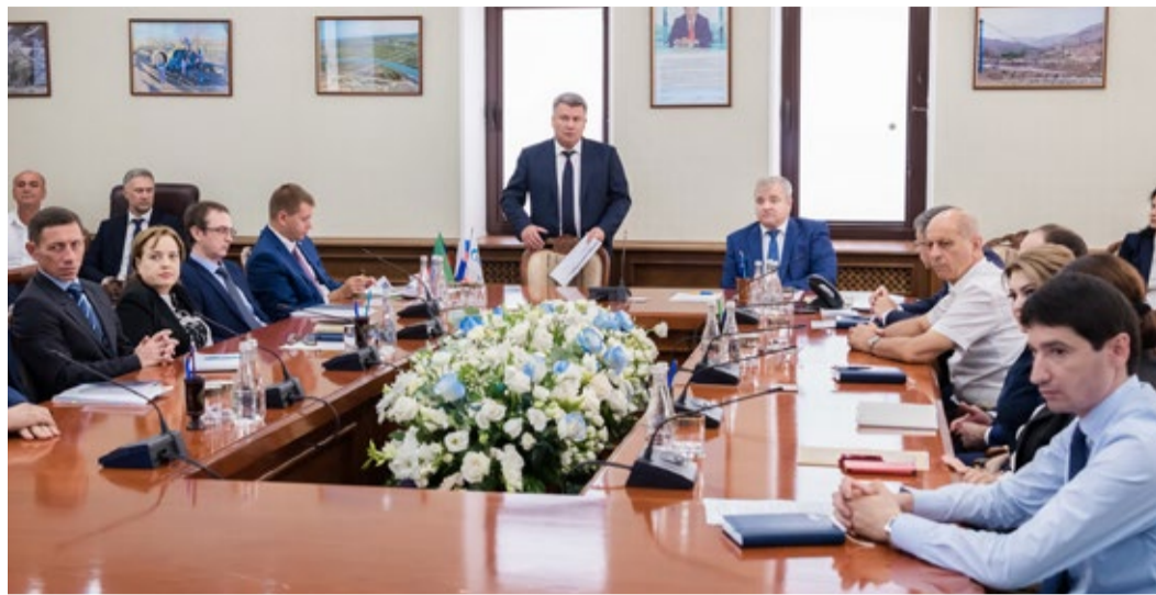
В ходе совещания