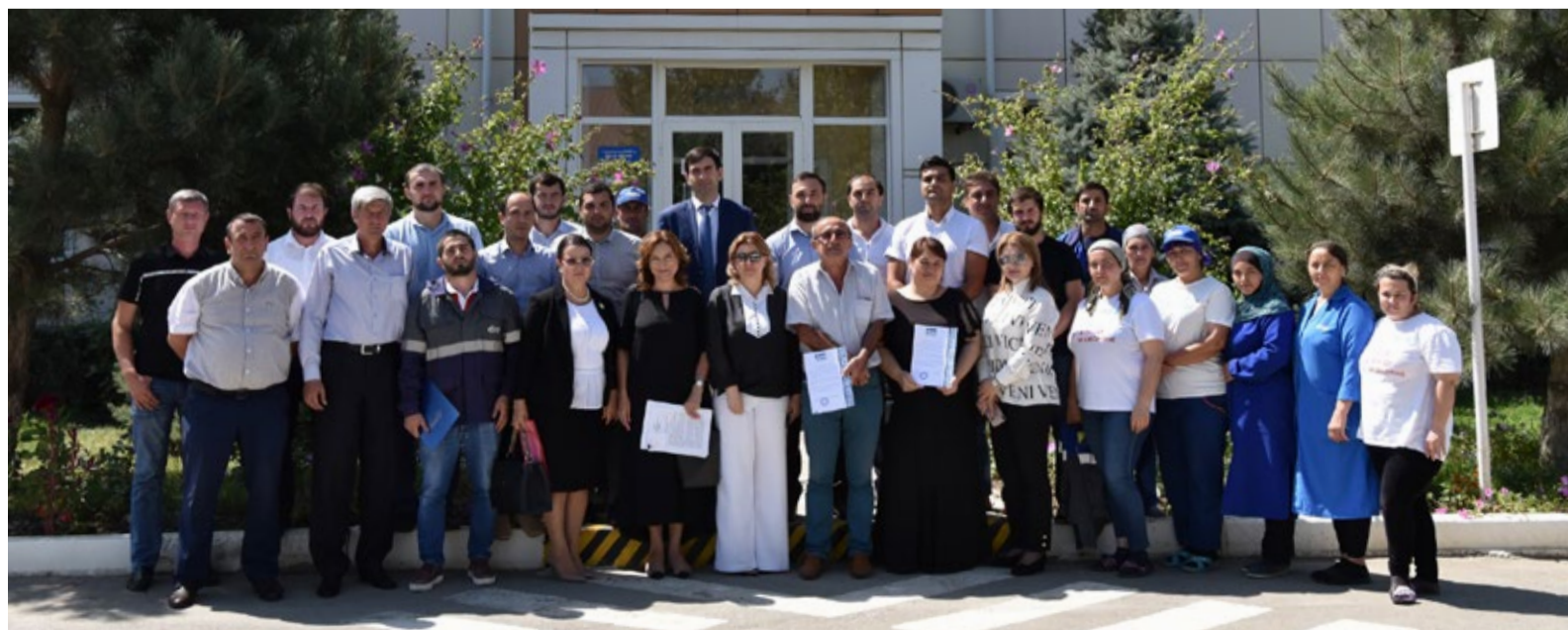
Трудовой коллектив Махачкалинского линейного производственного управления