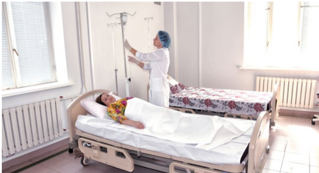
Комфортные палаты стационара

и диагностическое обследование, подбор медикаментозной терапии и оценку его эффективности, восстановительное лечение, восстановление трудоспособности пациента и улучшение качества его жизни. На обследование работника и установление клинического диагноза по стандартам в стационаре отводится до пяти дней, в нашем стационаре, ввиду наличия хорошей диагностической базы и до-