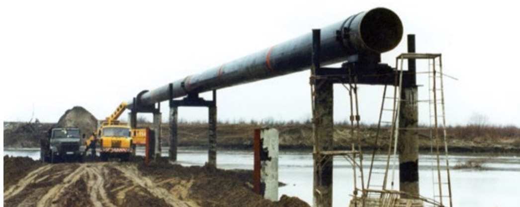
Производство земляных работ по отсыпке проезда для трубоукладчиков

Состояние линейной части магистрального газопровода «Моздок – Казимагомед» на территории Чеченской Республики значительно ухудшилось, часть газового оборудования была просто растащена. Газоснабжение потре-