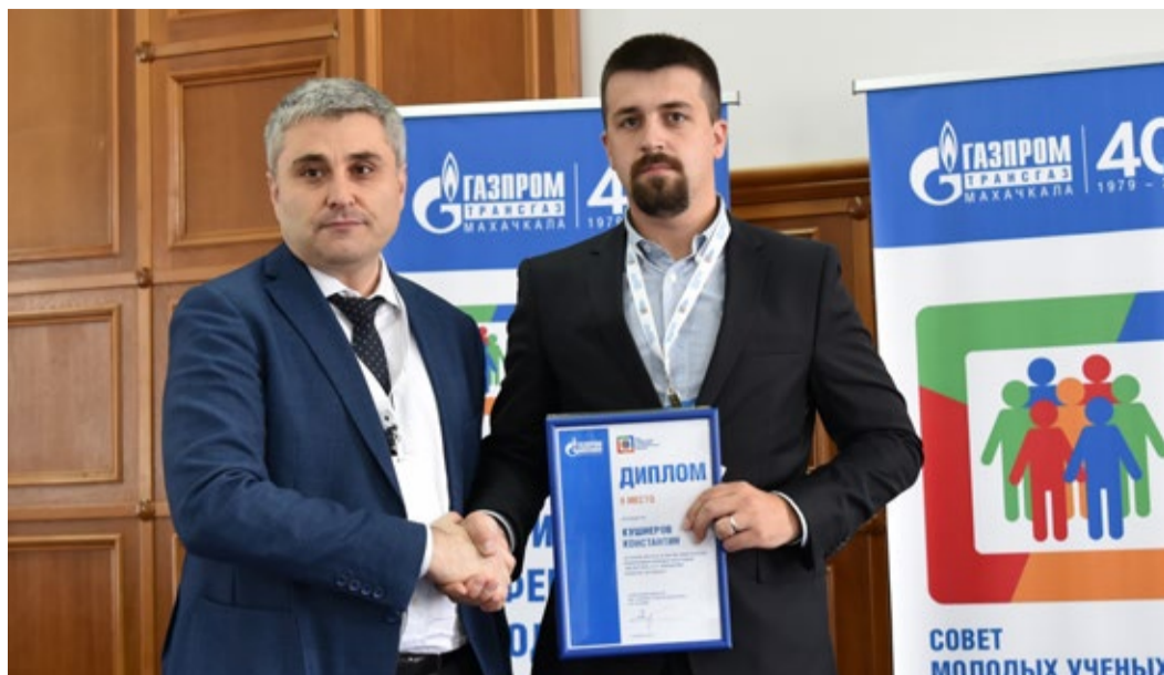
Церемония награждения победителей