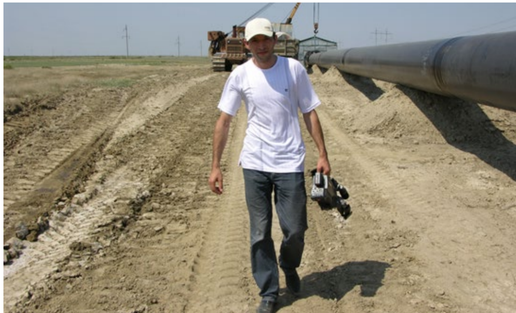
В гуще событий

М ир вокруг нас стремительно меняется, ускоряется – новые впечатления, эмоции, знакомства, путешествия, события и многое-многое другое. Ежедневно сотни миллионов фотографий путешествуют в цифровом пространстве по всему миру, и лишь немногие из них имеют значение для каждого из нас, и мы их бережно храним.