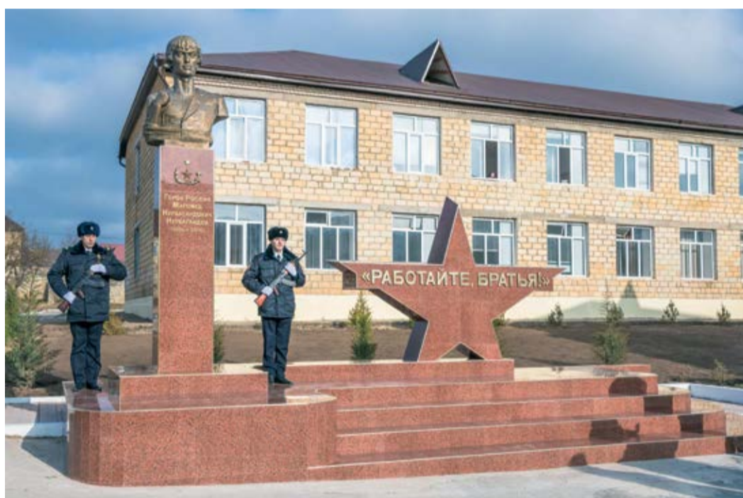
В рамках благотворительной деятельности открыт памятник Герою России Магомеду Нурбагандову