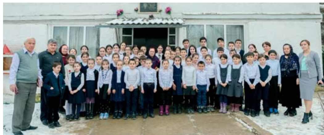
Педагогический коллектив и ученики Ахмедкентской средней школы