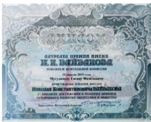
Работники ООО «Газпром трансгаз Махачкала» удостоены Общественной премии им. Н.К. Байбакова