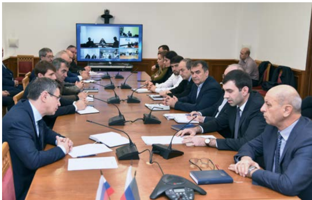
В ходе совещания