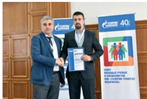
В Махачкале прошла IX научно-практическая конференция молодых работников ООО «Газпром трансгаз Махачкала»