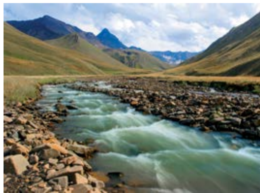
Долина реки Арцалинех