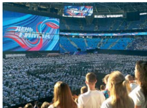
Делегация Общества приняла участие во Всероссийской акции «Гимн России»