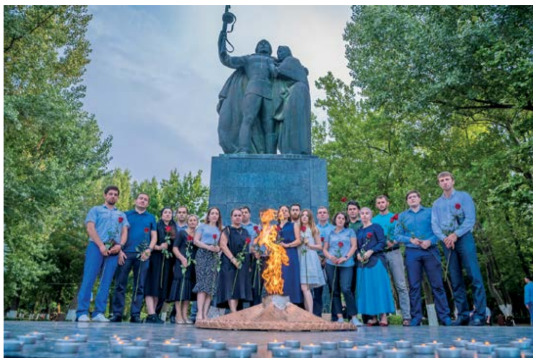
Совет молодых ученых и специалистов совместно с ОППО «Газпром трансгаз Махачкала профсоюз» организовал акцию «Свеча памяти»