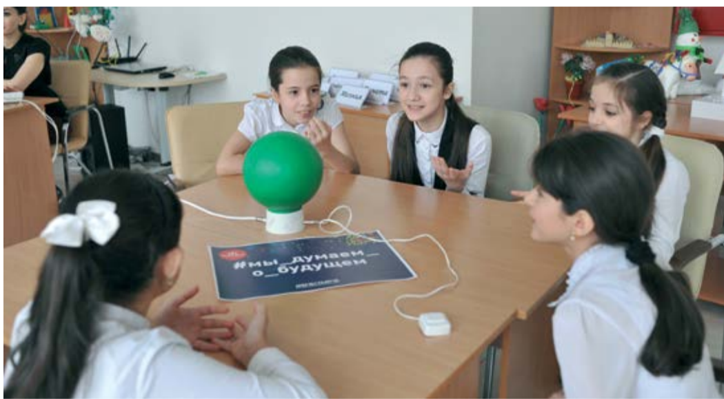
Бурное обсуждение очередной версии ответа

В конце декабря в Республиканском центре образования города Каспийска в рамках Всероссийского фестиваля энергосбережения и экологии #ВместеЯрче состоялась интеллектуальная игра для школьников. Мероприятие организовано совместными усилиями Группы окружающей среды и энергосбережения предприятия, Объединенной первичной профсоюзной организации «Газпром трансгаз Махачкала профсоюз», а также Совета молодых ученых и специалистов. Основным его девизом было «Сбереги ресурсы, сохрани планету!».