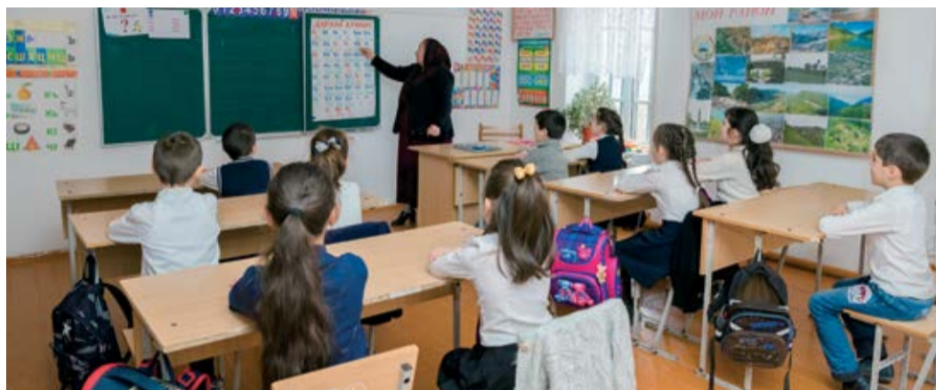
На уроке родного языка