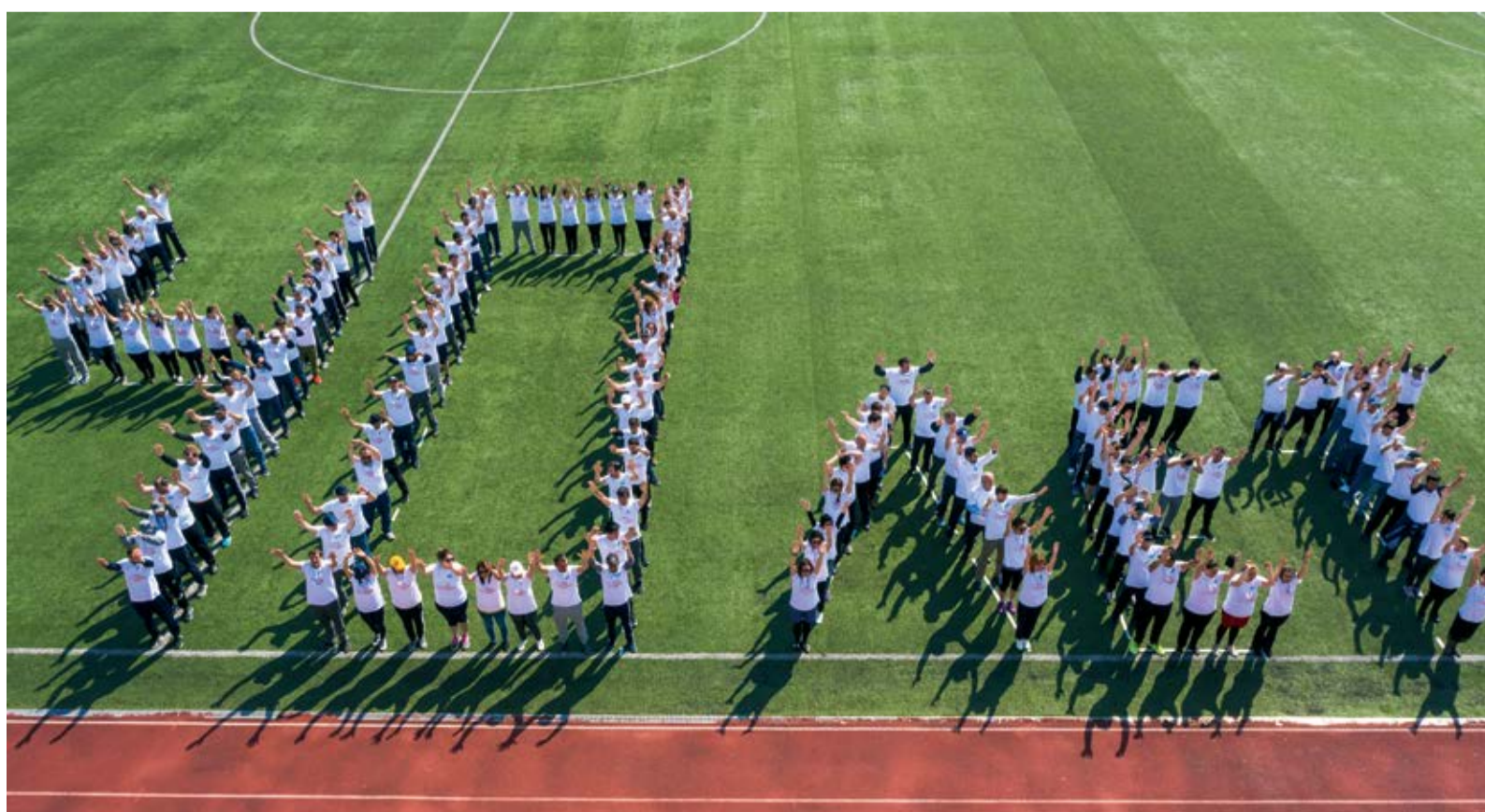
В целях пропаганды здорового образа жизни в Обществе организован ряд спортивно-оздоровительных мероприятий