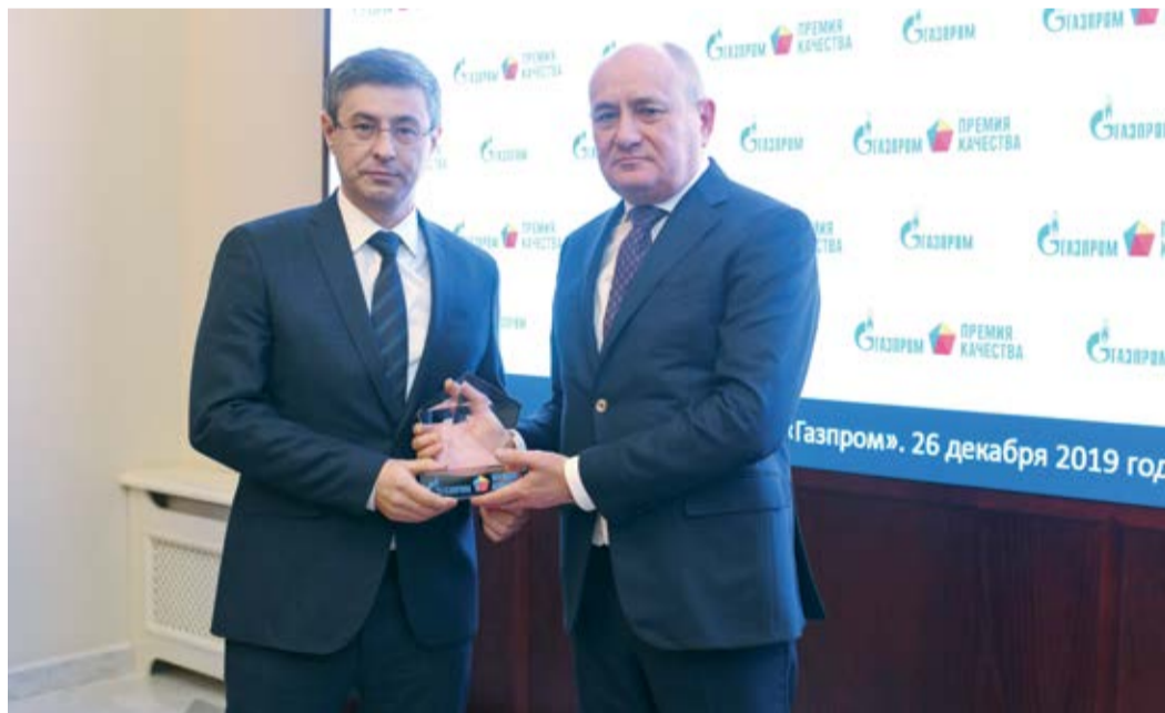
Церемония вручения премии

онного аудита ежегодно должен проводиться и инспекционный контроль систем менеджмента качества. По его результатам управление качеством на предприятии ежегодно признается успешным.