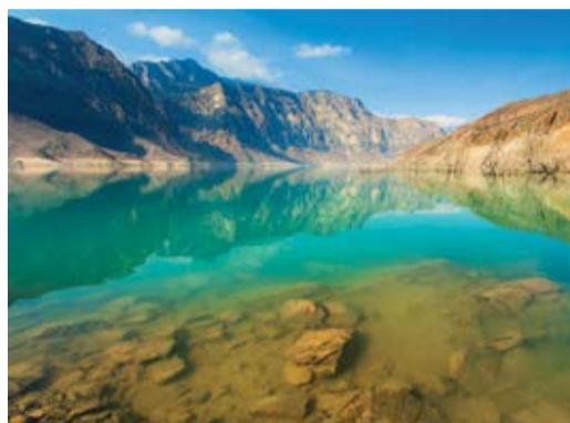
Водохранилище Ирганайской ГЭС