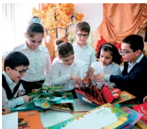
Общество реализовало благотворительную акцию «Книжки в подарок»