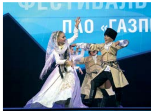
Детский хореографический ансамбль «Тарки-Тау» – обладатель первого места в корпоративном фестивале «Факел»