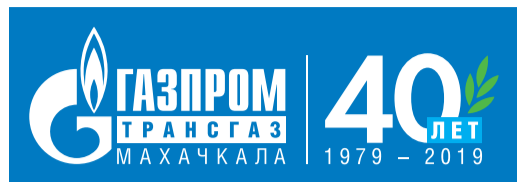
ООО «Газпром трансгаз Махачкала» отметило 40 лет трудовой деятельности