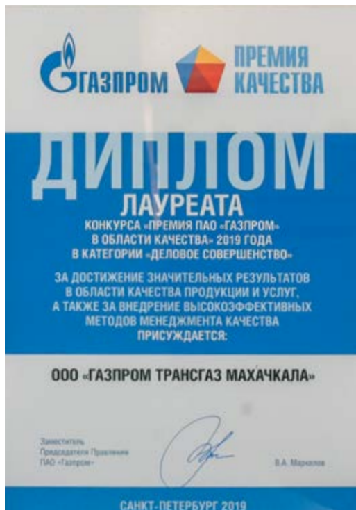
Предприятие – лауреат конкурса ПАО «Газпром» в области качества