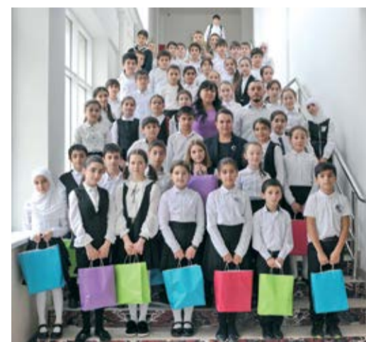
Юные участники викторины