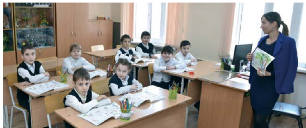
На уроке речевой практики