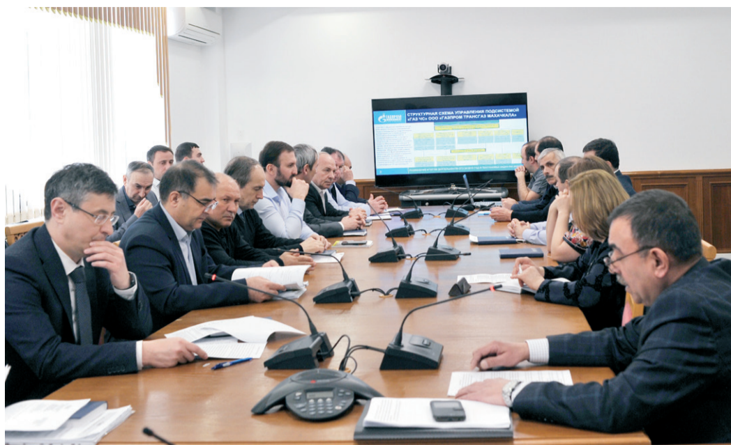
Участники селекторного совещания

В целях совершенствования навыков координационных органов системы гражданс-