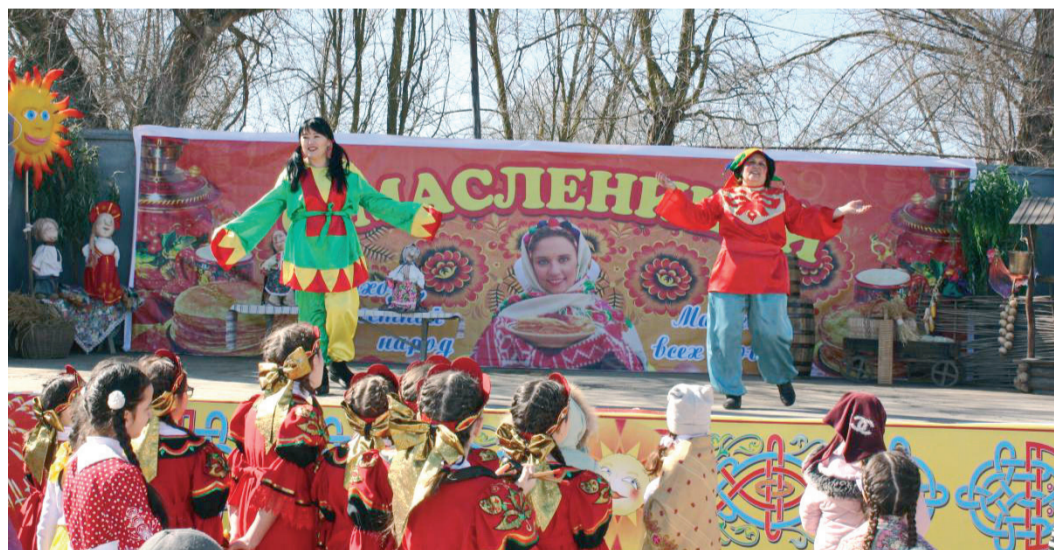
Шуточные конкурсы для гостей