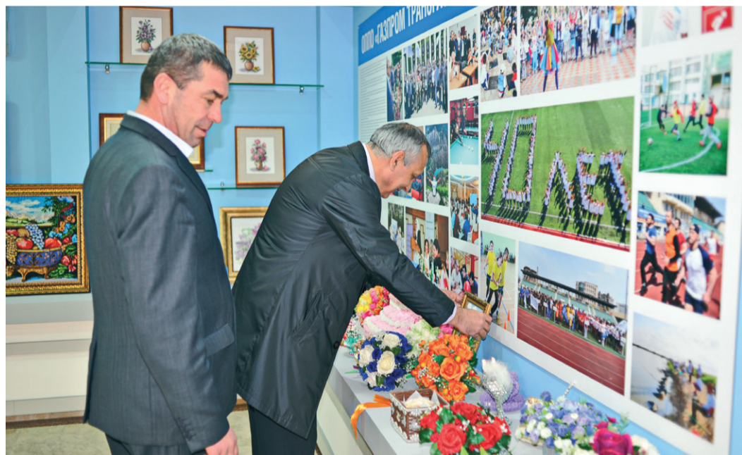
Первые посетители выставки

В конце января в Музее истории развития ООО «Газпром трансгаз Махачкала» открылась выставка творческих работ наших сотрудников «ТриДэ – Дом, Душа, Досуг». Она была подготовлена и проведена Службой по связям с общественностью и СМИ в рамках работы Музея истории развития ООО «Газпром трансгаз Махачкала» в 2020 году.