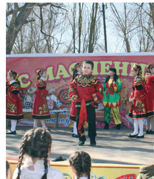
Юный воспитанник школы искусств