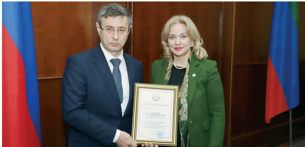
Церемония вручения награды

21 февраля 2020 года работники Общества посетили Дагестанский государственный театр кукол – благодаря финансовой поддержке ООО «Газпром трансгаз Махачкала» учреждение культуры закупило и установило оборудование для оснащения хореографической студии: стационарные и мобильные балетные станки, гимнастические маты, гардеробную систему, музыкальный центр, зеркала для зала, рулонные шторы, сплит-си-