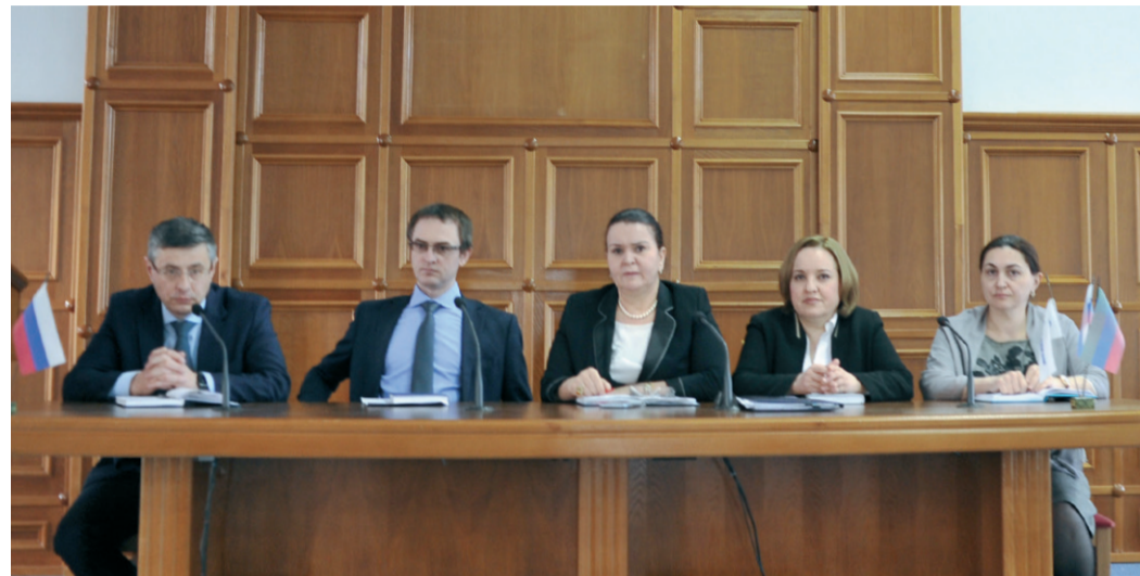
Члены президиума собрания