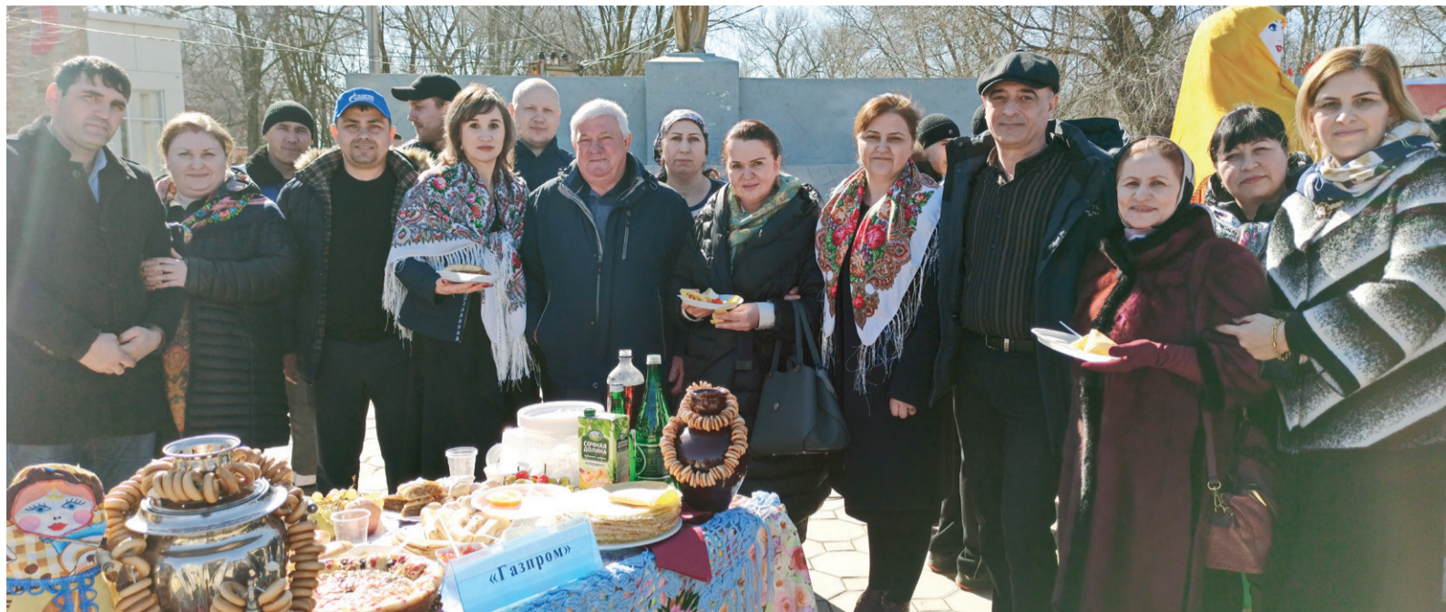
Праздничное чаепитие с бубликами и пирогами

М ы живем в многонациональной республике, где с детства воспитываются терпимость и уважение друг к другу, где праздники не разделяются по национальным или религиозным признакам – христиане обязательно поздравляют мусульман с Курбан- или Ураза-Байрамом, мусульмане ходят в гости к христианам на Пасху и Рождество. Есть еще один праздник, объединяющий людей в их стремлении к свету и добру – Масленица. Это один из самых веселых праздников в году, который широко отмечается по всей России.