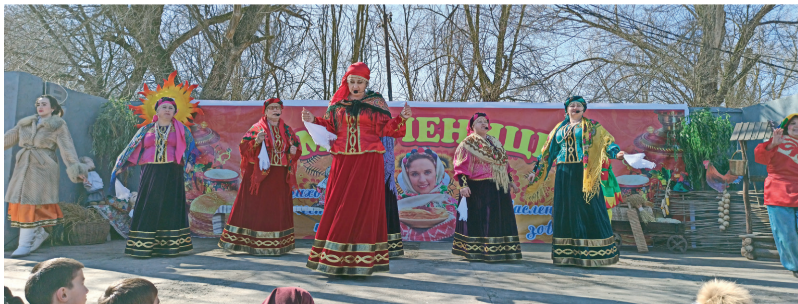
Народные песни – неотъемлемая часть праздника