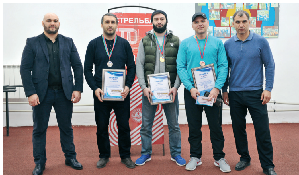
Победители и призеры турнира