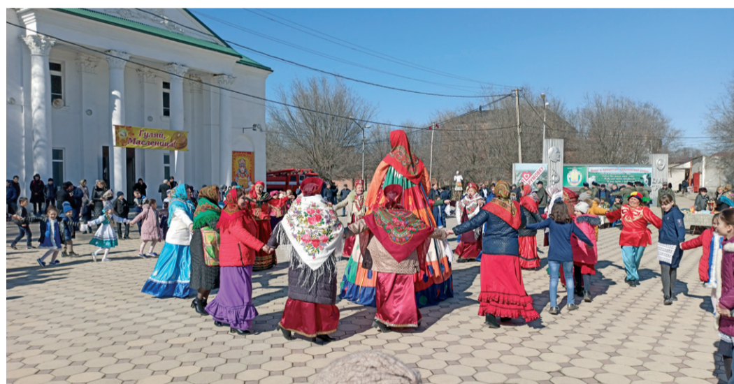
Веселый хоровод вокруг чучела Масленицы