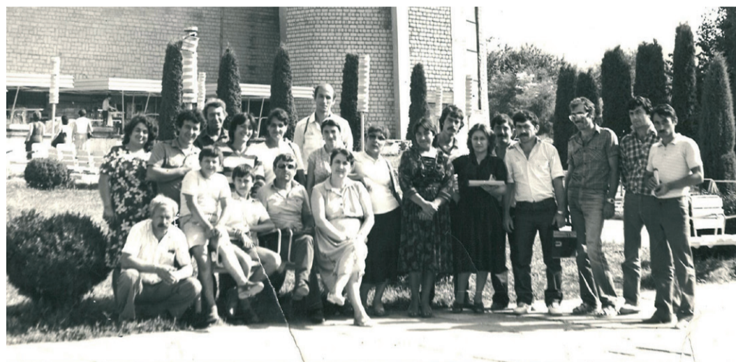
Коллектив работников Избербашского ЛПУМГ на отдыхе

В нашей рубрике под условным названием «Кому за 30» мы продолжаем публиковать воспоминания и рассказы тех работников, кто проработал на нашем предприятии 30 и более лет. Благодаря их воспоминаниям мы можем почувствовать атмосферу времени, оценить огромные усилия энтузиастов, которые поднимали газовую промышленность республики и страны.