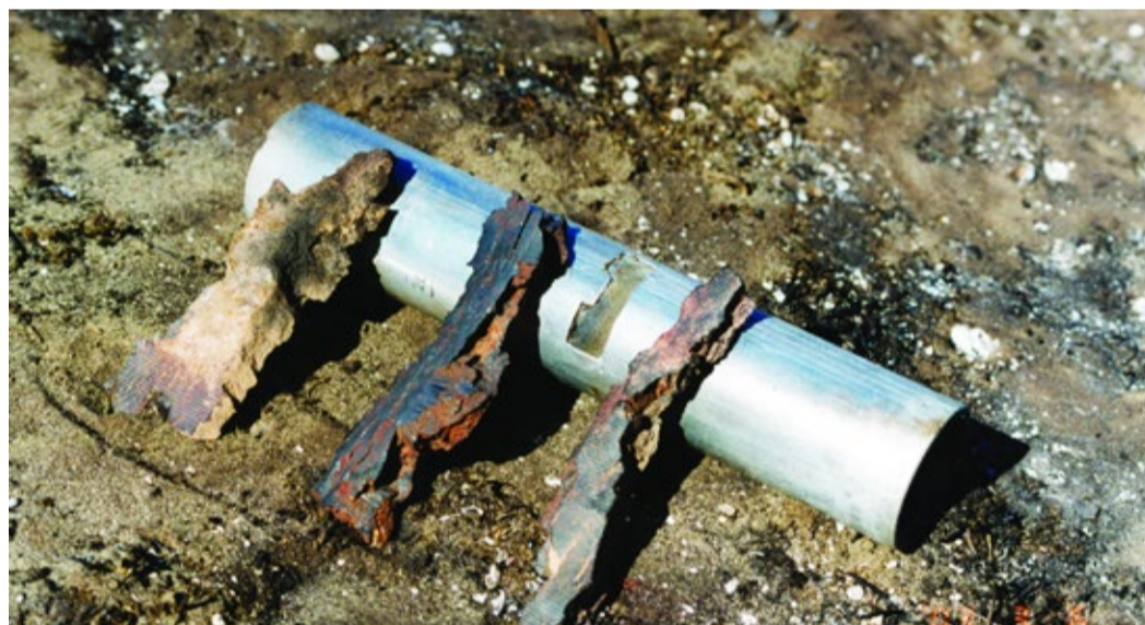
Осколки снарядов после нападения боевиков на объекты ПЭУ «Новолакрайгаз»

Ее выводы окончательно убедили руководство страны в возможности безопасной эксплу-