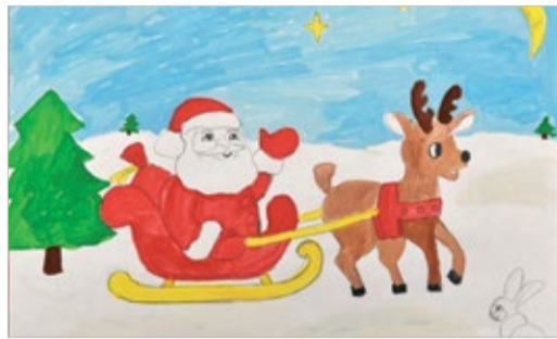
ВСЕХ НА СВЕТЕ ПАП И МАМ САМИ МЫ ПОЗДРАВИМ!

Новогодние пожелания от детей работников Стр. 4-5