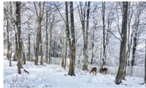
В ГОСТЯХ У ПЯТНИСТЫХ ОЛЕНЕЙ

Новые знакомства с красивейшими местами нашего региона Стр. 6