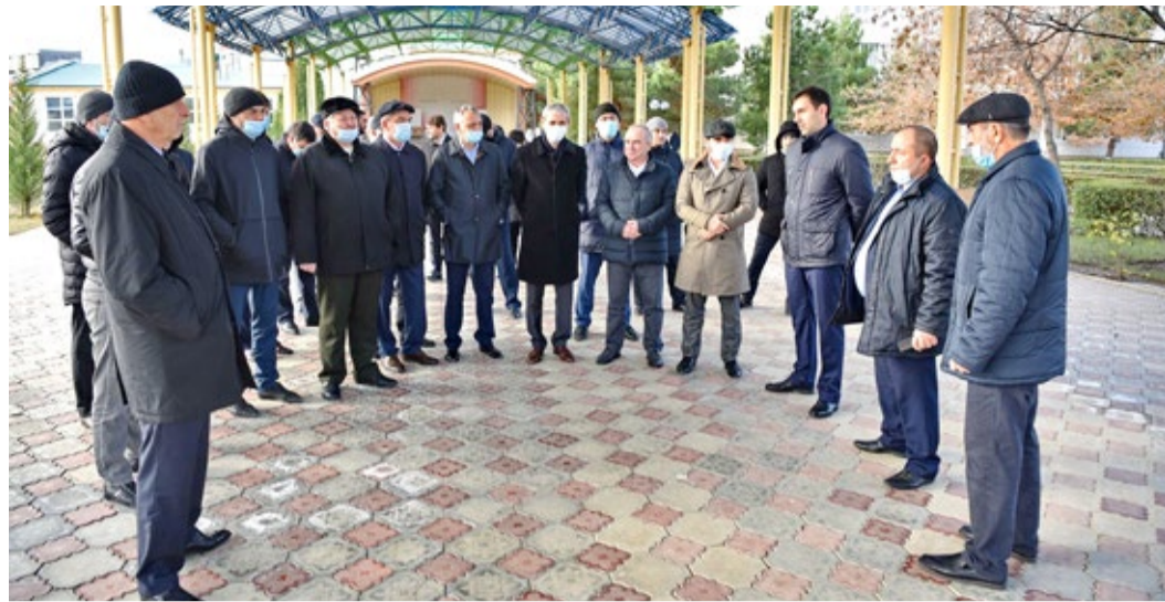
Разбор тренировочного занятия с коллегами

В начале декабря в ООО «Газпром трансгаз Махачкала» проведена противопожарная тренировка по эвакуации персонала и тушению условного пожара. Участниками мероприятия стали работники подразделений предприятия, располагающихся в производственном здании АУП-1, и дежурные охранники ООО ЧОО «Альфа».