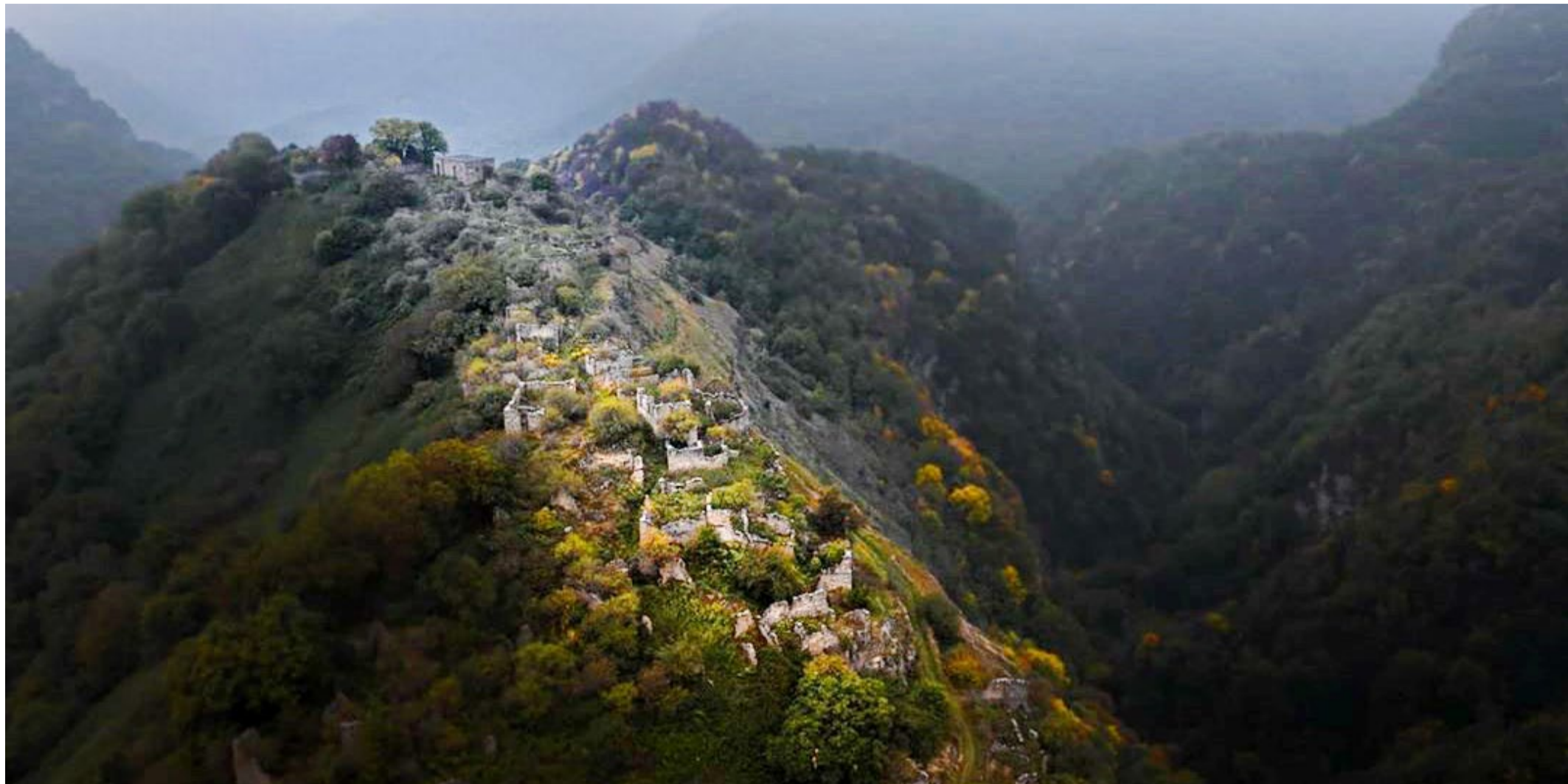
Село Кала-Корейш.

Рубрика «Приезжайте в Дагестан» продолжает знакомить вас с незабываемыми достопримечательностями нашей республики. Несмотря на предновогоднюю суету и налетевшие морозные ветры, вы можете переноситься в красивейшие места, коими богат наш родной край, читая постоянную рубрику в ежемесячном корпоративном издании «Теплый дом». Вечером после работы, сидя в уютном кресле, укутавшись в плед и попивая ароматный чай с горными травами, откройте нашу газету и путешествуйте с нами.