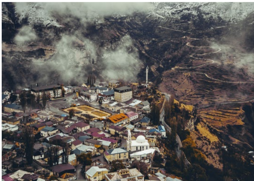
Село Гуниб.

В центре ротонды – серый валун, тот самый, на котором сидел князь Барятинский в момент переговоров с Шамилем. Этот сюжет запечатлен на множестве картин. Камень – исторически подлинный, а вот беседке не повезло. Ротонда, выстроенная в 1893 году, украшенная двуглавым орлом и чугунной плитой с надписью «На сем камне восседал генерал-фельдмаршал князь Барятинский, принимая плененного Шамиля 25 августа 1859 года», пережила