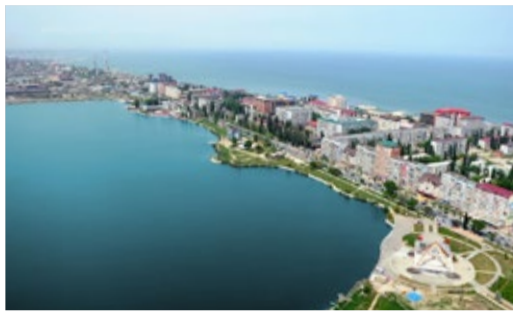
ПОДПИСАНА ПРОГРАММА ГАЗИФИКАЦИИ И ГАЗОСНАБЖЕНИЯ ДАГЕСТАНА