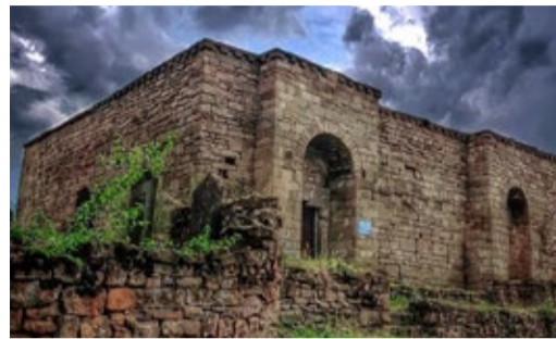
ПРИЕЗЖАЙТЕ В ДАГЕСТАН!

Новогодние пожелания от детей работников Стр. 4-5