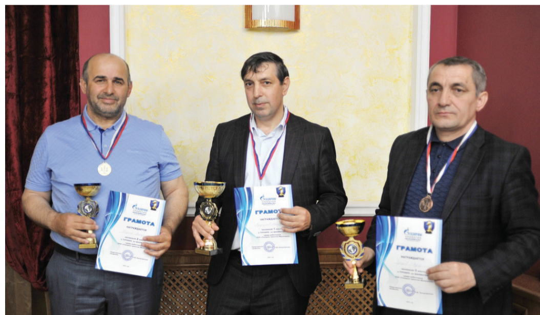
Победители и призеры турнира по шахматам