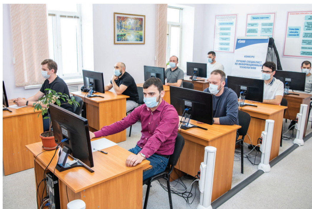
Инженеры-электроника на экзамене