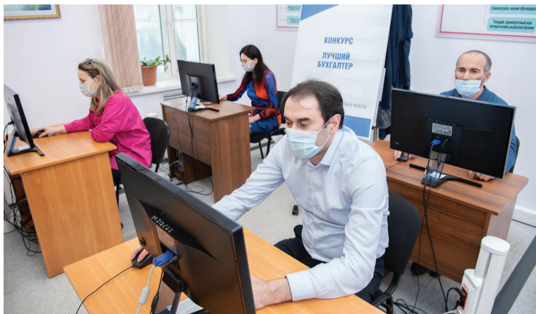
Теоретическая часть конкурса

Среди основных критериев оценки знаний были не только правильность ответов на тестовые вопросы, но и скорость выполнения заданий. В случае, если несколько участников конкурса наберут одинаковое количество баллов, итог будет подводиться в зависимости от того, кто быстрее справился с поставленной задачей.