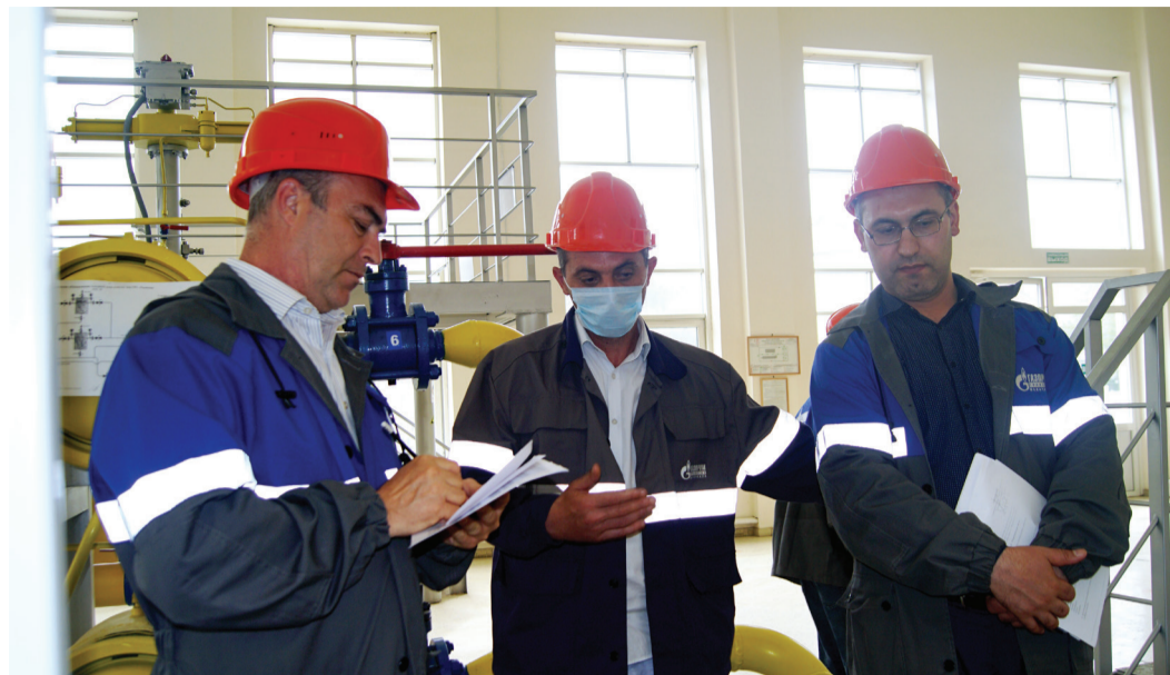
Процедура оценки работ конкурсантов

18 мая на базе Учебно-производственного центра (УПЦ) состоялся очередной конкурс профессионального мастерства на звание «Лучший оператор технологических установок ООО „Газпром трансгаз Махачкала» – 2021».