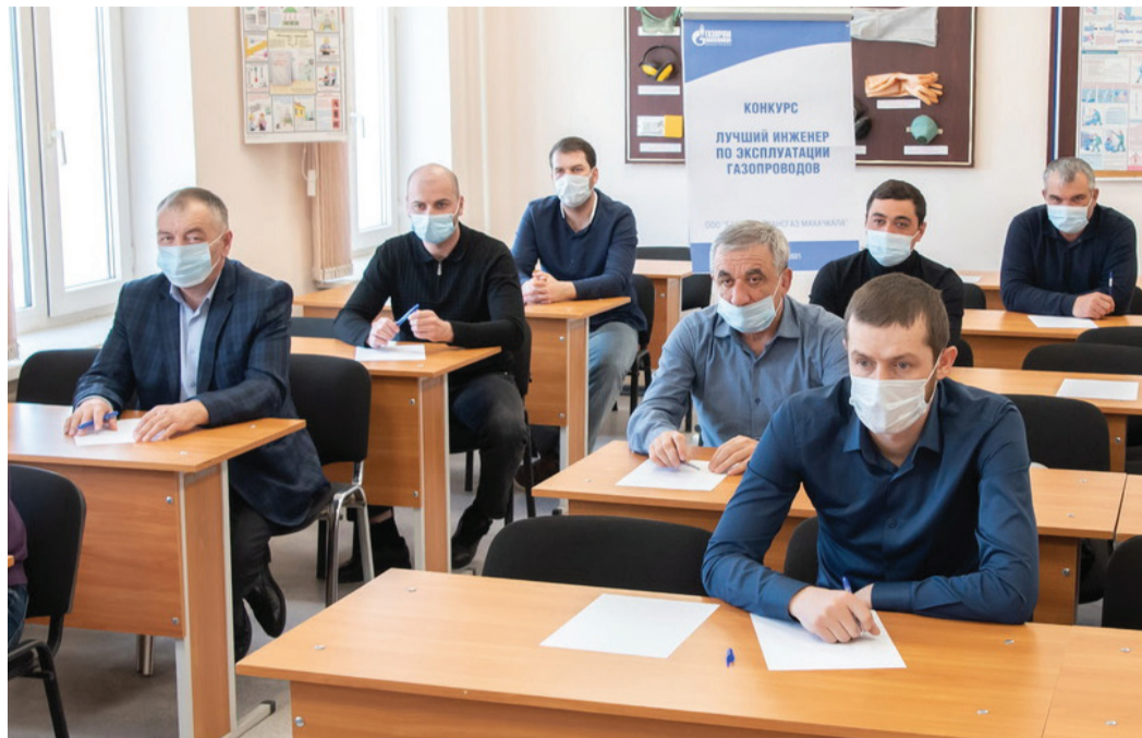
К экзамену – готовы!