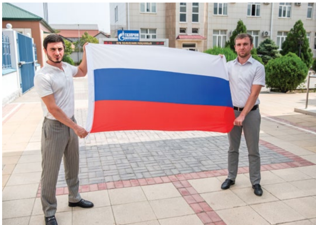
Молодые работники Общества развернули российский флаг

Ежегодно 22 августа в России отмечается День Государственного флага Российской Федерации, установленный на основании Указа Президента РФ № 1714 от 20 августа 1994 года.