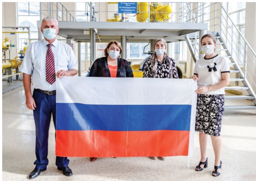
Коллектив Учебно-производственного центра с триколом