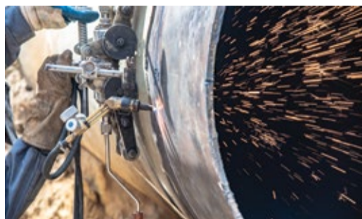
КОМПЛЕКСНЫЕ ОГНЕВЫЕ РАБОТЫ НА ГО «БАБАЮРТ» И «НОВО-ГАГАТЛИ»

Готовимся к осенне-зимнему периоду Стр. 2