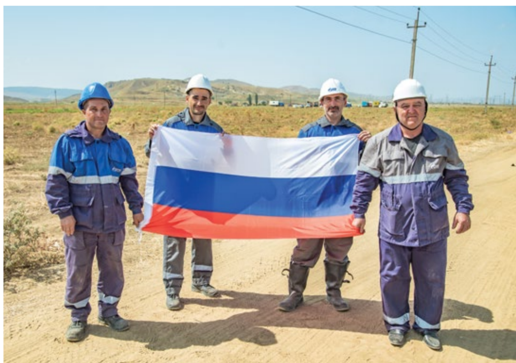
Флаг побывал на огневых работах