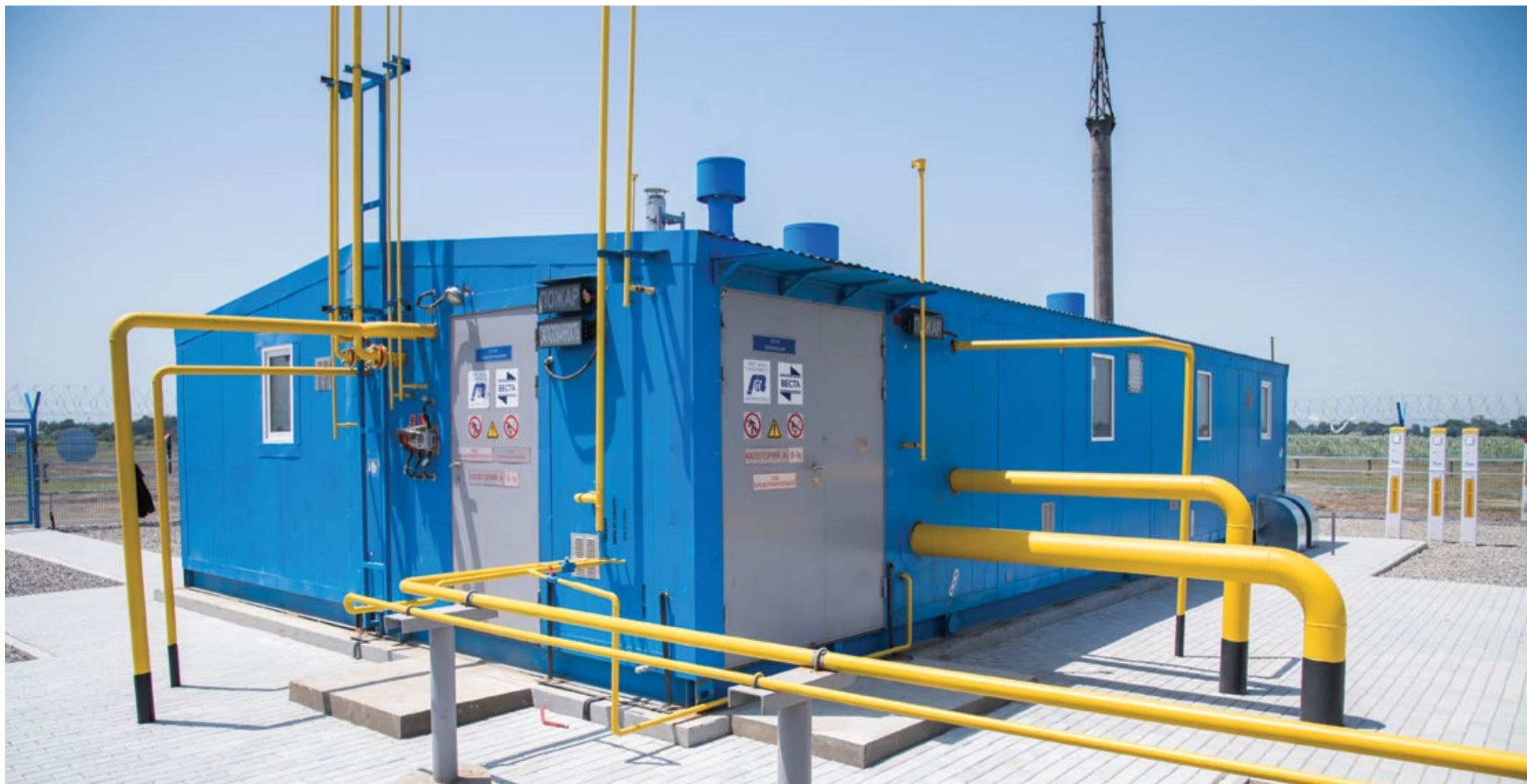
Газораспределительная станция «Мужукай»

В текущем году для бесперебойного газоснабжения потребителей в предстоящий осенне-зимний период планируется выполнить замену участков газопроводов общей протяженностью 25 км, капитальный ремонт двух подводных переходов газопроводов. В планах также капитальный ремонт и техническое обслуживание газораспределительных станций, диагностические обследования и экспертиза промышленной безопасности газопроводов общей протяженностью 407 км.