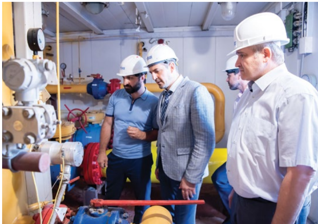
Министр энергетики и ЖКХ РД Ризван Мурадов знакомится с работой АГРС «Махачкала – Северная»

– Одна из них – реконструкция участка магистрального газопровода «Моздок – Казима-