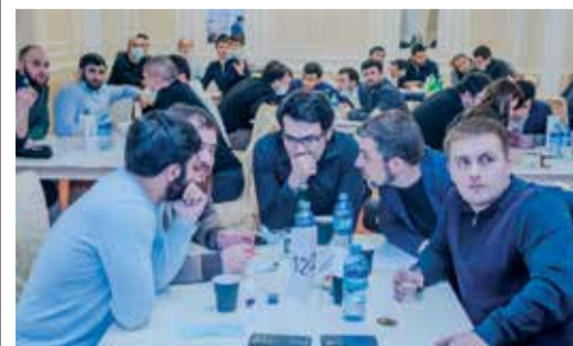
БЛЕСНУЛИ ЭРУДИЦИЕЙ И ИНТЕЛЛЕКТОМ Молодые работники предприятия сыграли в игру «Узнать за 60 секунд» Стр. 5