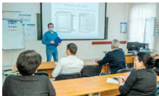
СОВРЕМЕННЫЕ ИНСТРУМЕНТЫ В ДЕЛЕ Двухдневный курс обучения прошли специалисты предприятия Стр. 2