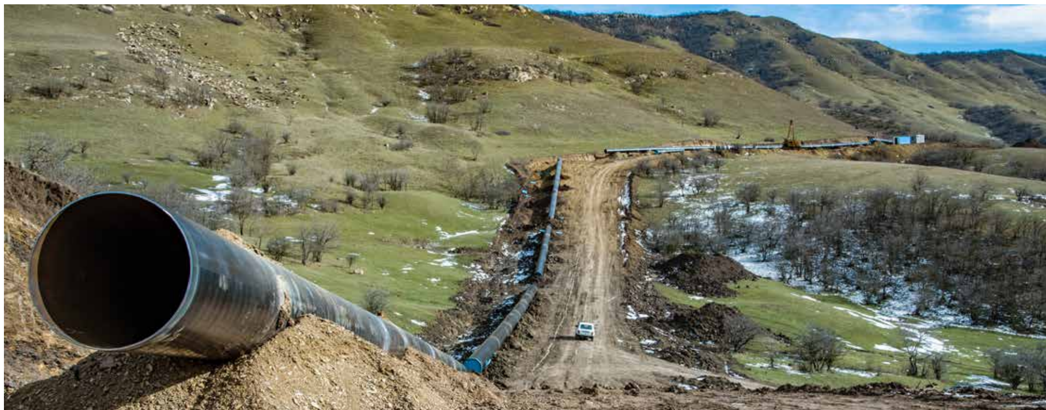
Реконструкция магистрального газопровода «Моздок – Казимагомед» на участке 600-610 км