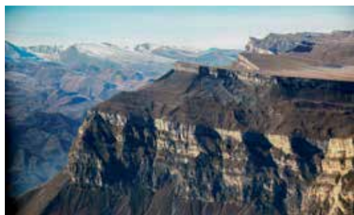
ПРОФЕССИОНАЛ – ЭТО ЗВУЧИТ ГОРДО! «Лучший фотограф» Корпоративного конкурса ПАО «Газпром» Стр. 3