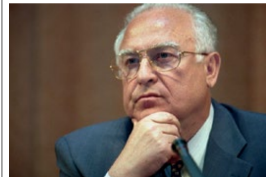
Виктор Черномырдин. 2006 год.

9 апреля 1938 года родился Виктор Степанович Черномырдин – один из значимых государственных деятелей СССР и РФ, полномочный посол РФ на Украине, политик, стоявший у истоков «Газпрома».