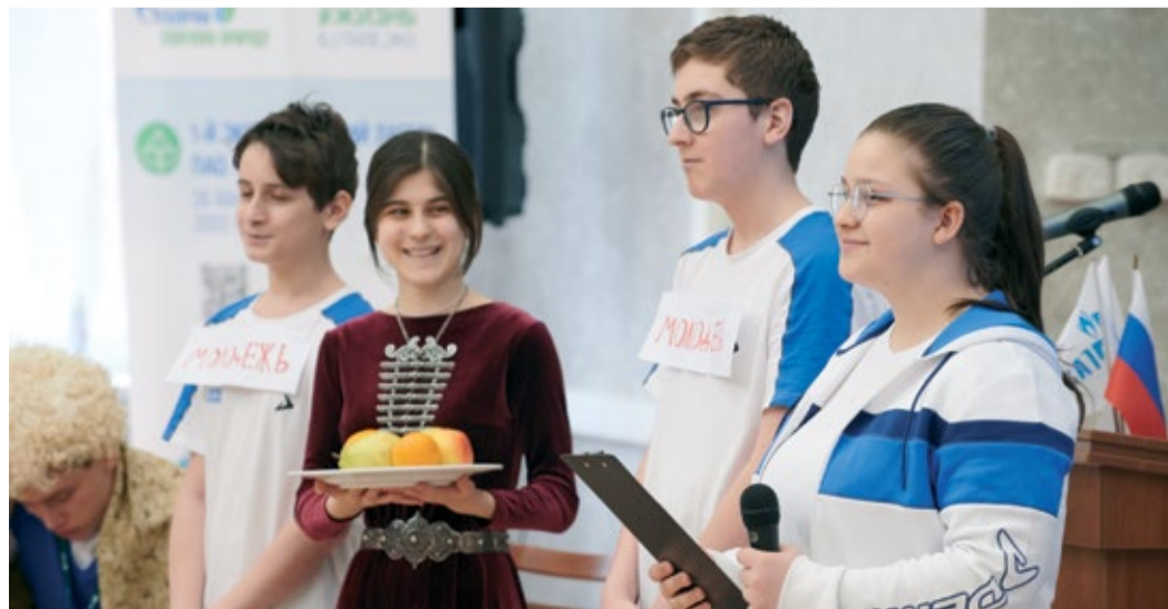
Презентация проекта команды Общества