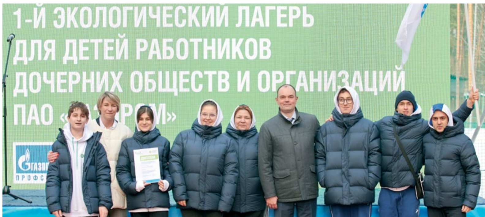
Во время церемонии награждения команды ООО «Газпром трансгаз Махачкала»

За время, проведенное в лагере, дети узнали о пользе газомоторного топлива, решали экологические задачи, повышали навыки самоорганизации и формировали новые экопривычки, которые, надеюсь, прочно войдут в их повседневную жизнь. Я уверен, что каждый из участников получил для себя ответы на интересующие вопросы и почву для размышлений.