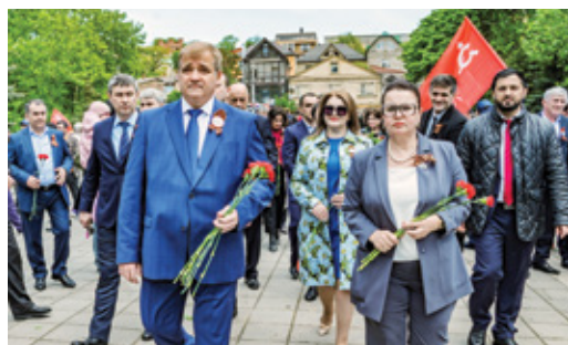
НИКТО НЕ ЗАБЫТ, НИЧТО НЕ ЗАБЫТО... В День Победы коллектив Общества возложил венок к Вечному огню Стр. 4