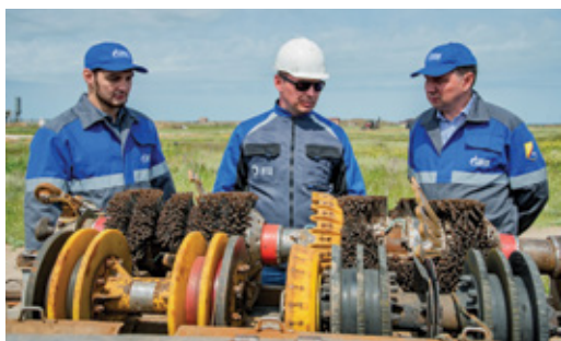
ЦЕЛЬ – ВЫЯВИТЬ СКРЫТЫЕ ДЕФЕКТЫ Проведена внутритрубная дефектоскопия МГ «Каспийск-Ачи-Су» Стр. 2