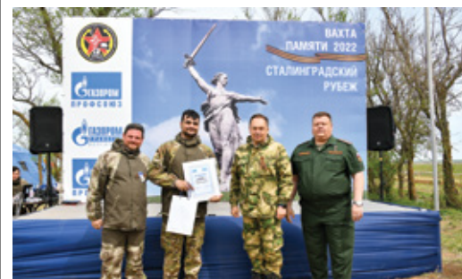
«ВАХТА ПАМЯТИ – 2022. СТАЛИНГРАДСКИЙ РУБЕЖ» Об участии в поисковой работе Стр. 7