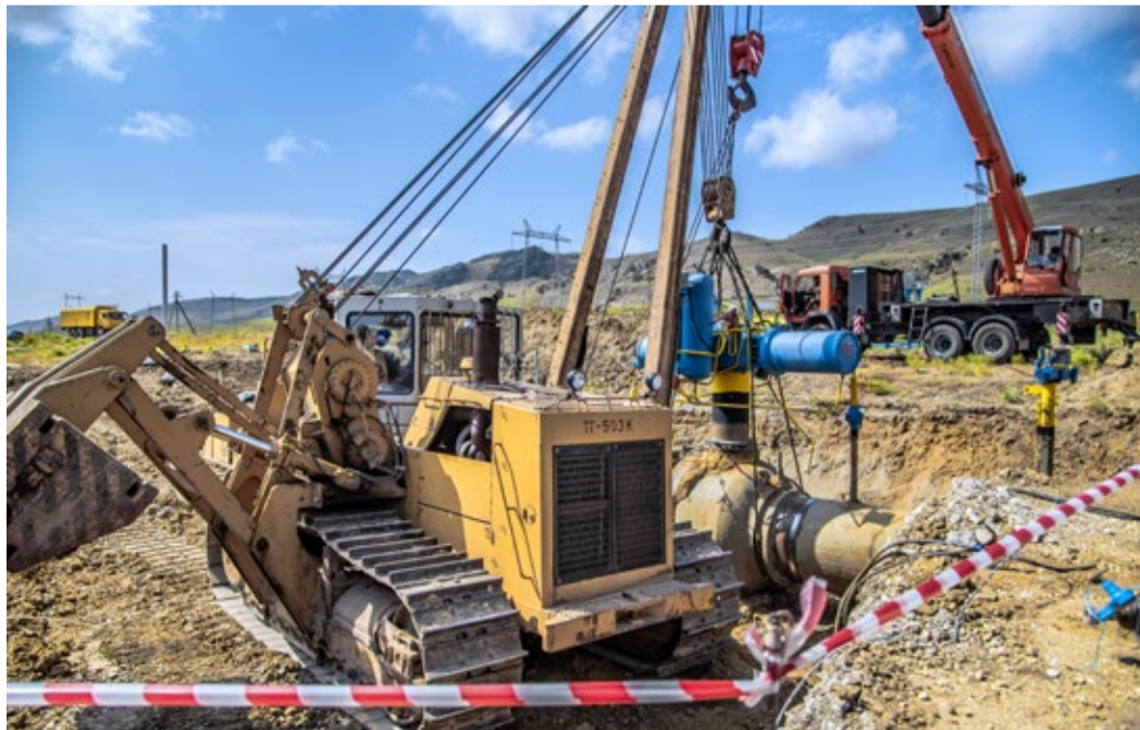
Огневые замена крана 565 585 Махачкала-Избербаи ЛПУМГ 2021-2462

Искренне желаю всем работникам управления новых профессиональных достижений, амбициозных проектов и реализации всего задуманного!