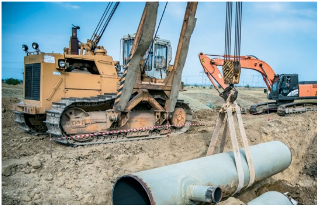
Огневые работы по подключению капитально отремонтированного участка ГО «Леваши» к МГ «Моздок – Казимагомед» на 567 км

В период с 19 по 21 июля на межкрановом участке 565–585 км МГ «Моздок – Казимагомед» ООО «Газпром трансгаз Махачкала» провело комплексные огневые работы с целью подключения к магистральному газопроводу капитально отремонтированного участка ГО «Леваши» протяженно-