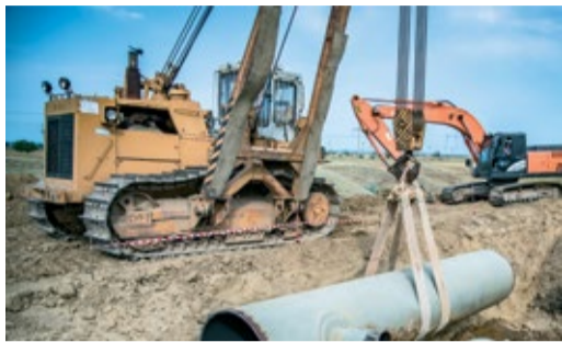
ГО «ЛЕВАШИ» ПОДКЛЮЧЕН ДОСРОЧНО! Огневые работы по подключению капитально отремонтированного участка Стр. 2