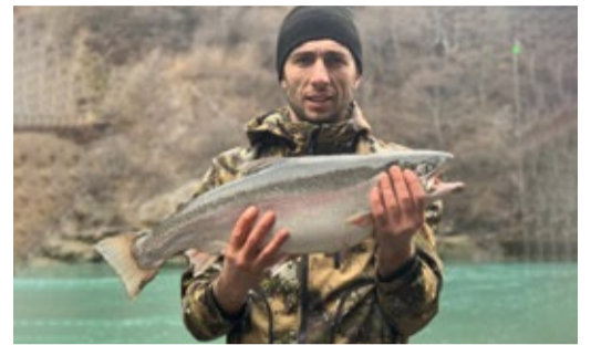
РЫБАЛКА – ДЕЛО КЛЕВОЕ! Делу - время, а потехе - час. Об интересных увлечениях наших коллег Стр. 7