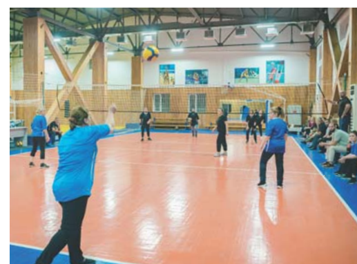
Игра команд "Сулак" и "Центр"