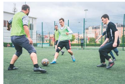
Игра команд "Север" и "Центр"