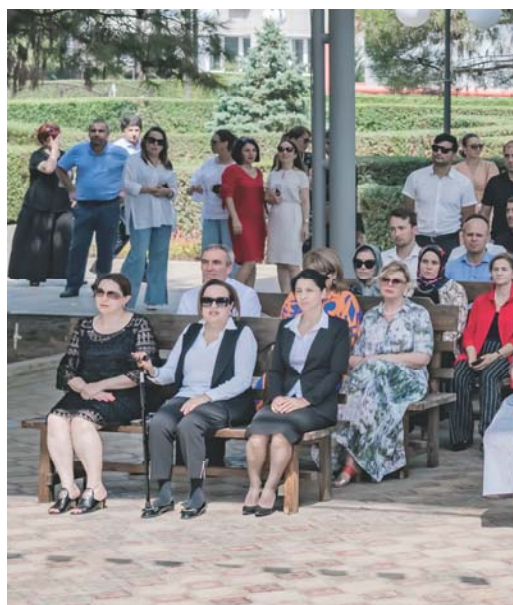
Работники ООО «Газпром трансгаз Махачкала» на праздничном мероприятии «О доблести, о подвигах, о газе»

ООО «Газпром трансгаз Махачкала» уделяет большое внимание социальной защищенности своих работников и пенсионеров. Затраты на социальные льготы, гарантии и компенсации в первом полугодии текущего года составили более 115 миллионов рублей.