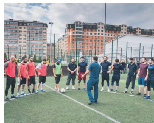
Перед игрой за I и II место