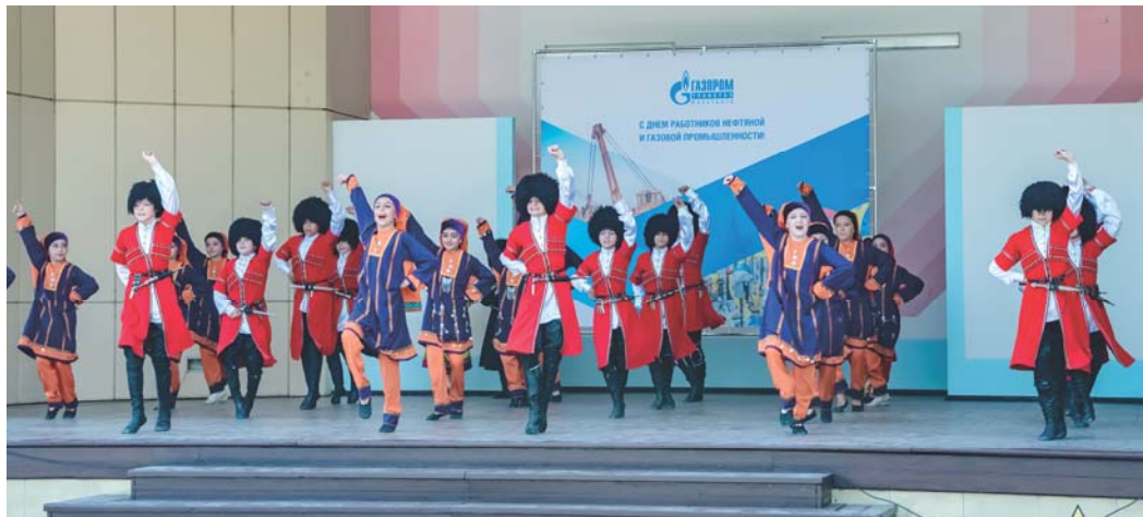
Выступления детского хореографического ансамбля «Тарки-Тай» создали праздничное настроение для газодовиков