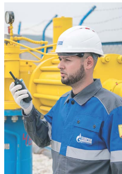
На связи с Диспетчерской службой