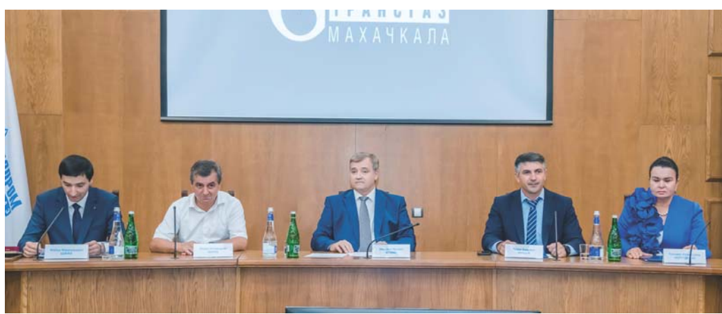
В президиуме - представители руководства Республики Дагестан

В июне текущего года состоялось важнейшее событие для Компании – Годовое Общее собрание акционеров ПАО «Газпром». Как