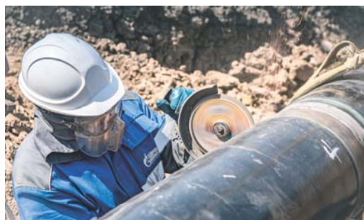
С ЗАДАЧЕЙ СПРАВИЛИСЬ ДОСРОЧНО О проведенных предприятием комплексах огневых работ Стр. 3