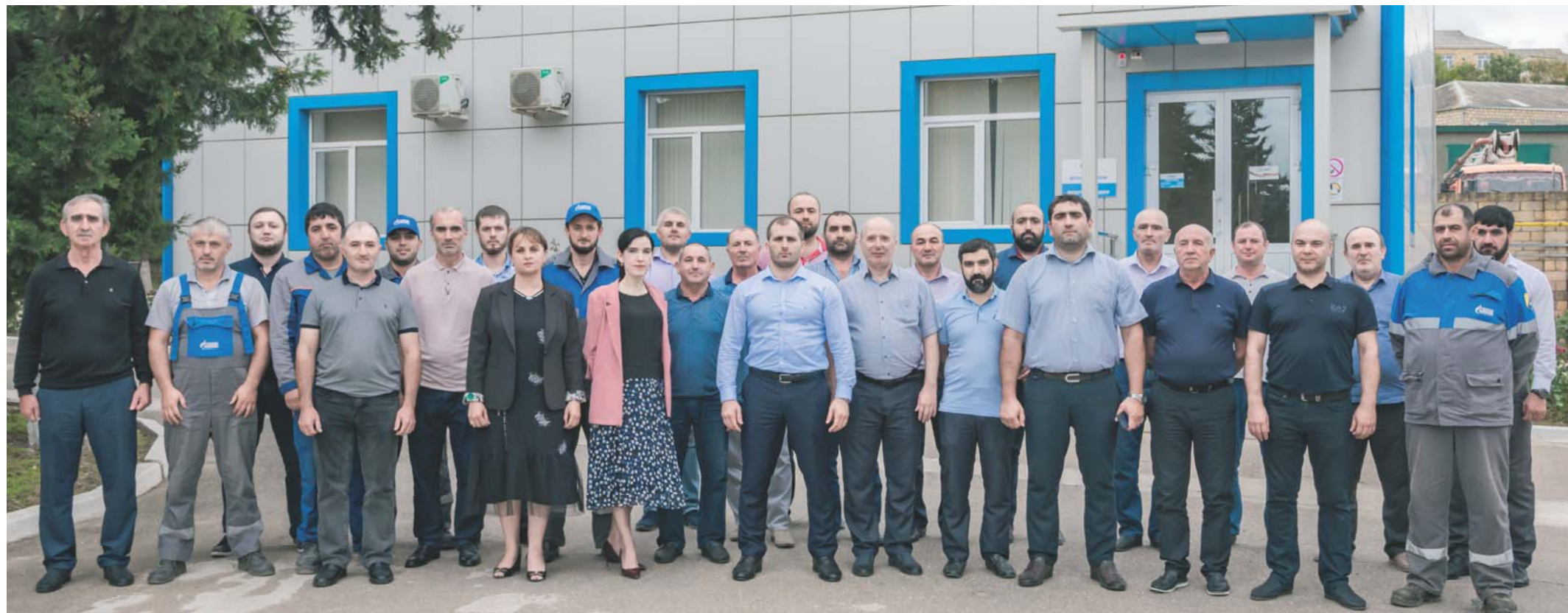
Коллектив Дербентского ЛПУМГ