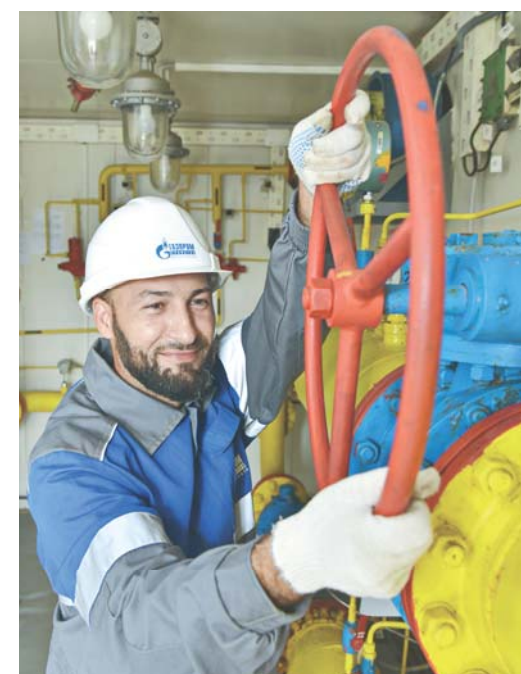
Оператор АГРС «Дагестанские огни»