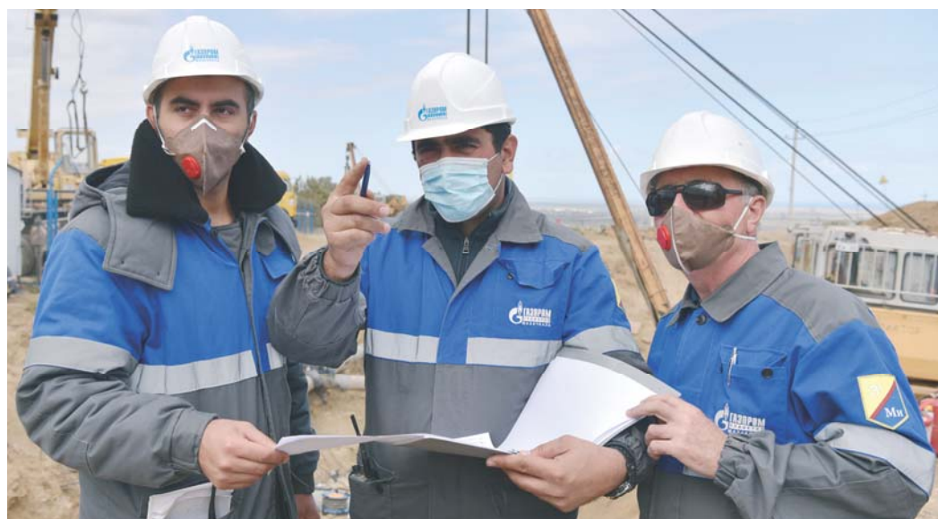
Распределение фронта работ на огневых под руководством главного инженера Дербентского ЛПУМГ