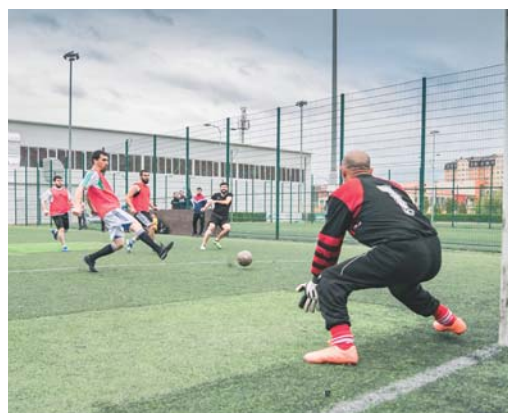
"Механик" в защите