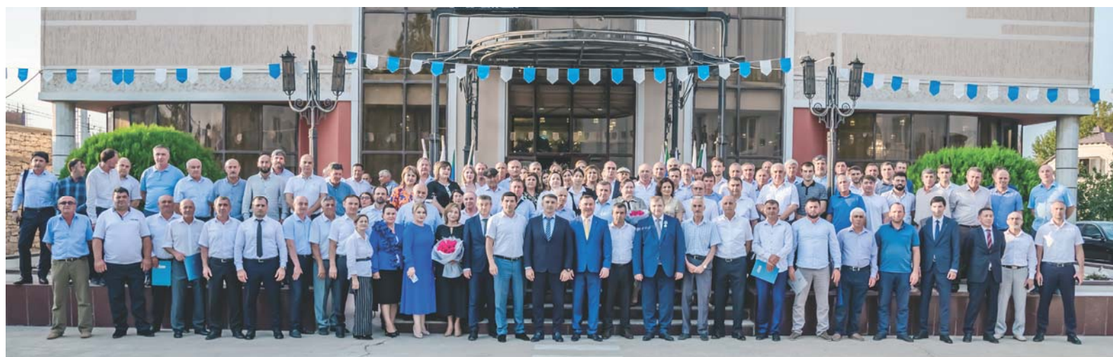
Участники торжественного собрания

Капитальный ремонт ведется на 6 ГРС, планово-предупредительные работы – на 106 ГРС. В рамках капитального ремонта ведутся