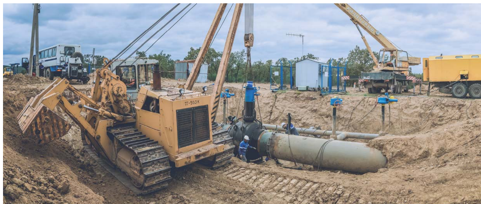
Работает тяжелая техника