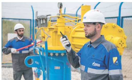
30 ЛЕТ СЛАВНОЙ ДЕЯТЕЛЬНОСТИ ЮЖНОГО ФИЛИАЛА ОБЩЕСТВА К юбилею Дербентского управления Стр. 4-5