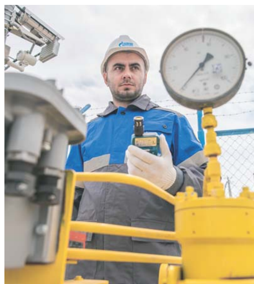
Инженер ЛЭС на крановой площадке