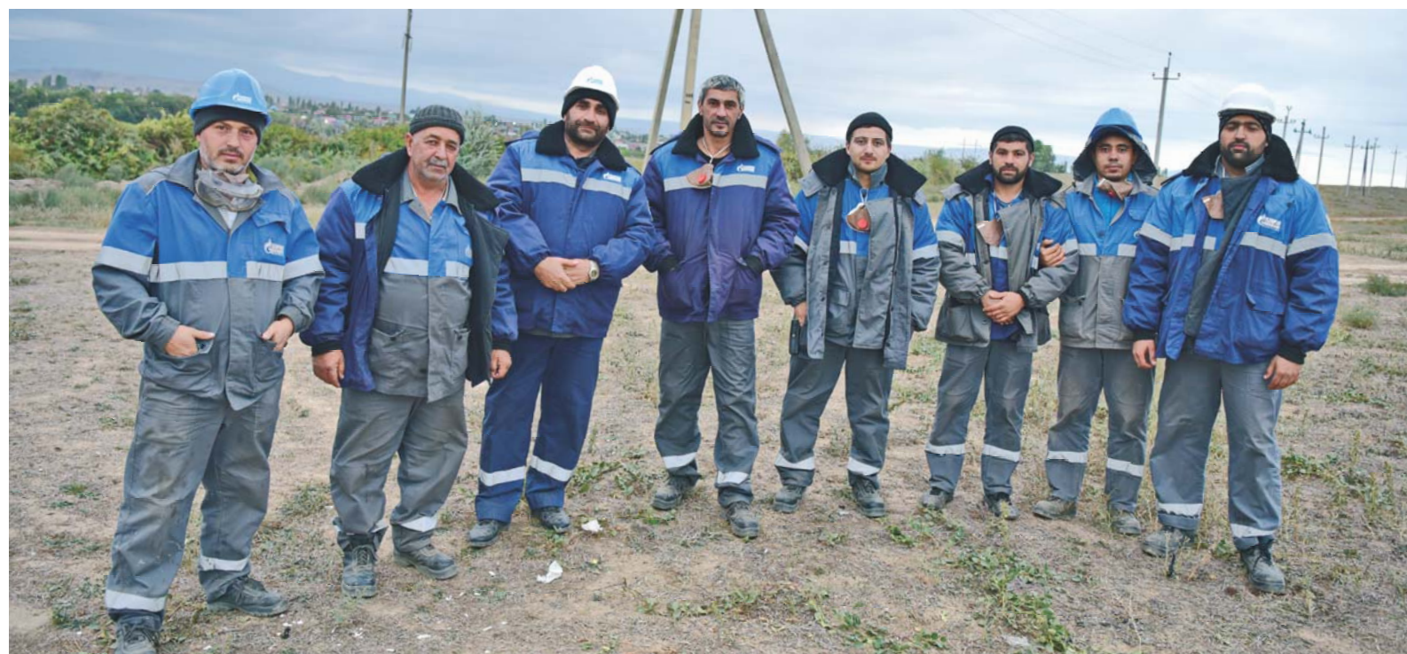
Рабочие и специалисты Дербентского ЛПУМГ во время обеденного перерыва на огневых