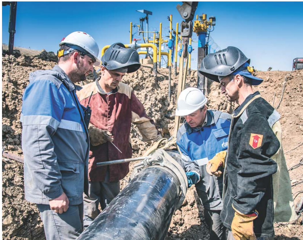
Работы на 9,7 км МГ "Закольцевание"

В период с 30 августа по 1 сентября ООО «Газпром трансгаз Махачкала» провело комплексные огневые работы по подключению капитально отремонтированного участка с 9,7–16,5 км на МГ «Закольцевание» к действующему газопроводу, а так-