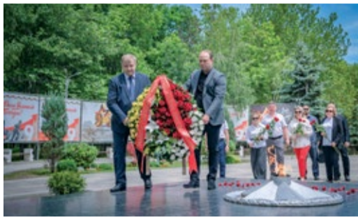
НАРОДНЫЙ ПОДВИГ В ПАМЯТИ ПОТОМКОВ Работники Общества провели мемориальную акцию «Свеча памяти» Стр. 2