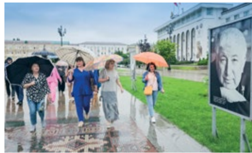
100-ЛЕТИЮ ВЫДАЮЩЕГОСЯ ПОЭТА ПОСВЯЩАЕТСЯ... Пешие экскурсии для работников Стр. 6