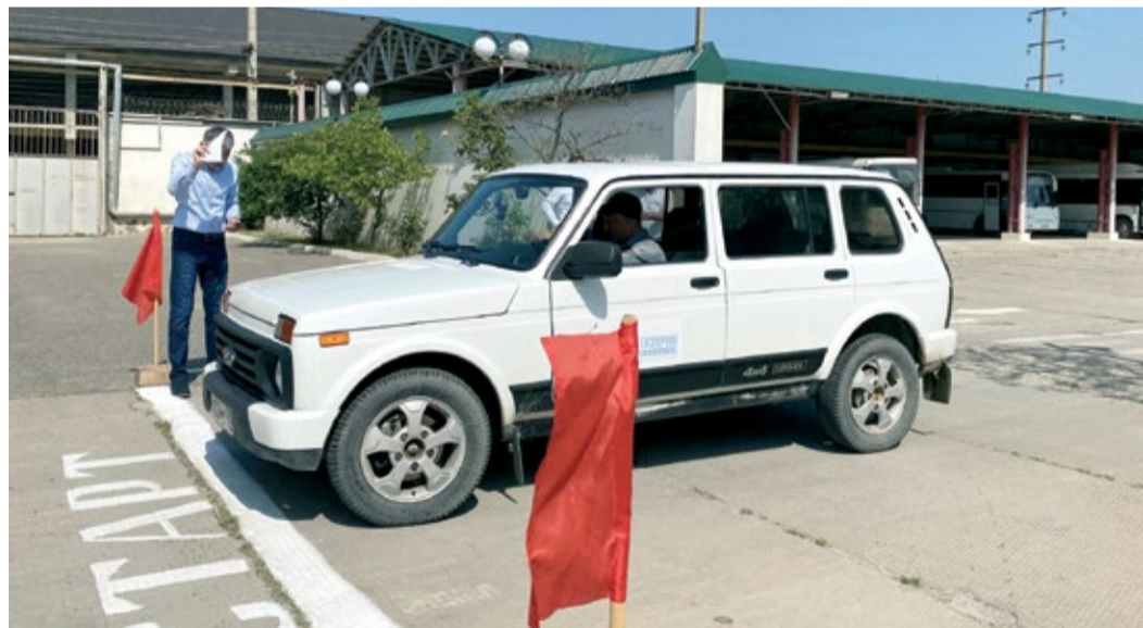
Практическая часть конкурса «Лучший водитель легкового автомобиля – 2023»

В есенняя серия корпоративных конкурсов профессионального мастерства на звание «Лучший» завершена. Об итогах некоторых из них мы расскажем в этом материале.