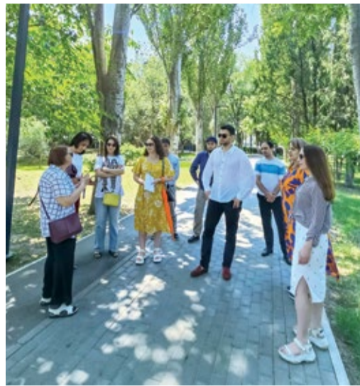
На любимой аллее поэта