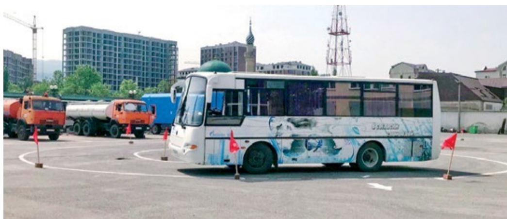
Участник конкурса «Лучший водитель автобуса – 2023» выполняет элемент «круг»

Участниками очередного конкурса профессионального мастерства, прошедшего на предприятии стали пять операторов газораспре-