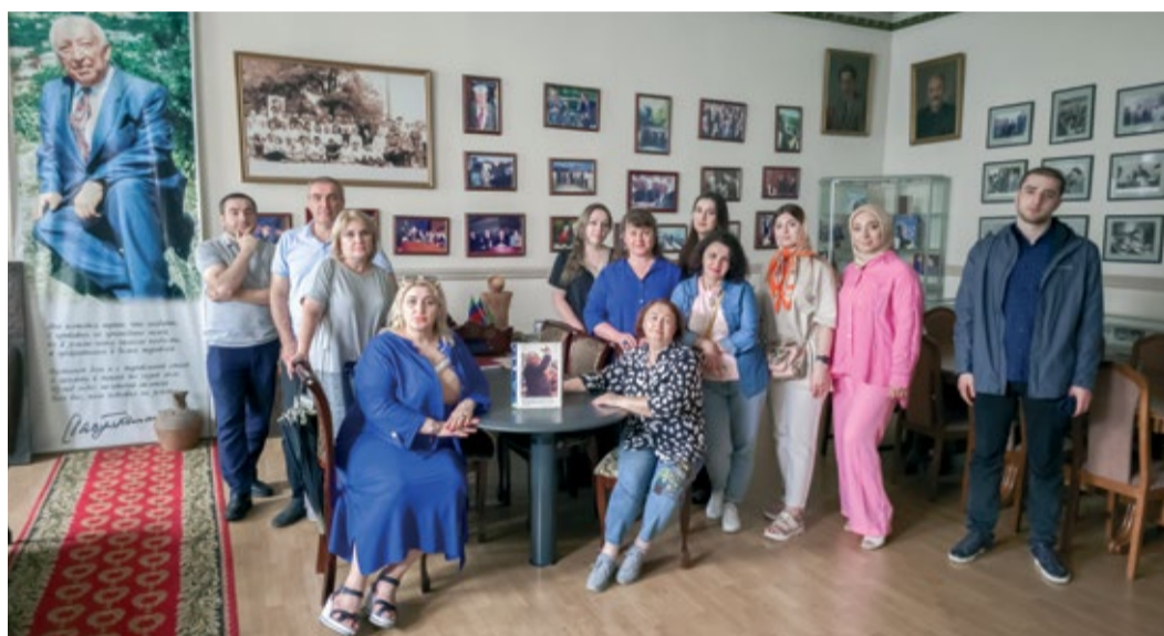
В рабочем кабинете народного поэта