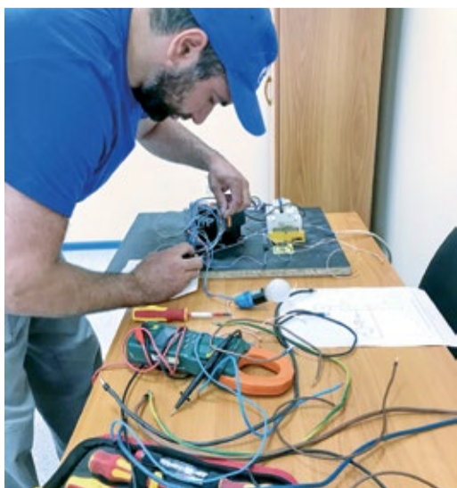
Сборка электрической схемы и замена изолятора на конкурсе «Лучший электромонтер по ремонту и обслуживанию электрооборудования – 2023»

По традиции конкурс состоял из двух этапов. В ходе теоретического этапа участники прошли компьютерное тестирование по 30 вопросам на знание требований нормативно-технической документации по направлению деятельности эксплуатации ГРС. Практическая часть конкурса прошла на учебном полигоне УПЦ, где участники выполнили три задания,