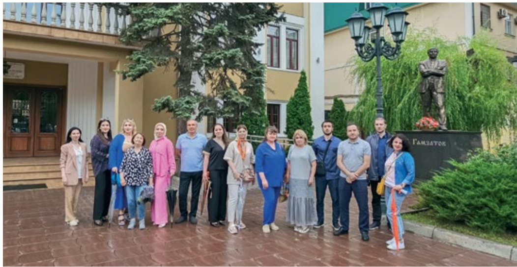
У памятника Расулу Гамзатову