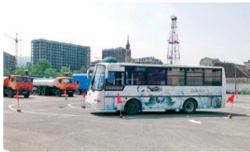
ПРОФЕССИОНАЛЫ В СВОЕМ ДЕЛЕ Подведены итоги конкурсов профмастерства на звание «Лучший» Стр. 3, 5