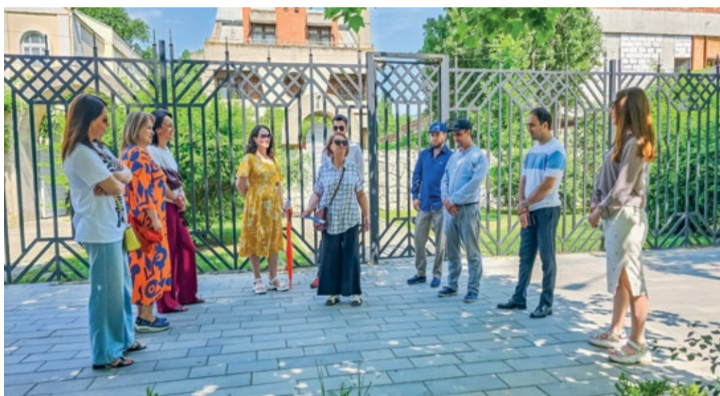
У дома литератора