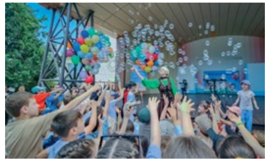
ПЕРВЫЙ ДЕНЬ ЦВЕТНОГО ЛЕТА-ПРАЗДНИК ДЕТСТВА И ДОБРА! Как мы отпраздновали день защиты детей Стр. 7