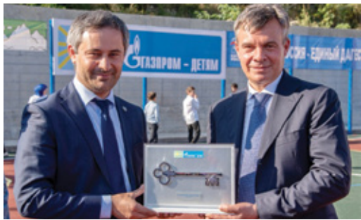
ПРОЕКТ «ГАЗПРОМ-ДЕТЯМ» В ДЕЙСТВИИ Торжественное открытие спортивной площадки состоялось в с. Миарсо Стр. 4