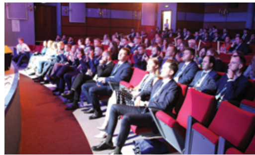
ЯРКИЕ СОБЫТИЯ ЖИЗНИ МОЛОДЫХ РАБОТНИКОВ КОМПАНИИ О семинар-совещании молодежных лидеров Стр. 6