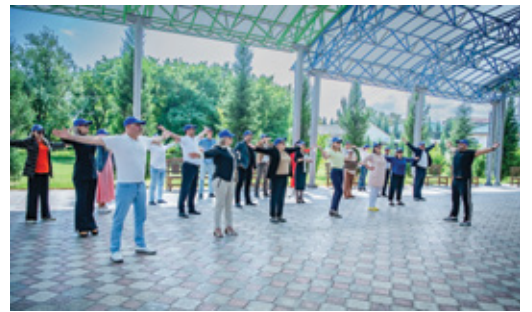
ДЕЛАЕМ ВСЕ ВМЕСТЕ ЗАРЯДКУ НА РАБОЧЕМ МЕСТЕ! Акция хорошего настроения Стр. 7