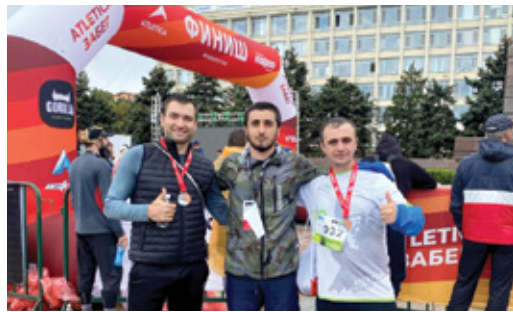
И ЗАБЕГ, И ДОБРОЕ ДЕЛО Работники Общества – участники благотворительного забега Стр. 5