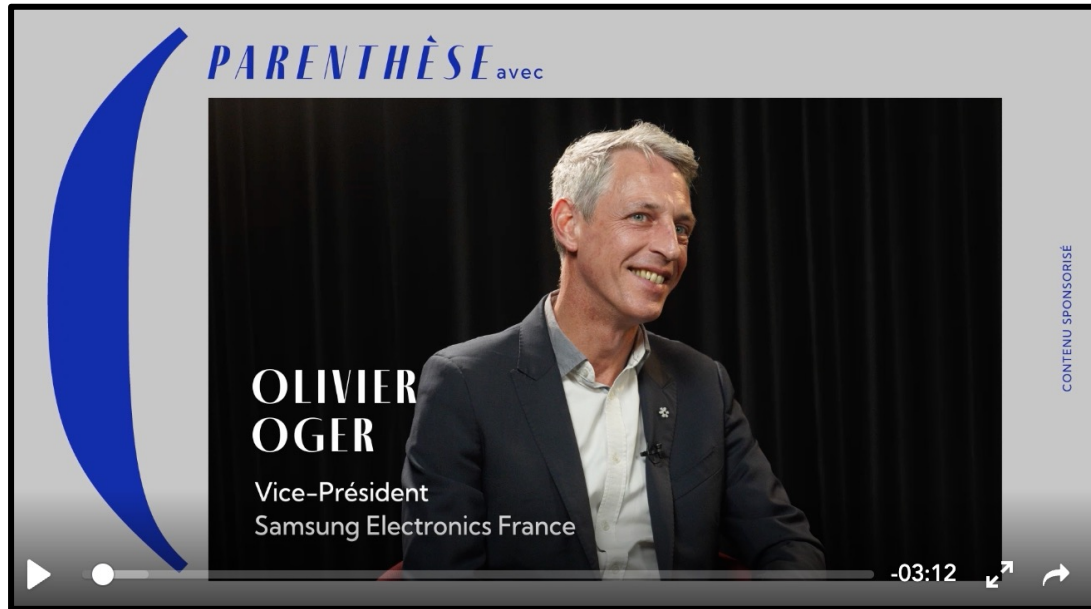
Exemple de vidéo « Parenthèse avec » pour Samsung France